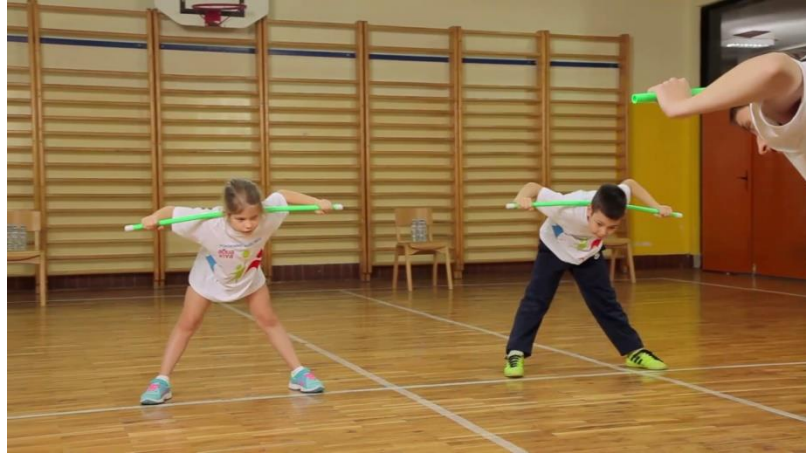
Slika 4. Opće pripremne vježba s palicom

Redosljed vježbi u pravilu određuju dijelovi tijela (vrat, ruke i rameni pojas, trup, zdjelični pojas i noge), te je najbitnije da budu obuhvaćeni svi dijelovi tijela. Opće pripremne vježbe mogu se provoditi u mjestu i kretanju, i to bez pomagala i s pomagalima.