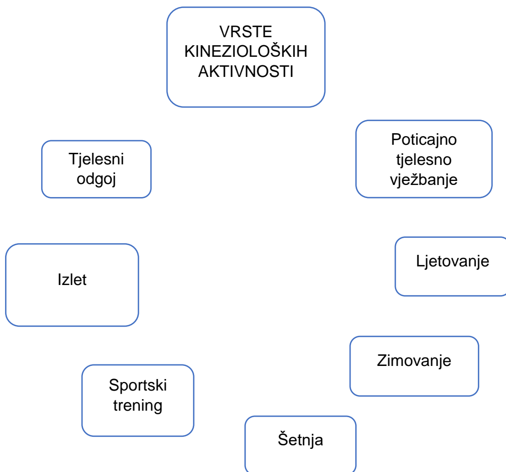
Slika 2. Vrste kinezioloških aktivnosti

Djeca rane i predškolske dobi počinju vrlo brzo tijekom rasta i razvoja savladavati mnoge osnovne pokrete, ali su premladi za većinu organiziranih sportova. Za djecu rane i predškolske dobi najbolja je nestrukturirana slobodna igra, koja može uključivati: trčanje, skok, preskakanje i skakanje, prevrtanje, bacanje i hvatanje, plivanje, vožnja biciklom. Autor Vilko Petrić (2019) u svojoj knjizi „Kineziološka metodika u ranom i predškolskom odgoju“ ističe da kineziološke aktivnosti u ranom i predškolskom odgoju i obrazovanju predstavljaju različite vrste tjelesnog vježbanja za djecu rane i predškolske dobi, čija je svrha osigurati motoričku pismenost djece kako bi se omogućio optimalan razvoj antropoloških obilježja. Slika 2. predstavlja vrste kinezioloških aktivnosti za djecu rane i predškolske dobi u predškolskom odgoju.