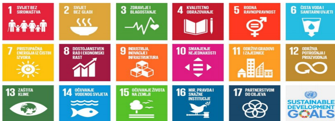
Slika 1: Globalni ciljevi održivog razvoja