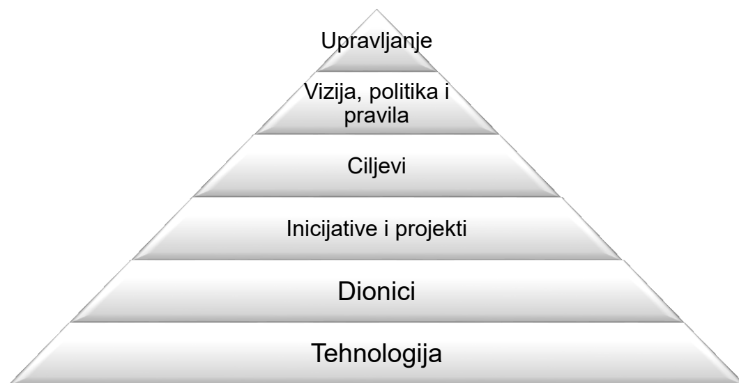
Slika 2: Bottom up koncept pametnog grada