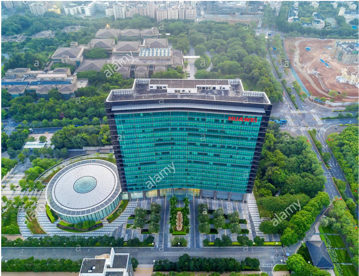
Slika 3. Sjedište tvrtke Huawei u Schenzhenu u Kini