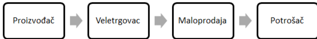
Slika 2. Kanal distribucije na tržištu krajnje potrošnje