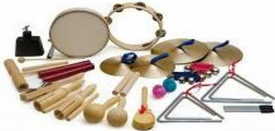
Immagine 3. La rappresentazione degli strumenti di Orff 45

xilofoni, metallofoni e vari strumenti a percussione. L'obiettivo può essere specifico ed è determinato quando le difficoltà e le esigenze del bambino sono state identificate. L'obiettivo generale è sempre lo stesso per tutti i bambini, vale a dire lo sviluppo della creatività, della curiosità e della spontaneità. Il metodo Orff inizia con il riscaldamento attraverso il quale i bambini si conoscono e viene incoraggiata l'interazione di gruppo. Dopo il riscaldamento, il terapeuta inizia l'attività principale presentando un'idea per l'improvvisazione individuale e di gruppo. Questa idea può essere realizzata attraverso una melodia, un ritmo, un movimento, una canzone o uno strumento che dipende da ciascun membro del gruppo e dalla sua improvvisazione. (Škrbina 2013)