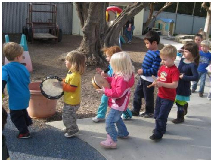
Immagine 1. Outdoor musical and movement by preschool children 8

Il bambino così attraverso attività musicali che sono incorporate nel gioco inconsciamente adotta vari contenuti musicali. Quando il bambino partecipa al gioco creativo con tutto il suo essere, si trova completamente impegnato in queste situazioni, ma anche aperto, spontaneo, creativo e fantasioso. Nola 7 dà una buona affermazione dicendo che il gioco creativo porta in sé la gioia della scoperta e il piacere della creazione.