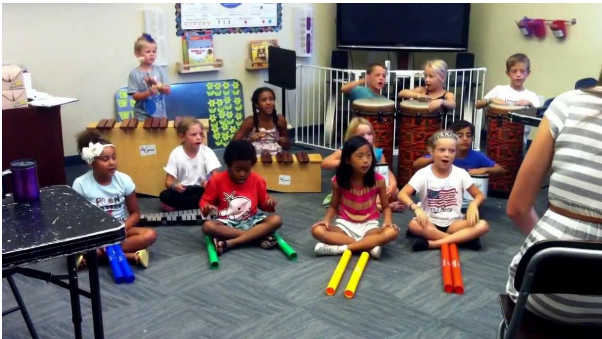
Immagine 2. Body Percussion Rhythm Activities- Let's Play 21

Secondo Kratus, gli alunni dovrebbero essere introdotti all'abilità dell'improvvisazione tenendo conto di questi livelli di sviluppo. In questo modo è possibile introdurre all'improvvisazione musicale anche i bambini più piccoli.