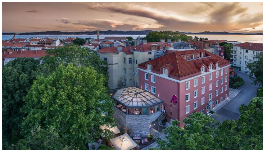
Slika 9. Hotel Bastion – eksterijer

Bastion heritage hotel (sl. 9 i sl. 10) se nalazi u staroj jezgri grada Zadra i nosi četiri zvjezdice. Namještaj je ručno izrađen a kuhinja je mediteranska. On je boutique hotel koji odiše kulturnim nasljeđem grada u kojem se nalazi. Zidine hotela datiraju iz 13. st. Kao i u Life Palace hotelu, Bastion se nalazi u neposrednoj blizini važnih atrakcija poput „Morskih orgulja“ i „Pozdrava suncu“. Hotel je prešao od zaboravljene znamenitosti do hotela s četiri zvjezdice. Zadar je nekoć bio obrambeni grad, a sada je mjesto uživanja u brojim hotelima baštine. Hotel su bili ostatci obrambene ugaone kugle, a sada je luksuzan i suvremeni objekt u okuženju opipljive povijesti i kontrasta. Ponuda vrhunskih vina je u hotelskom restoranu Kaštel. Vizija restorana se zasniva na namirnicama koje pričaju priču o tradiciji grada i okolice (domaći sir, maslinovo ulje i sl.) Važan je balans svježine i jednostavnosti jer strast za aromama je tipični sastav dalmatinske obiteljske kulture. Osim toga, mir duha i tijela je slogan wellness centa Castello . Wellness je inspiriran antičkim tajnama ljepote. Hotel ima i konferencijsku salu opremljenu suvremenom tehnologijom. 57 Hotel Bastion je smješten na izuzetno zahvalnoj lokaciji jer Zadar spaja čak pet Nacionalnih parkova i tri parka prirode. I bilo gdje da se kroči oko hotela, tu su već kročili Habsburgovci, Napoleon, Mlečani, Bizantinci, Rimljani i Iliri.