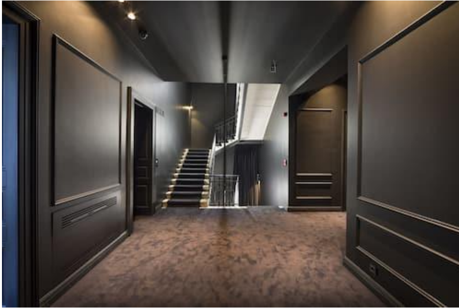
Slika 6. Hotel Adriatic- interijer