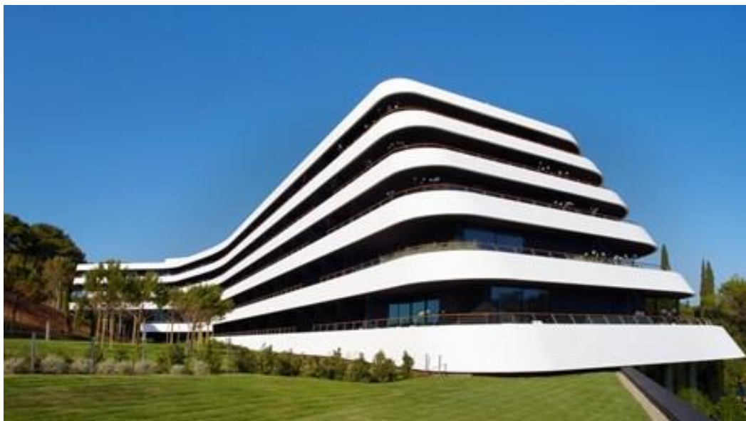
Slika 1. Hotel Lone – eksterijer