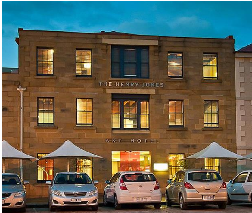
Slika 21. The Henry Jones art hotel – eksterijer