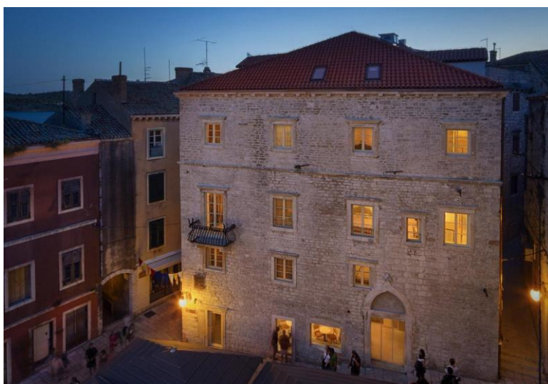
Slika 8. Heritage hotel Life palace – eksterijer