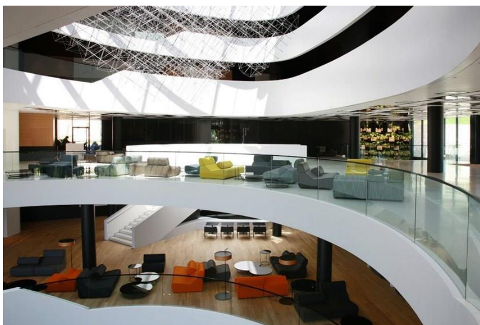
Slika 2. Hotel Lone – interijer

Hotel Lone je primjeren primjer hotela inspiriranog kulturom i spoja suvremenosti i luksuza s tradicijom i kulturnom baštinom. Hrvatski najbolji dizajneri i arhitekti su stvorili ovaj hotel, a hrvatski najbolji umjetnici su ga estetski ukasili kako bi klijent doživio vizualno autentično iskustvo. Svaki detalj hotela u gostima budi želju za istraživanjem, baš kao što bi to učinio Muzej suvremene umjetnosti. Dizajn hotela je sinergija funkcionalnosti i elegancije, a naglasak je na umjetnosti. Odredište za