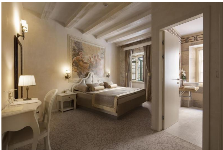
Slika 7. Heritage hotel Life palace – interijer (Izvor: https://www.hotel-lifepalace.hr/en/homepage/ , 10.7.2021.)