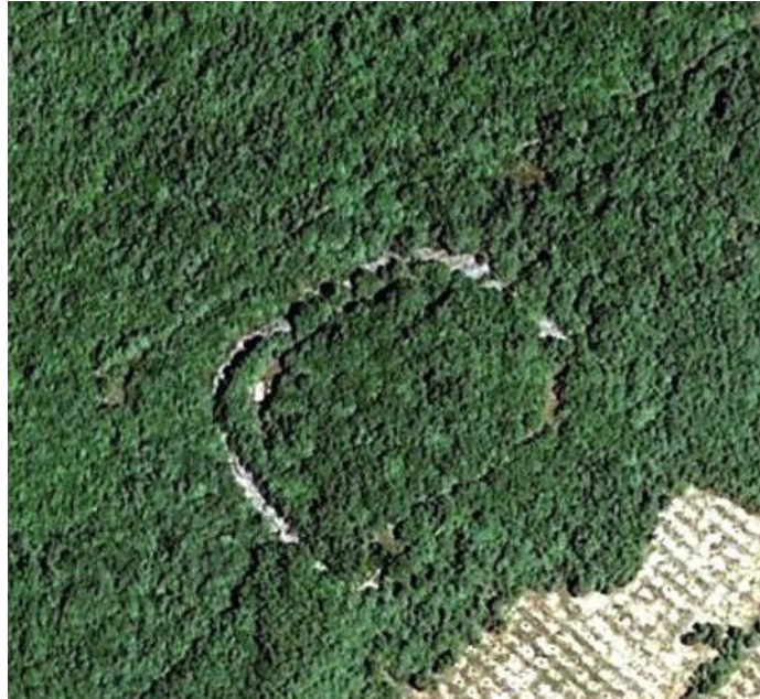
Slika 1. Zračni snimak Gradine Kunci (Kos, 2006.)