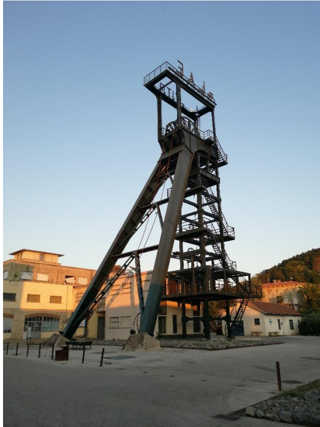
Slika 7. Labinski Šoht