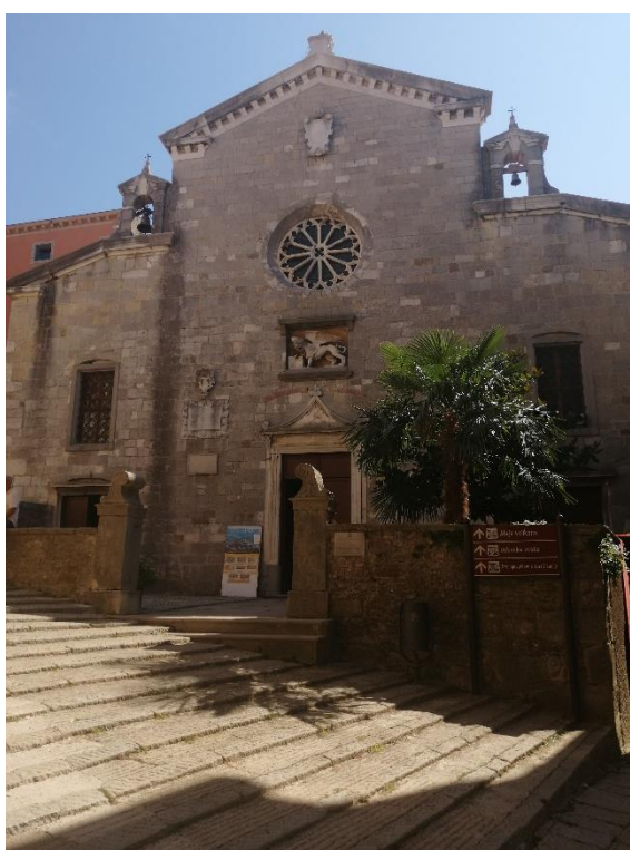
Slika 5. Crkva Rođenje blažene Djevice Marije.