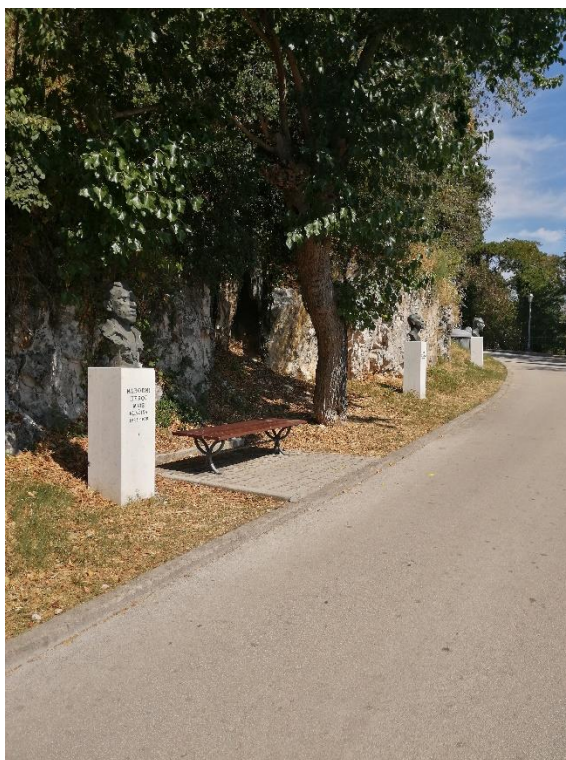
Slika 4. Aleja Velikana