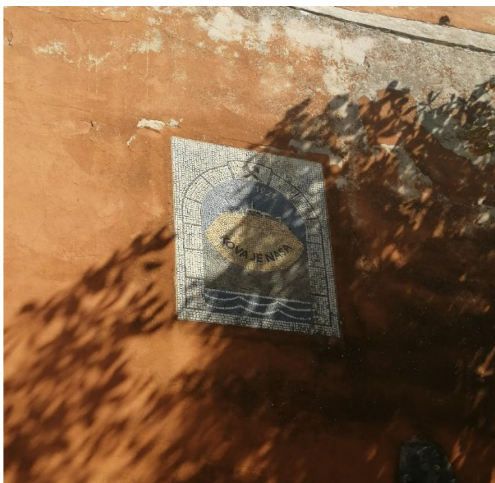
Slika 3. Grb s natpisom "Kova je nasa"