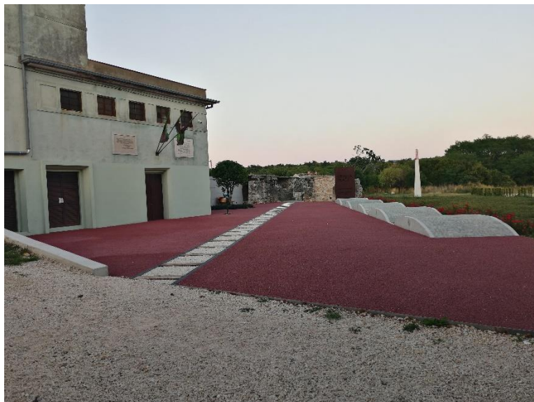
Slika 8. Krvova placa