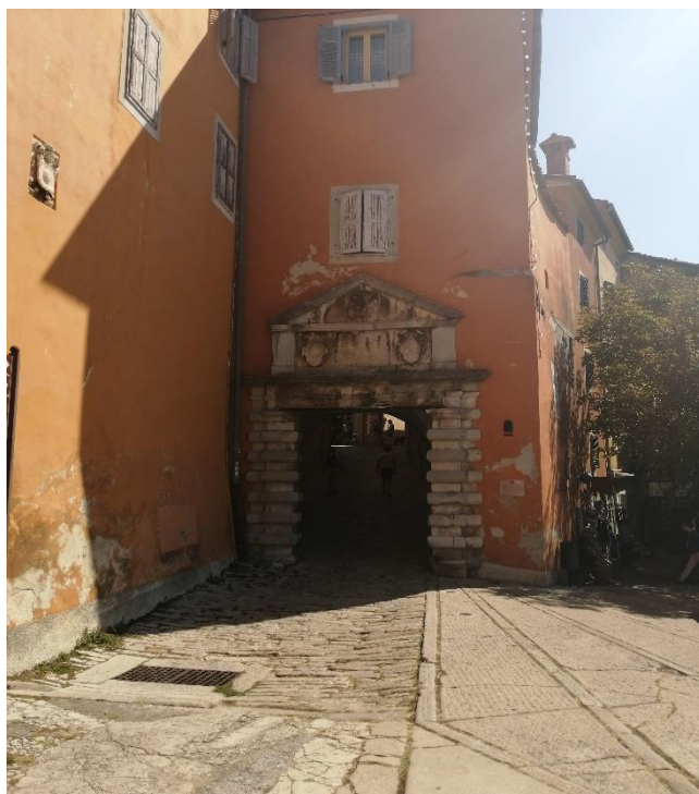
Slika 2. Vrata Sv. Flora