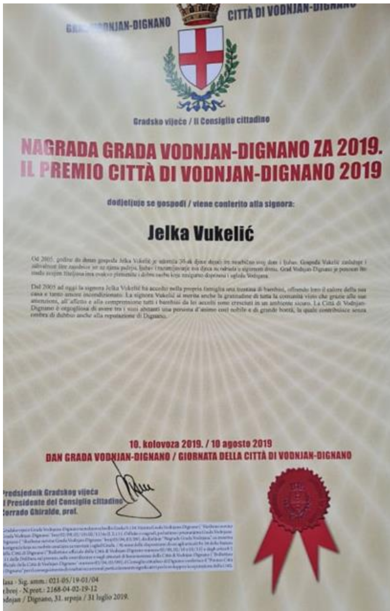
Slika 3 Nagrada od grada Vodnjana