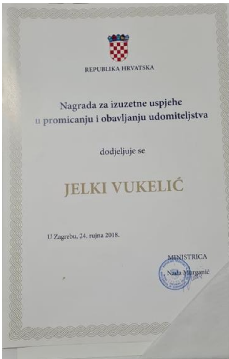
Slika 2 Nagrada od Ministarstva za demografiju, obitelj, mlade i socijalnu politiku