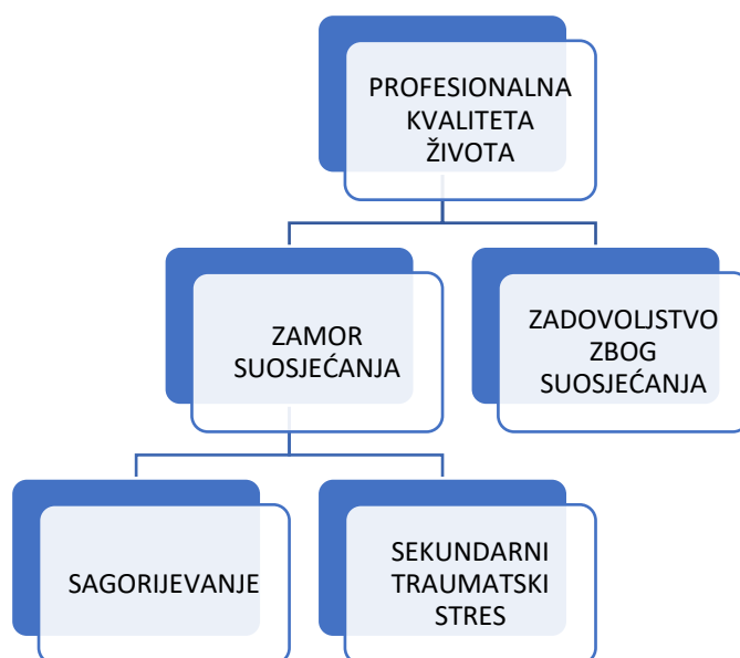
Slika 1. Profesionalna kvaliteta života

potrebna briga za drugog, osobito kod osoba koje rade s ljudima koji su preživjeli neka traumatska iskustva, kriminal ili nasilje. Zamor suosjećanja (eng. compassion fatigue ) je konstrukt koji se pojavio 90-ih godina prošlog stoljeća u području proučavanja sekundarnog stresa i traume, tj. posljedica koje mogu imati profesionalci raznih struka, koji uslijed pomaganja traumatiziranim osobama i sami mogu doživjeti patnju i bol. Naziv zamor suosjećanja prvi put je upotrijebila Carla Joinson 1992. g. u jednom sestrinskom časopisu i nazvala ga 'stanjem smanjenog kapaciteta suosjećanja, kao posljedice iscrpljenosti uslijed apsorpiranja patnje drugih'. Koncept zamora suosjećanja razvio je Charles Figley, sveučilišni profesor na poljima psihologije i obiteljske terapije, stručnjak za traumatična iskustva i istraživač u području sindroma izgaranja. Pojmom „zamor suosjećanja“ opisao je fenomen stresa, koji nastaje uslijed sekundarne, posredne traume, odnosno izloženosti traumatiziranim osobama, u odnosu na primarne traume, kojoj je osoba neposredno izložena. Prema Figleyu, zamor suosjećanja je jednostavniji i praktičniji naziv za sekundarni stresni traumatski poremećaj, koji nastaje kao posljedica duboke uključenosti u probleme i patnje traumatiziranih osoba (Perković, Pukljak Iričanin, 2019.) Suosjećanje umora nije dijagnoza, te je važno naglasiti da ljudi mogu osjećati posljedice umora od suosjećanja bez razvoja PTSP-a. No, zamor povećava mogućnost PTSP-a i depresije (Stamm, 2010.).