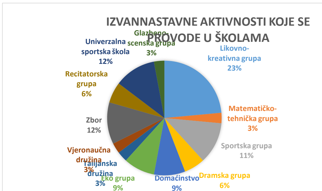
Grafikon 2. Izvannastavne aktivnosti koje se provode u školama u postotcima

Gledajući rezultate možemo zaključiti da su učenici najviše zainteresirani za likovno – kreativne aktivnosti, a slijede ih sportske aktivnosti što je jako dobro jer to znači da su učitelji kod svojih učenika osvijestili potrebu za vježbanjem i zdravim načinom života.