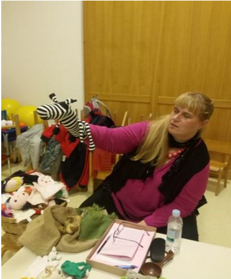
Slika 11. Odgojiteljica i lutka, https://dv-grlica.hr/2019/11/14/lutkarski-studio-kvak-u-dječjem-vrtu-grlica/ (pristupljeno 24. 8. 2021).