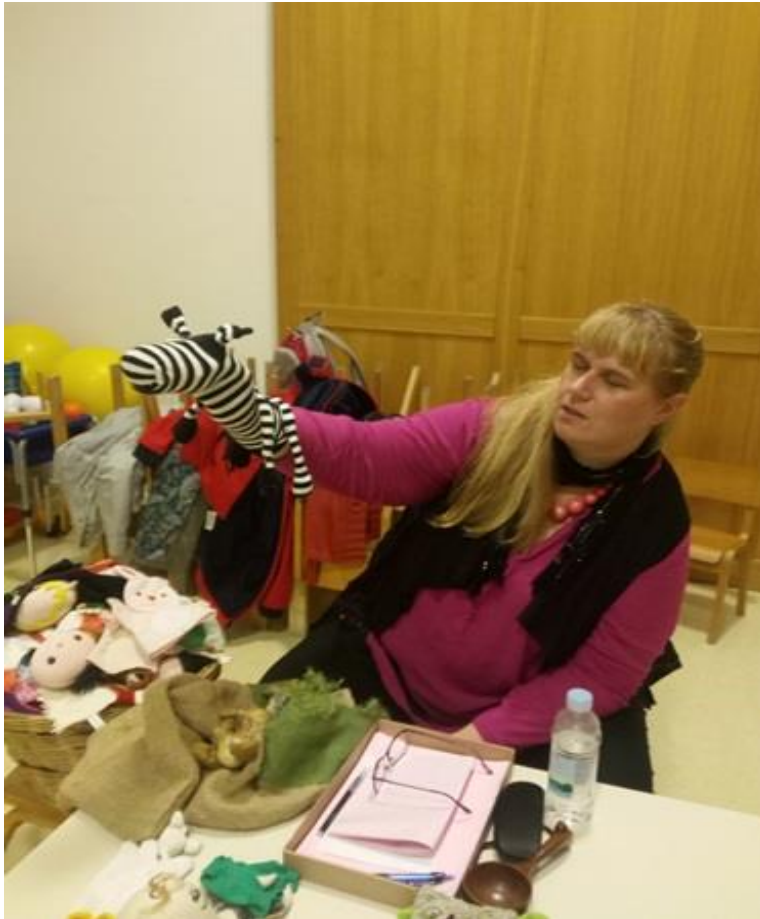
Slika 11. Odgojiteljica i lutka, https://dv-grlica.hr/2019/11/14/lutkarski-studio-kvak-u-dječjem-vrtiu-grlica/ (pristupljeno 24. 8. 2021).