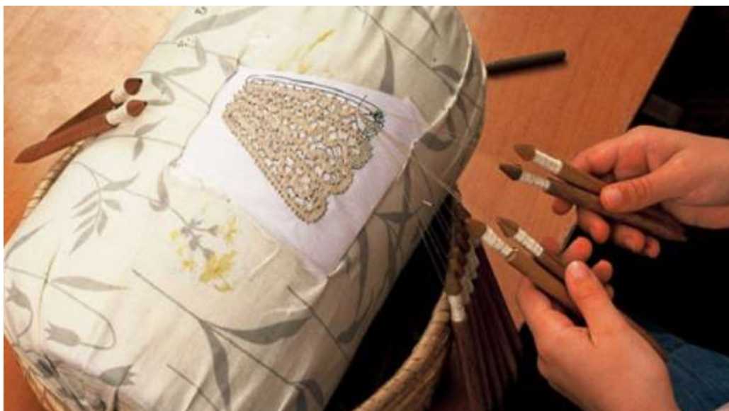
Slika 3. Lepoglavska čipka - čipka na batiće

je unosila elemente drvorezbarstva i folklornog ruha s područja cijele Hrvatske. Time je lepoglavskoj čipki dala poseban izgled koji ju je izdvajao od svih čipki toga vremena. Neki od motiva jesu tulipan, jaglac, žir, leptir i ptica. Tradicija lepoglavskog čipkarstva prenosila se s koljena na koljeno. Danas se poduzimaju određene mjere kako bi se očuvala tradicija čipkarstva. Jedna od mjera jest održavanje međunarodnog čipkarskog festivala u Lepoglavi, od 1997. (Eckhel, 2013., str. 234. – 237.).