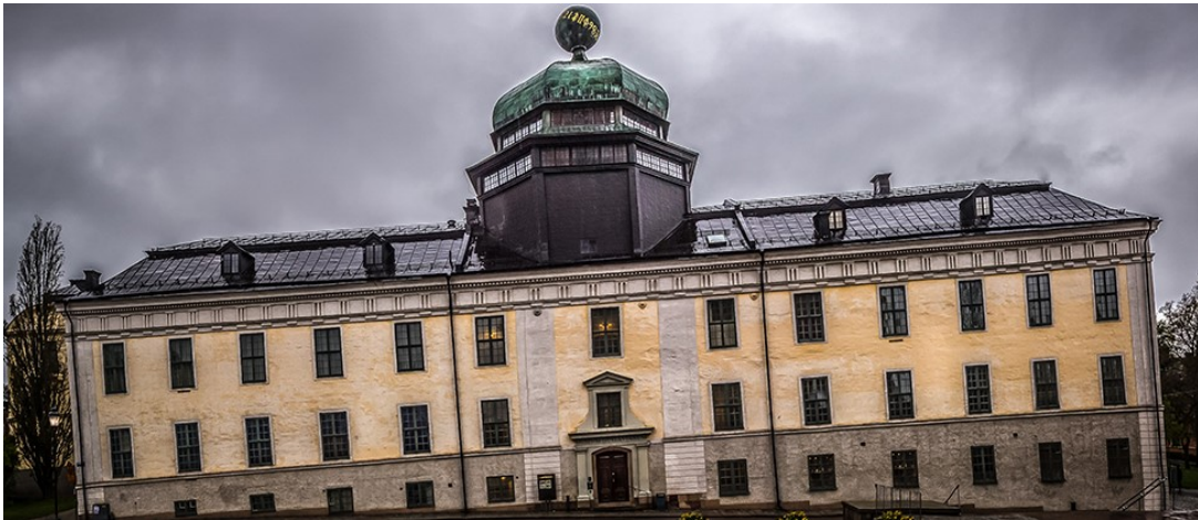
Slika 20 Sveučilišni muzej Gustavianum

Gustavianum , sveučilišni muzej u Uppsali, brine o sveučilišnim zbirkama arheoloških predmeta, umjetnosti, kovanica, povijesnih znanstvenih instrumenata i još mnogo toga. Zgrada muzeja, Gustavianum, arena je za interakciju između Sveučilišta i društva. Na izložbama važni i fascinantni predmeti iz zbirke prikazuju se javnosti, a izložbene ideje i program događaja nadahnuti su i odražavaju istraživanja na Sveučilištu Uppsala.