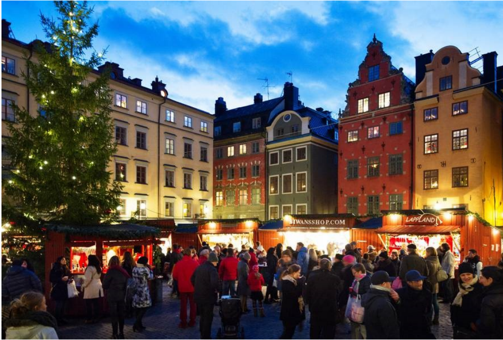
Slika 7. Gamla Stan u Stockholmu

Palača Drottningholm rezidencija je švedske kraljevske obitelji i prvo je mjesto u Švedskoj koje je UNESCO uvrstio na popis Svjetske baštine 1991. godine. Drottningholm je popularna turistička atrakcija, smještena zapadno od Stockholma. Osim Kraljevske palače, Drottningholm sadrži vrtove iz različitih razdoblja, kao i kineski paviljon i kazalište. Palača Drottningholm reprezentativna je za zapadnu i sjevernu europsku arhitekturu 17. i 18. stoljeća, a u tom su razdoblju stvoreni i prostori palače. Palača je stvorena s jakim referencama na talijansku i francusku arhitekturu iz 17. stoljeća. (Visit Sweden, 2021., UNESCO, 2021.)