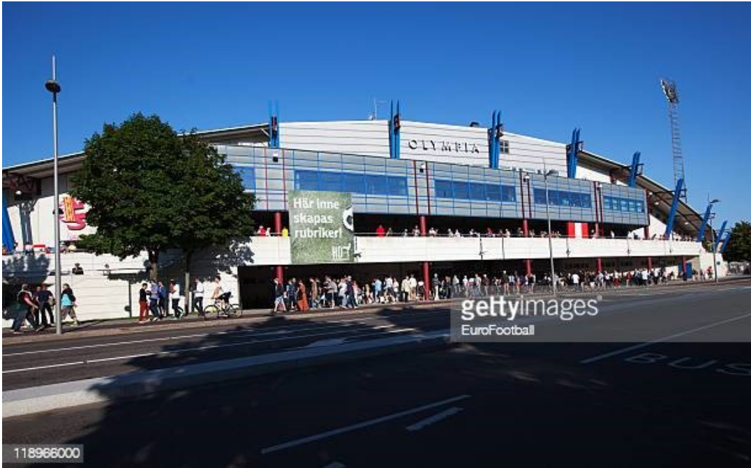
Slika 29. Stadion Olympia

Vikingsberg je vila s pripadajućim parkom smještena u seoskom dvorcu u Helsingborgu. Vila je nekad funkcionirala kao općinski muzej umjetnosti, kasnije privatna umjetnička galerija, ali danas je ured za kulturnu upravu grada Helsingborga. Vila je 1967. godine postala zaštićena zgrada. (Lansstyrelsen Skane, 2021.)