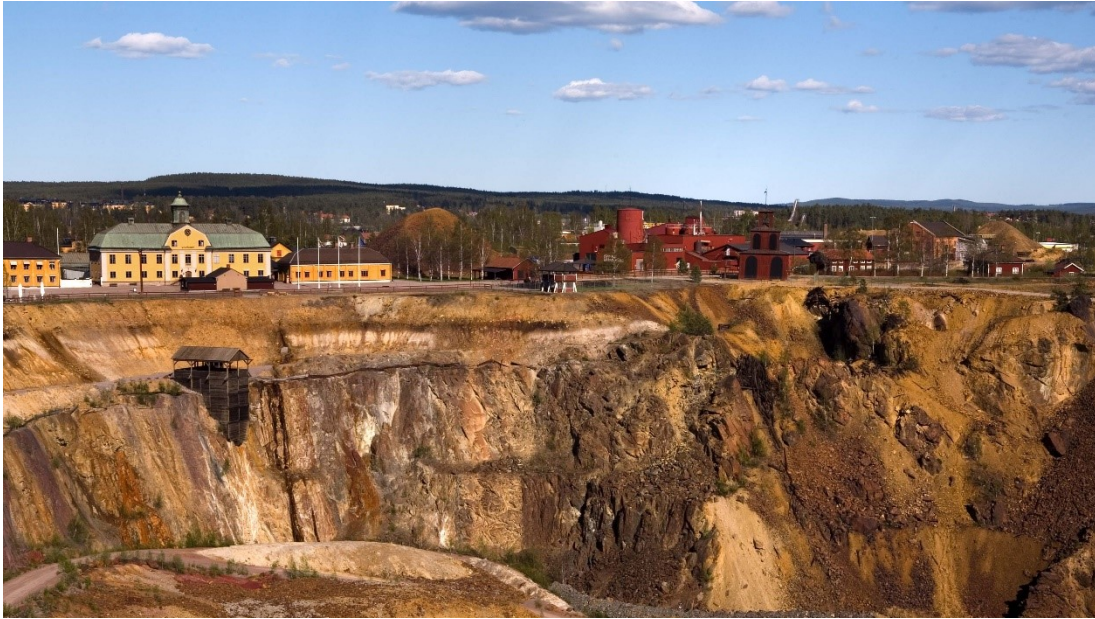
Slika 24. Velika jama u Falunu