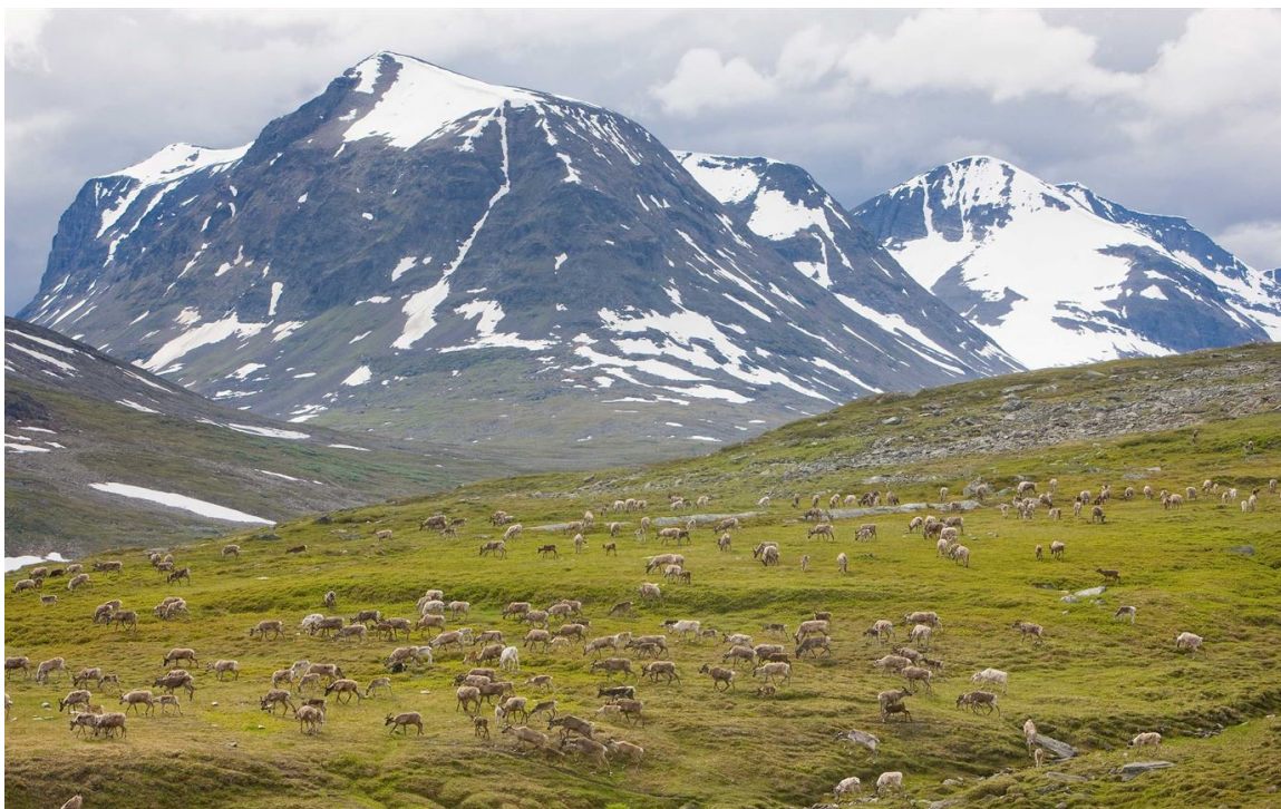
Slika 3. Nacionalni park Sarek

doline, proširujući ih i zaokružujući. Njoatsosvágge u Sareku primjer je takve klasične doline u obliku slova U gdje je ledena ploča zaokružila konture. Razlog zašto je krajolik toliko upečatljiv je amfibolitna podloga koja se posebno dobro odupire eroziji. Na neplodnim planinama i stjenovitim podlogama na visokim uzvišenjima ne raste puno. Međutim, lišajevi, mahovine, patuljaste vrbe i mala količina trave i drugih biljaka dobro se slažu u visokim alpskim dijelovima planina Sarek. Unutar planinskih brezovih šuma leže livade s visokim planinčicama, vučjom korom, ždralovom biljkom i crvenim kampom. U Sareku se mogu ugledati medvjedi, vukovi, risovi ili neke od neobično velikih losova. U zelenim brezovim šumama mogu se naći vrbove vrpce, trbušnjake, plave vrpce, plave grla i izmrvljene muholovce. U malim jezerima plivaju čupave patke i druge male ptice, također ima mnogo ptica grabljivica poput zlatnih orlova, grubonogih zubaca i merlina. (National Parks of Sweden, 2021.)