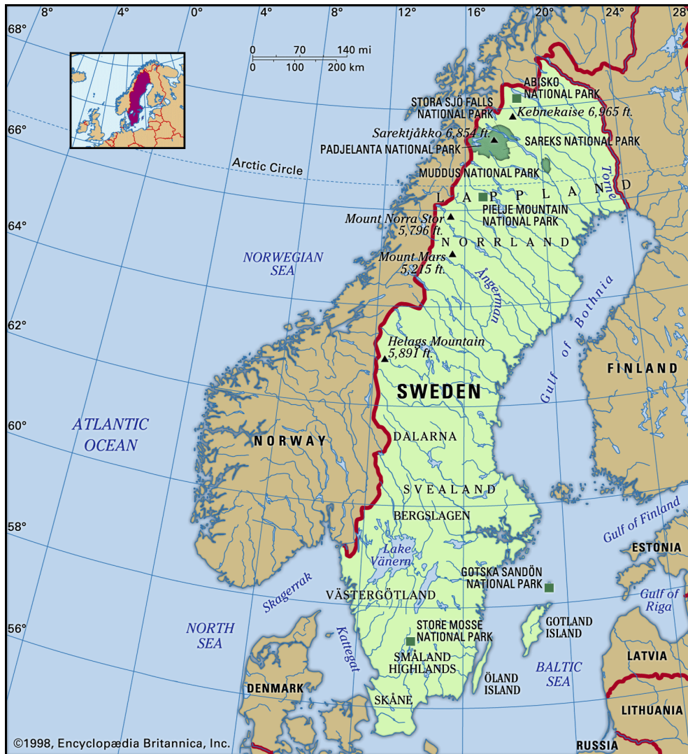
Slika 1. Prikaz Švedske na karti