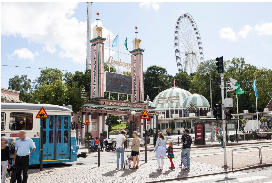
Slika 18. Zabavni park Liseberg

Zabavni park Liseberg je jedno od najpopularnijih turističkih odredišta u Švedskoj. Od 1923. Liseberg vodi zabavni park sa svoje 42 vožnje i atrakcije, igrama, igrama sreće, glazbenim pozornicama, plesnim podijem i brojnim restoranima i kafićima. (Liseberg, 2021.)