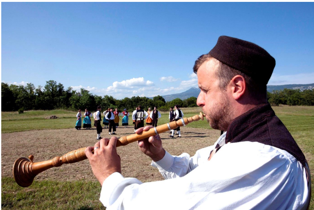
Slika 2. Vela sopela i Kršonski balon.

S područja Istarske županije, na popisu kulturnih dobara nematerijalne kulturne baštine Republike Hrvatske nalaze se: Konjička igra Trka na prstenac (Barbanština), Tradicijska pučka igra Pljočkanje (Svetvinčenat), Labinska skupina govora (labinska cakavica), umijeće pripreme tradicijske slastice Pazinski cukerančić (Pazinština), glazbena praksa violine i bajsja u Istri (Sjeverna Istra), Rovinjska bitinada, umijeće izgradnje rovinjske batane i žminjski govor, dok se na Reprezentativnom popisu nematerijalnih kulturne baštine čovječanstva pri UNESCO-u nalaze Dvoglasje tijesnih intervala Istre i Hrvatskog primorja (slika 2), Mediteranska prehrana (uključivši i druga mediteranska područja Hrvatske), umijeće suhozidne gradnje (uključivši i druga jadransko - dinarska područja Hrvatske) te Ekomuzej Batana iz Rovinja koji se nalazi na UNESCO-vom Registru dobrih praksi očuvanja nematerijalne kulturne baštine svijeta. Tu su i brojni drugi nespomenuti fenomeni.