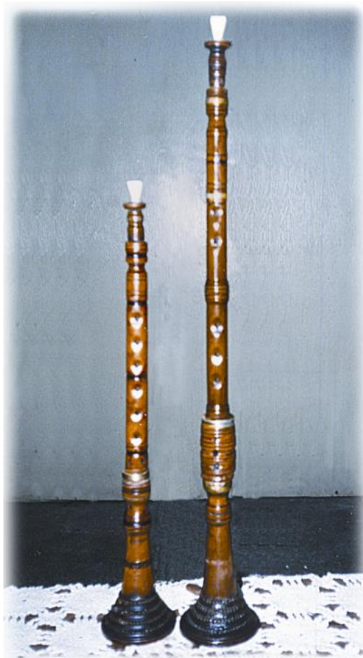
Slika 6. Vele sopele od Zlateli