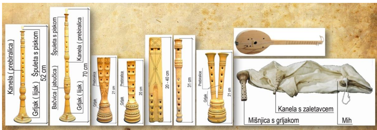
Slika 3. Narodni instrumenti Istre

Zaključno, sva četiri podstila dvoglasja u pojedinim se slučajevima kombiniraju s glazbenim instrumentima (slika 3), a to su sopele/sopile ili roženice, mih, pive, dvojnice, šurle (aerofona glazbala) i dvožica tambura (dvosložni kordofon - Cindra). 57 Posebno je zanimljivo što navedeni instrumenti u Istri dolaze u različitim vremenima naseljavanja i miješanja kultura i stanovništva, da bi danas predstavljali „izvorna“ glazbala ovih prostora. Također, valja istaknuti kako je teško odrediti granice među stilovima jer se često miješaju i isprepliću.