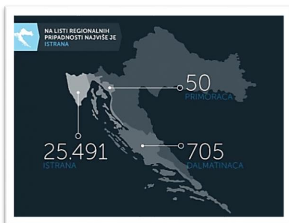
Slika 1. Regionalna opredijeljenost - popis stanovništva 2011.

S obzirom na istarske prilike, kao zanimljivost, može se istaknuti popis stanovništva iz 2011. (slika 1), ali i oni raniji iz 2001. i 1991., koji ukazuju na povećanje regionalnog izjašnjavanja u Istarskoj županiji. Prema slici 1. vidljivo je da se, prilikom popisa stanovništva 2011., veliki postotak žitelja Županije opredijelio regionalno, što potvrđuje jačanje regionalnog izjašnjavanja.