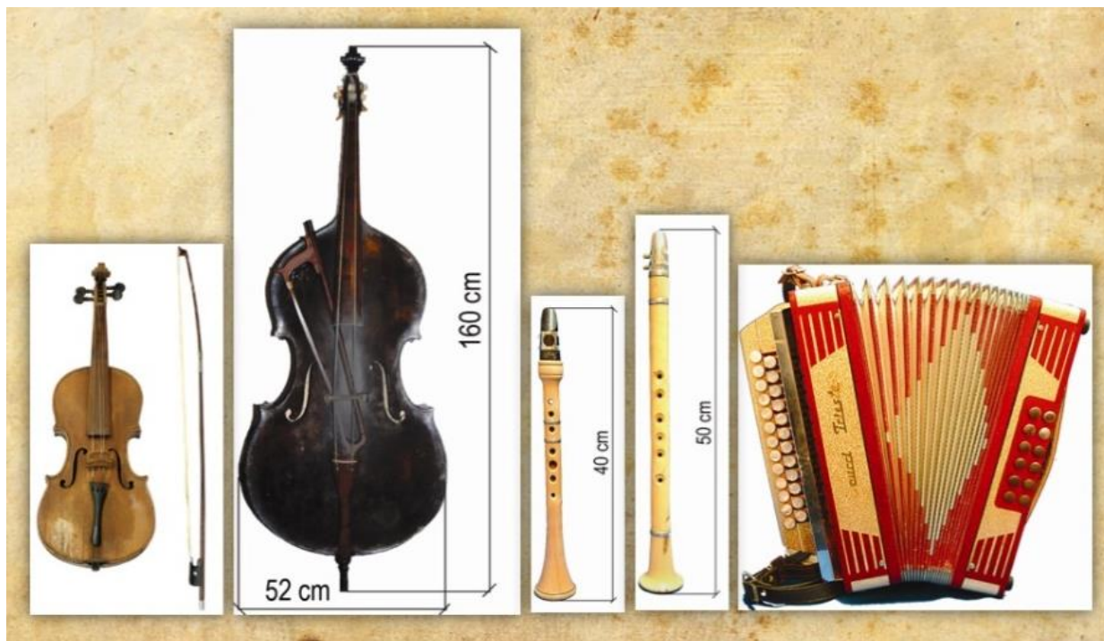
Slika 4. Violina, bas, klarineti i diatonska harmonika Trieštinka

uspješnice poput twista , polki , rock and rolla ili druge vrste, no to danas izaziva zgražavanje, jer nije izvorno pa je stoga i neprihvatljivo. Takvo promišljanje dovodi do oduzimanja prava na kreativnost i stvaralaštvo. Sve što nema prizvuk „starog“, neprihvatljivo je.