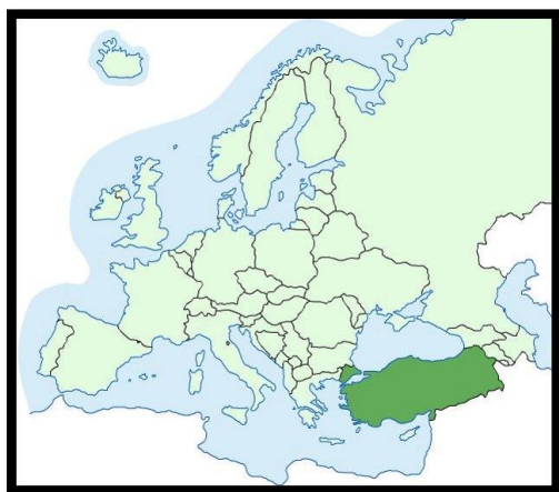
Slika 1. Geografski položaj Turske

Turska kao država koja se prostire na dva kontinenta, svojim manjim dijelom u iznosu od svega 3% pripada Jugoistočnoj Europi, dok svojim većinskim dijelom pripada Jugozapadnoj Aziji. 1 Ova zemlja se na sjeveru prostire između Crnog mora, na sjeveroistoku leži između Gruzije i Armenije, na istoku je smještena između Azerbajdžana i Irana, na jugu se prostire između Iraka, Sirije i Sredozemnog mora, na zapadu leži pored Egejskog mora, dok je na sjeverozapadu smještena između Grčke i Bugarske (sl. 1). Može se zaključiti kako teritorij Turske obuhvaća Malu Aziju i također dijelove Armenije, Kurdistana i Tracije. 2 Površina zemlje iznosi sveukupno 783, 562 km 2 . Od te brojke, na kopneni teritorij otpada 769, 632 km 2 dok na vodeni teritorij otpada preostali dio, točnije 13, 930 km 2 . Prema tim podacima, Turska je 38 zemlja po veličini na svijetu. Ukupna duljina turske obale iznosi 7, 200 kilometara. 3