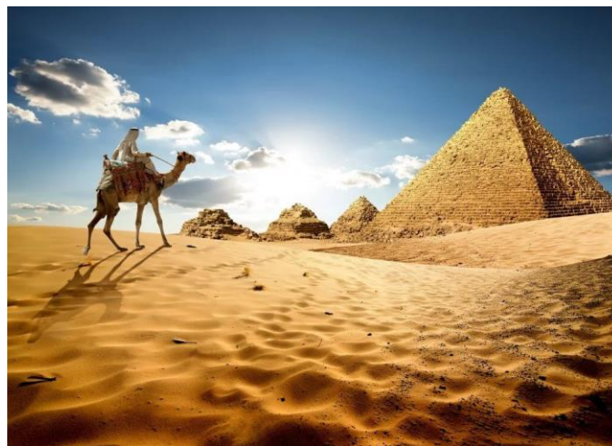
Slika 19. Egipat.

Ovakav itinerar trajao bi dugo vremena, zacijelo mjesec dana. Bilo bi puno putovanja i turisti bi morali biti fizički i psihički spremni na to. Također bi bilo skupo zbog hotelskih rezervacija i karata prijevoznih sredstava. Putovanje bi bilo namijenjeno onima koji mogu izuzeti mjesec dana svog života i pozamašan iznos da bi zauzvrat iskusili putovanje Mediteranom u stilu Predraga Matvejevića.