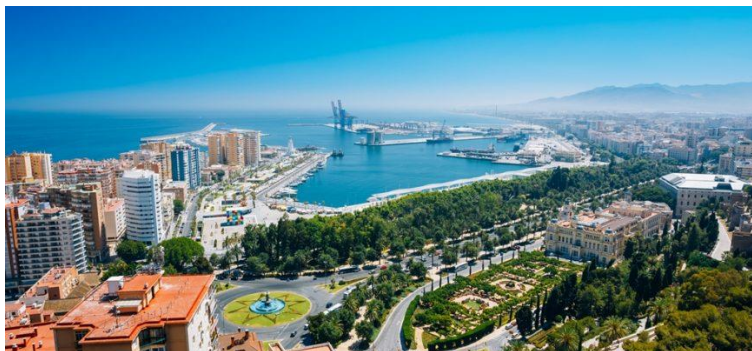
Slika 14. Malaga, Španjolska

Prema tome, ovo hipotetsko putovanje započelo bi na jugu Španjolske blizu Gibraltarskih vrata, to jest u gradu Malagi te bi se krenulo prema Valenciji gdje je Matvejević u domu gostoljubiva kolekcionara našao više vrsnih karata, među kojima i onu koja prikazuje španjolske obale. U Valenciji je također čuo da se stanovnike zaleđa naziva podrugljivim imenima, zapisao je riječ churros .