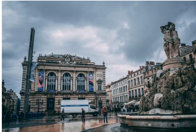
Slika 15. Montpellier, Francuska.

Avionom se odlazi u Provansu u Francuskoj u grad Montpellier. U Provansi je Matvejević čuo da vjetar mistral, koji je u Hrvatskoj inače blag i dolazi s mora, opisuju uzrečicom da „čupa magarcu rep“ jer je toliko jak, a također puše s kopna na more. Također je istaknuo provansalsko pjesništvo, a Provansalce je opisao kao narode Juga, ne kao pomorski narod. Zatim se vlakom dolazi do Azurne obale, koja je kratko spomenuta u Brevijaru, te se brodom odlazi na Calvi na Korzici.