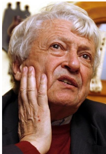
Slika 6. Predrag Matvejević.

Predrag Matvejević bio je hrvatski i bosanskohercegovački pisac i publicist. Rođen je u Mostaru sedmog listopada 1932. godine, a preminuo je u Zagrebu drugog veljače 2017. godine. Bio je hrvatski i talijanski državljanin te član Akademije nauka i umjetnosti BiH od 2002. godine te se nalazi među najviše prevedenim hrvatskim književnicima u svijetu. Njegovo najpoznatije djelo svakako je Mediterranski brevijar koje je u svijetu prevedeno na dvadeset i tri jezika. Za svoga života predavao je francusku književnost na Filozofskom fakultetu u Zagrebu. Kratko je vrijeme živio u Francuskoj gdje je na sveučilištu Sorbonne predavao na Odsjeku za opću i komparativnu književnost dok je od 1994. bio redovni profesor slavistike na Rimskom sveučilištu La Sapienza . U povodu šeststote obljetnice Sveučilišta u Perpignan, dobio je doktorat honoris causa . Jednako tako, počasne doktorate dobio je i na sveučilištima u Trstu, Genovi i rodnom gradu Mostaru. 29