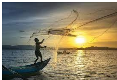
Slika 7. Ribarenje je najvažniji zanat na Mediteranu.

Ribare se prikazuje lica izbrazdanih od kiše i sunca, vjetrom i valovima bez da im ikad pokažu njihove ruke otvrdnule od soli i mreža, konopa i vesala. Pravi ribari psuju, no nisu lopovi. Srde se, ali ne nasrću jedni na druge niti se tuku kao što to ponekad čine lučki radnici i obični seljani. Usprkos međusobnim sporovima, lakše im je dijeliti more nego zemlju. 48