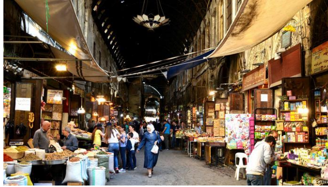
Slika 18. Tržnica u Damasku, Sirija.

Konačno, avionom se odlazi u Egipat na deltu Nila. Narod Kopti, koje spominje Matvejević, imaju egipatske pretke. Egipćani su bili više okrenuti Nilu i delti nego moru. Oni su jedan od najdugovječnijih naroda na Mediteranu, njihova povijest seže u biblijska vremena. Stariji su od Grka i Rimljana, ali su mlađi od naroda Plodnog polumjeseca, to jest Mezopotamije. Njihova je dugovječnost impresivna. Samo još Kina prati takvu dugovječnost i izdržljivost.