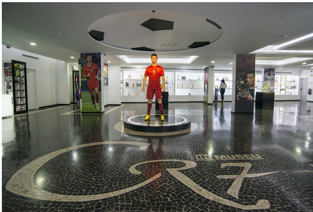
Slika 14. Muzej CR7

nagrade koje je Ronaldo osvojio tijekom dosadašnje karijere, poruke obožavatelja, prikazi najvažnijih uspjeha i golova, te drugi predmeti. 84