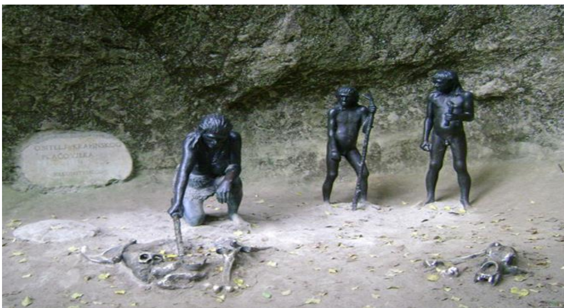
Slika 7: Krapinski pračovjek oko ognjišta

Na Slici 7. prikazan je Krapinski čovjek u špilji, uz ognjište. Na ostacima kostiju Krapinskog čovjeka pronađeni su lomovi i duboke porezotine za koje se smatra da su nastale u lovu na životinje ili od slijeganja zemljišta, ali se smatra i da su posljedica skidanja mesa, mišića i tetiva prije ukopa što je dokaz mogućnosti ljudožderstva (kanibalizma) pripadnika zajednice.