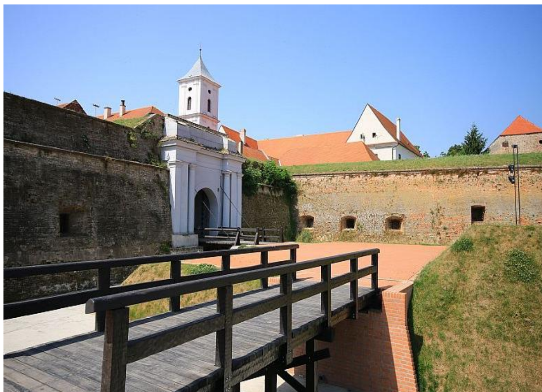
Slika 10.: Tvrđa (Osijek)

„Retfala, Jug II, Donji grad, Gornji grad, Tvrđa, Industrijska četvrt, Novi grad te deset prigradskih naselja: Višnjevac, Podravlje, Josipovac, Sarvaš, Tvrđavica, Nemetin, Klisa, Brijest, Briješće i Tenja.“ 66 Područje Tvrđe, Gornjeg i Donjeg grada su posebno zanimljivi kulturnim turistima jer se na tim područjima nalaze brojne znamenitosti. Za Tvrđu (Slika 10.) se izdvajaju slijedeće znamenitosti: Vodena vrata i gradske zidine, muzej Slavonije i arheološki muzej, koji su smješteni na Trgu Svetog Trojstva, fakulteti, pivnice te druge znamenitosti tog barokonog dijela grada Osijeka. Kulturna vrijednost Tvrđe je velika, što je prepoznao i UNESCO, koji je Tvrđu 2005. godine svrstao u potencijalni upis na popis zaštićene svjetske baštine.