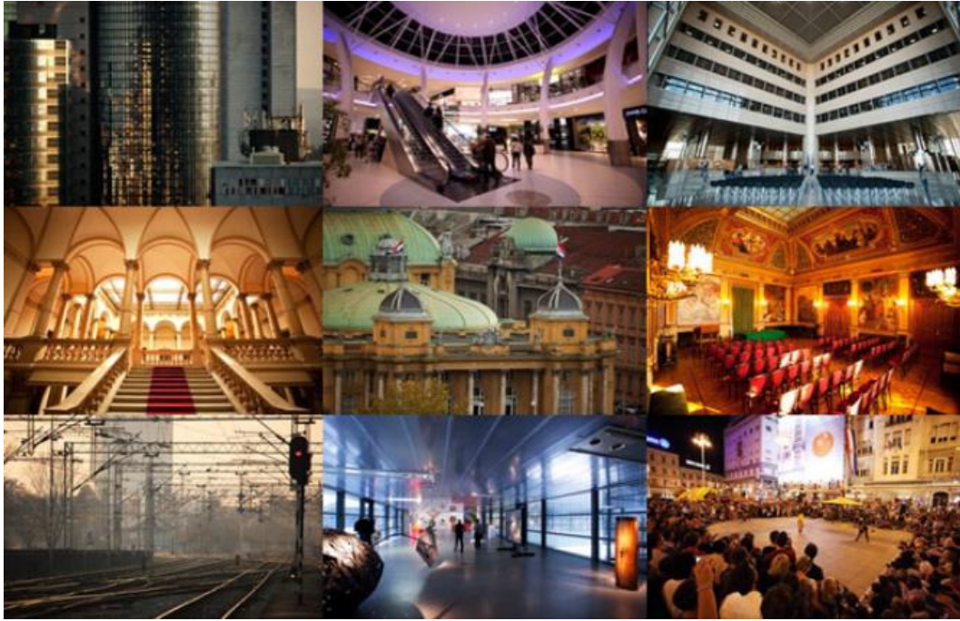
Slika 11.: Zagreb – grad kulturnog turizma