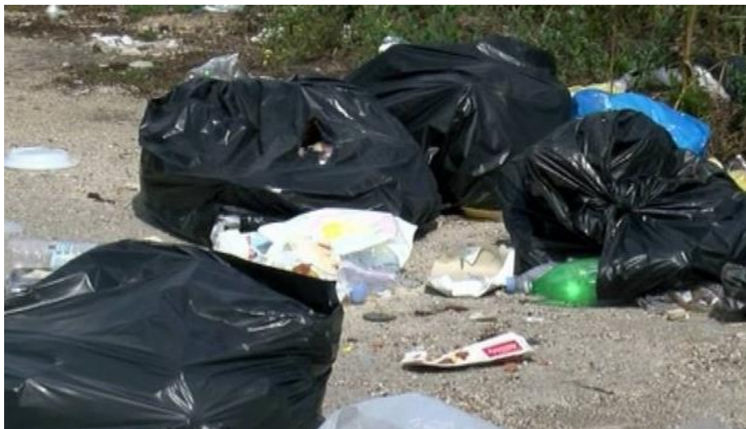
Slika 2.: Zagađenost Plitvičkih jezera

U ekološkom pogledu, sezonalnost se veže uz problematiku naglog nagomilavanja smeća (na kopnu i na moru), na preopterećenost gradskih jezgri turističkim prometom, bukom, negativnim utjecajem na biljni i životinjski svijet, na onečišćenje zraka uslijed povećanog prometa, onečišćenje tla i vode. Sezonalnost u ekološkom pogledu negativno utječe na održivost turizma. Za primjer se može navesti narušavanje ekološke ravnoteže na Plitvicama (Ličko – senjska županija), u vrijeme ljetne sezone, kada turisti za sobom ostavljaju velike količine smeća (Slika 2.), obavljaju nuždu na neprikladnim mjestima, kreću se u nekontroliranom broju na mjestima koja zahtijevaju ograničenost, pa je bilo nužno uvođenje strogih mjera kontrole te uvođenje on line rezerviranja ulaznica (od 2019. godine) barem dva dana prije posjećivanja destinacije Plitvice.