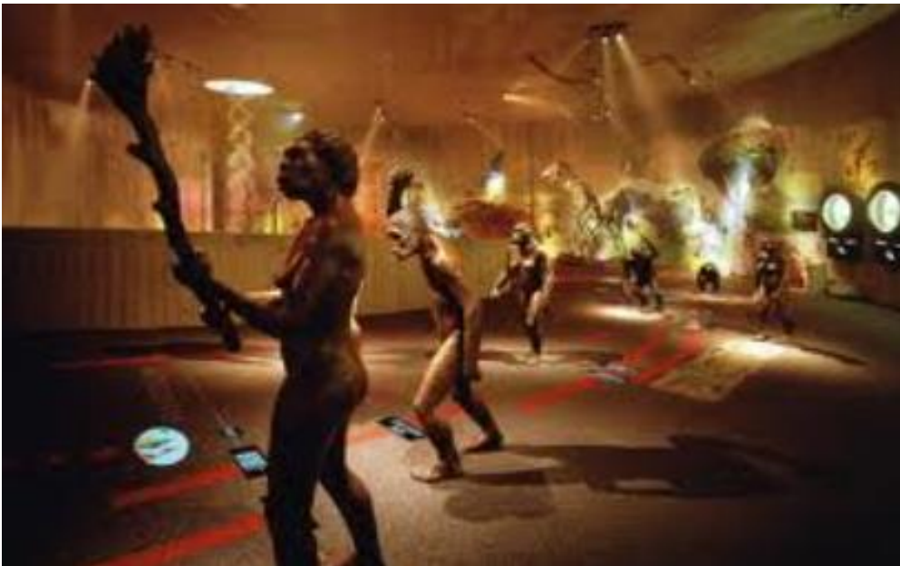
Slika 8: Muzej krapinskih neandertalaca

muzeja svijeta. Bogat najnovijim tehnološkim dostignućima uz brojne vizualne, olfaktivne i ine senzacije, donosi nam fascinantan svijet neandertalaca, ali i baca nas u vrijeme samog početka svijeta pa tako posjetitelji mogu uživati u rekonstrukciji kozmičke evolucije i bar na tren osjetiti svu snagu prapočetka. Jedan od najatraktivnijih detalja - prijelaz preko leda uklopljen je u dijelu Muzeja koji govori o duhovnom svijetu neandertalaca i njihovim navikama. Dok slušate krckanje leda i gledate kako navire voda, kao da u daljini riču mamuti, a vi svjedočite kraju jednog doba...Posebno je zanimljivo tijelo neandertalca na bolesničkom krevetu kojeg mogu "istraživati" čak četvero posjetitelja istodobno i na tri jezika doći o informacijama o njegovim ozljedama uz ilustrirane fotografije i rendgenske snimke. 57 Na Slici 8. prikazan je Krapinski čovjek u muzeju krapinskih neandertalaca u Krapini te se jasno mogu vidjeti prethodno opisani detalji izgleda muzeja.