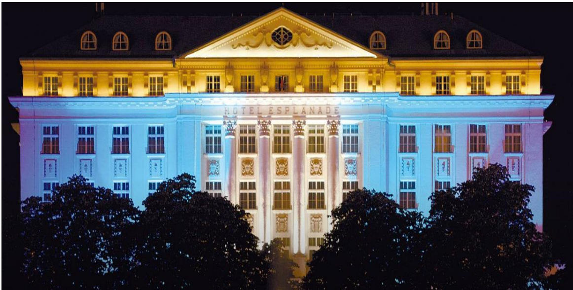
Slika 1.: Hotel Esplanade

rekonstrukcije i kreiraju kompletnije hotelske proizvode (zdravu hranu i piće, boravak u prirodi, zabavu za djecu i odrasle, animacijske programe, sportske sadržaje te dr.). Jedan od hotela kontinentalne Hrvatske, koji je izvršio rekonstrukciju je hotel Esplanade (Slika 1.) koji je smješten u Zagrebu, te posluje od 1925. godine. Jedan je od najluksuznijih i najelegantnijih hotela, koji je poznat po visokokvalitetnim uslugama i besprijeckornom hotelijerskom standardu.