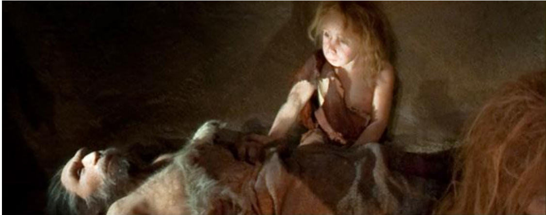
Slika 9.: Skulptura neandertalca u bolesničkom krevetu

U muzeju je posebno zanimljiva skulptura neandertalca u bolesničkom krevetu, što je prikazano na Slici 9. Slika je dokaz postojanja pračovjekove suosjećajnosti koja nije karakteristična za životinje.