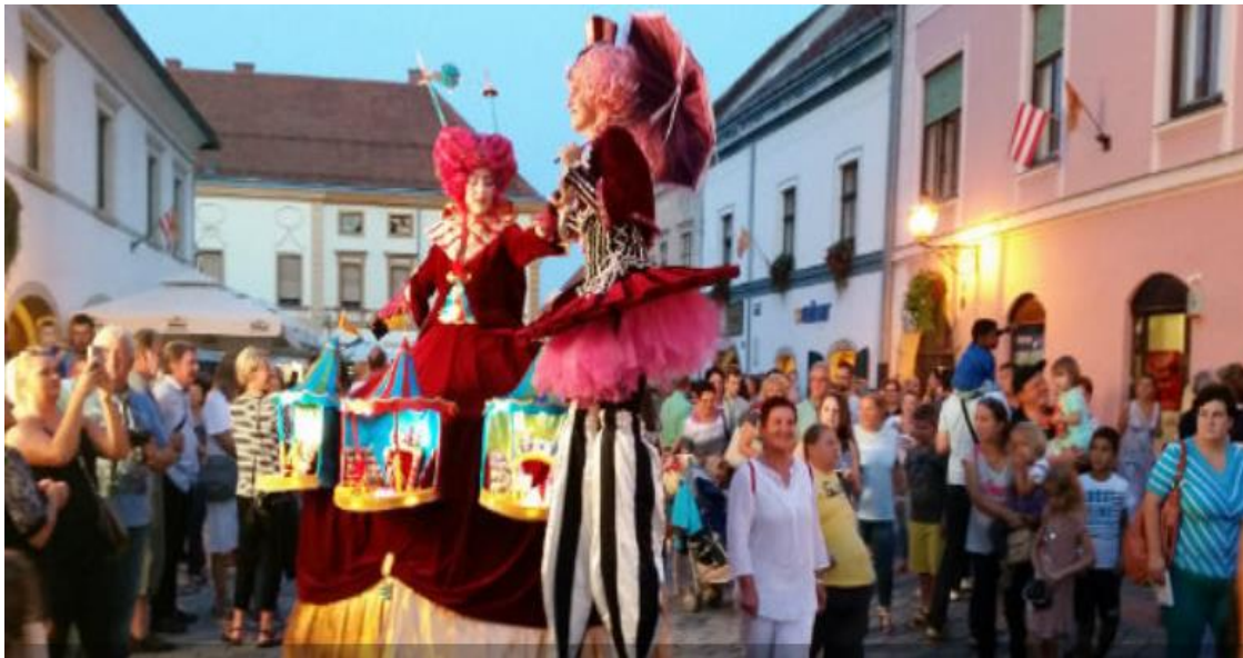
Slika 6.: Špancirfest (Varaždin)

godinama tradicionalno vežu uz taj prostor – Vinkovačke jeseni, Špancirfest u Varaždinu (Slika 6.), Porcijunkulovo u Čakovcu, Ljeto u dvorcu Oršić, Tabor Film festival, Osječko ljeto kulture, Zagrebačko kulturno ljeto, vrbovečki Kaj su jeli naši stari, karlovački Dani piva i sl. 54 Za primjer kulturnog turizma kontinentalne Hrvatske može se navesti održavanje Špancirfesta. Špancirfest je festival kojeg svake godine organizira turistička zajednica grada Varaždina.