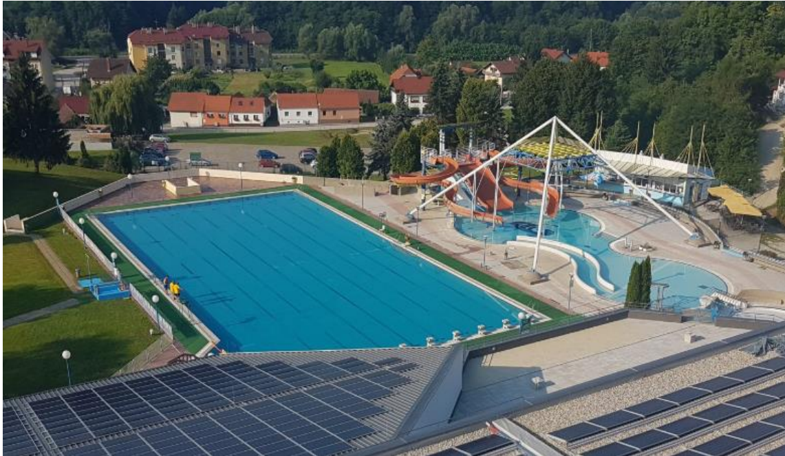
Slika 5.: Varaždinske toplice

Hrvatske. Rehabilitacijski centar Varaždinske toplice u ponudi ima medicinske procedure, fizikalne postupke, laboratorijske pretrage i termalne bazene, u kojima se izvodi hidromasaža, masaža putem vodenih slapova i opuštanje u termalnoj vodi.