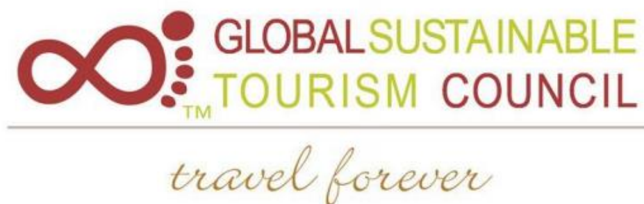
Slika 4. Globalno vijeće za održivi turizam