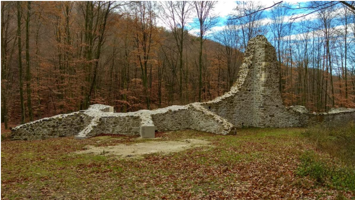
Slika 9. Pavlinski samostan blažene Djevice Marije

Pronašao je komad kamenog zida ukrašen značajnim ornamentima i zmajem kada je obilazio Samostan. Danas je taj komad kamenog zida pohranjen u Muzeju Moslavine. Do dana današnjeg, nisu provedena značajna arheološka istraživanja te Bela crkva i dalje krije mnoge tajne (Kovačević, 1991-1992, str. 57-64).