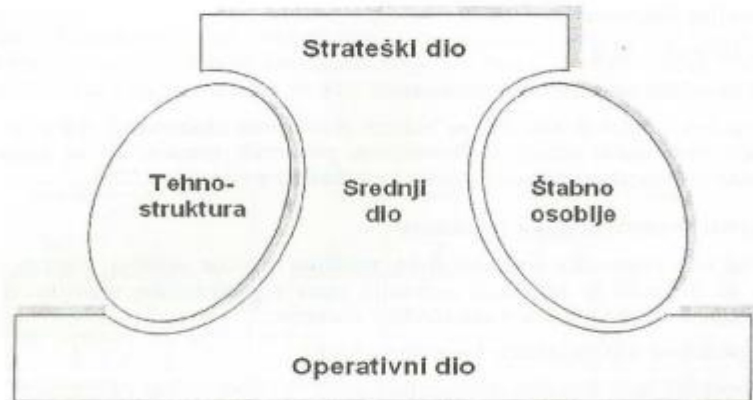
Slika 1. Organizacijska struktura poduzeća prema H. Mintzbergu