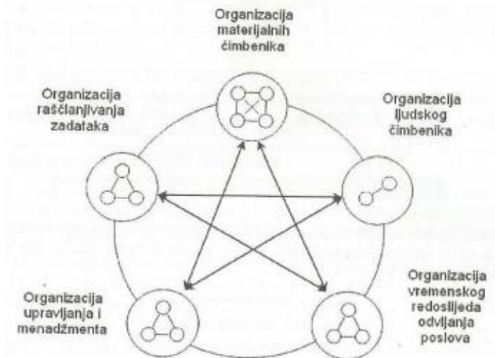
Slika 2. Veze i odnosi između i unutar elemenata organizacijske strukture