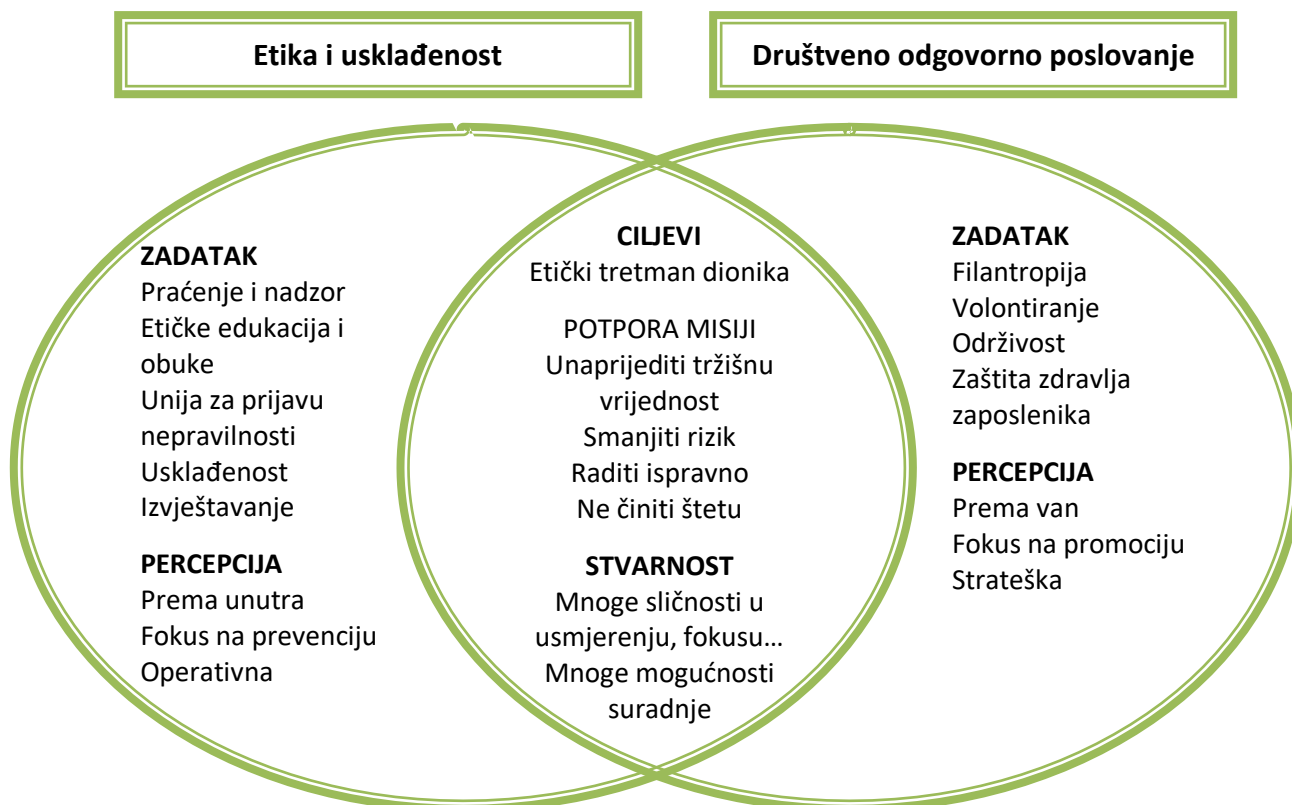
Slika 3.: Razlike i preklapanja programa etike i usklađenosti te društveno odgovornog poslovanja

Izgradnja organizacijske kulture kroz programe etike i usklađenosti svojom implementacijom rezultira društveno odgovornim poslovanjem koje potiče poduzeća na odgovornost prema svim dionicima i društvenom dobru. Poduzeće ima dužnost ponašati se društveno odgovorno jer time pozitivno utječe na sve dionike i smanjuje svoje potencijalno negativne učinke koje može imati na društvo. U daljnjem tekstu je prikazana slika 3, koja pokazuje razliku programa poslovne etike i društveno odgovornog poslovanja.