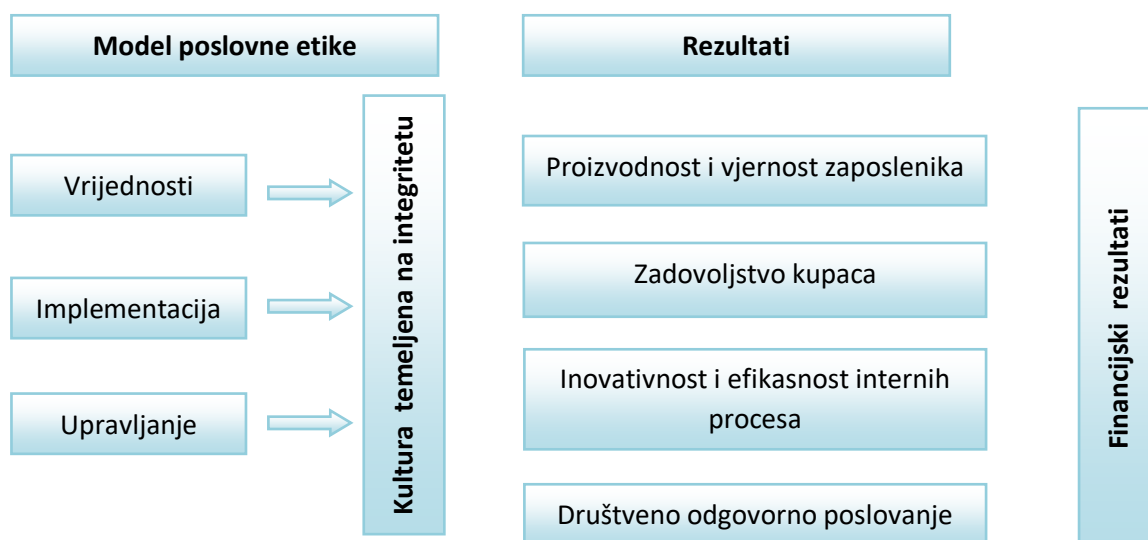
Slika 2.: Direktni i indirektni utjecaj poslovne etike na uspješnost poslovanja

Izvor: Vig S., Poslovna etika; Kako razviti autentično vodstvo i izgraditi kulturu zadovoljnih i angažiranih zaposlenika programima etike i usklađenosti?, CODUPO, Zagreb, 2019., str. 66