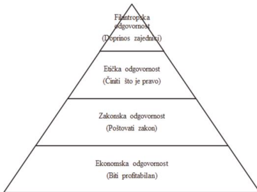
Slika 1.: Carollova piramida (hijerarhija dimenzija društvene odgovornosti)