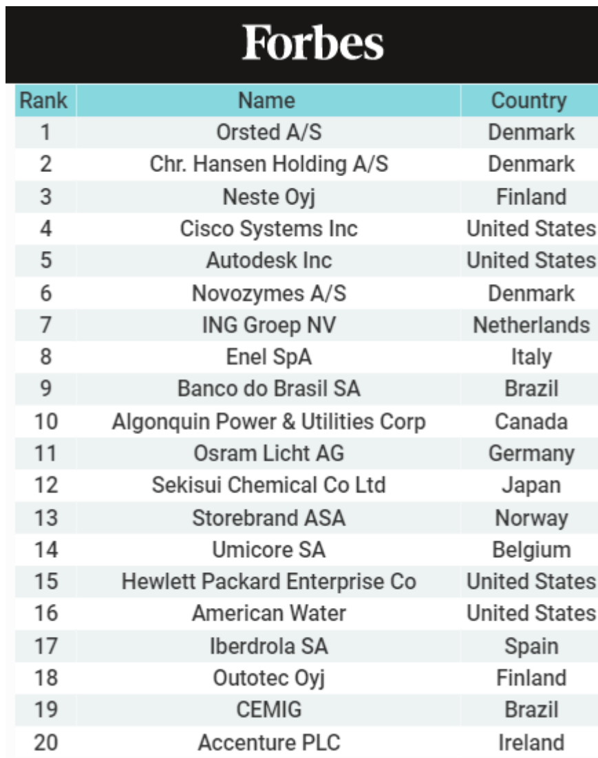
Slika 5.: 20 najodrživijih tvrtki u 2020. Godini.