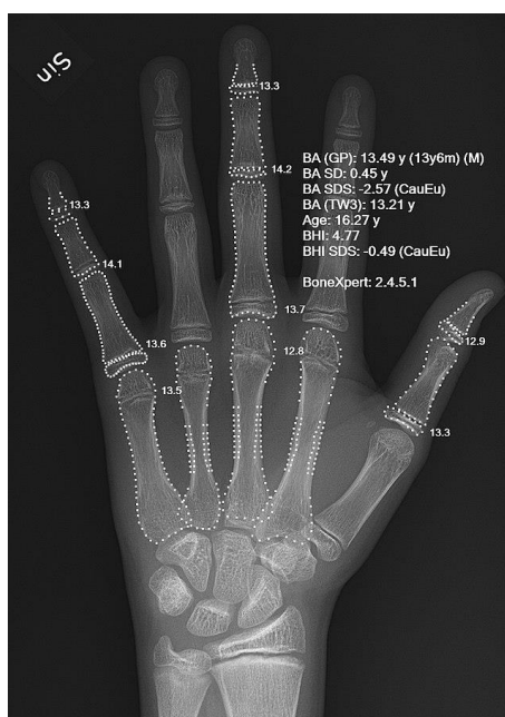
Slika 2: X-zraka ruke s automatskim izračunavanjem koštane dobi