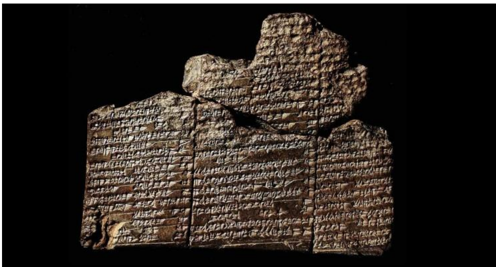
Slika 1: Ep o Gilgamešu