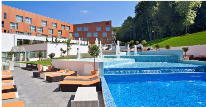
Slika 8: Hotel Spa Golfer; izvor: www.termesvetimartin.com

Spa Golfer najveći je hotel na području Međimurske županije. Kategoriziran je s četiri zvjezdice. Ponuda obuhvaća 151 sobu i 6 apartmana koji su vrhunski opremljeni. Okruženje hotela, osim bazenskih kompleksa i golf terena, čine stoljetne prekrasne šume i vinska cesta. Gosti imaju na raspolaganju vrhunsku wellness i spa ponudu te raznoliku gastronomsku ponudu kroz ukupno 5 restorana u kompleksu. Tu su još i barovi, pizzerija, fast food, pub, noćni bar, dućani, šetnice, staze, razne vrste sportova i naravno vrhunski golf tereni.