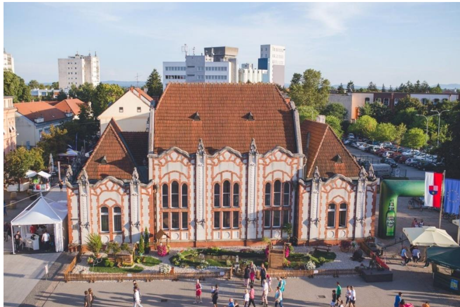
Slika 4: zgrada trgovačkog kasina

Od ostalih povijesnih građevinskih zdanja prepoznatljiva je zgrada trgovačkog kasina u samom centru Čakovca. Izgrađena je 1903. godine u stilu mađarske secesije. U novije vrijeme pa sve do danas zgrada je poznata kao sjedište sindikata.