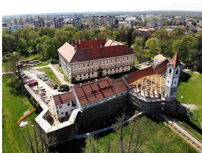
Slika 3: Stari grad Čakovec u revitalizaciji 2020.

Najpoznatiji dvorac u Međimurju je onaj u središtu grada Čakovca. Na ovom mjestu prvi se put drvena utvrda podiže u 13. stoljeću, potom se dograđuje da bi vrhunac bio dosegnut za vrijeme obitelji Zrinski koja živi u dvorcu za vrijeme 16. stoljeća. U 18. stoljeću dvorac biva razrušen tijekom u potresu, no češki grofovi Althan obnovili su zdanje u baroknom stilu u kakvom je dvorac i danas. Unutar zdanja se danas smjestio Muzej Međimurja Čakovec. Okružen je Perivojem Zrinski i dvorac je turistički najposjećeniji objekt u Međimurskoj županiji.