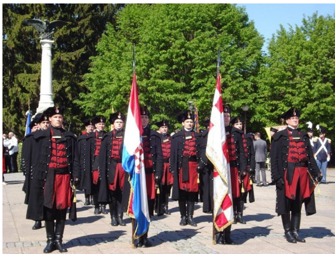
Slika 5: Zrinska garda

Zrinska garda smatra se jednim od čuvara kulturne baštine Međimurja. Osnovana je 2001. godine s ciljem očuvanja tradicije i baštine obitelji Zrinski. Želja je Zrinske garde, kao i samog grada Čakovca, afirmirati grad kao grad Zrinskih. U udruzi djeluje povijesna postrojba s gardistima, topnikom i bubnjarskim orkestrom. Zrinska garda, osim što čuva grad, promovira lokalnu baštinu i tradiciju u Europi i Svijetu. „Članom Udruge može postati svaki punoljetni pošten i moralni hrvatski državljanin, a pripadnikom njezine povijesne postrojbe muška osoba starosti od 18 do 35 godina, koja želi svjedočiti junaštvo i viteštvo vojskovođa Zrinskih.“ 30 Garda također ima svoju službenu odoru koja je zaštićena temeljem rješenja Državnog zavoda za intelektualno vlasništvo.