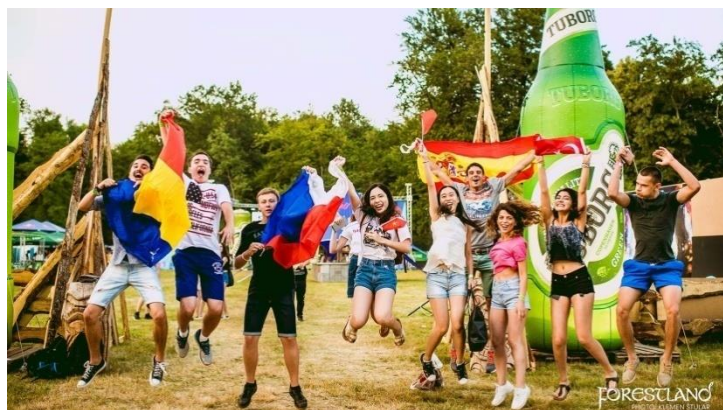
Slika 10: Forestland

Održava se svake godine u srpnju i traje 48 sati. Priča o Forestlandu, festivalu elektroničke glazbe, posebno je zanimljiva priča sa sjevera Hrvatske. Festival je nastao tek 2013. godine i u kratkom