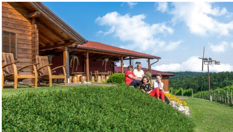
Slika 6: Vinska kuća obitelji Hažić

proizvode nude i u Life Class Termama Sveti Martin, a nedavno su otvorili i „Međimurski štacun“ gdje prodaju međimurske proizvode. 33