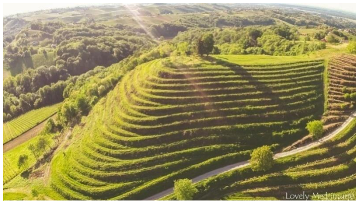
Slika 2: Mađerkin breg; izvor: www.lovelymedjimurje.com

Mađerkin breg zanimljiv je turistički lokalitet privlačan mnogim posjetiteljima. Nalazi se na 341 metar nadmorske visine u malom mjestu Robadje u gornjem Međimurju. Za vrijeme vedrog vremena pogled sa ove lokacije