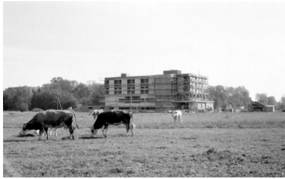
Slika 1: Izgradnja hotela Park

Skupština tadašnje Općine Čakovec donijela je u siječnju 1966. godine odluku o izgradnji motela s 63 ležaja u Čakovcu. Projekt je krenuo u izgradnju te je u vrijeme izgradnje predstavljao najveću investiciju u hotelijerstvo na području Međimurja. Izgradnja se smatrala isplativom zbog velikog broja lovaca koji su tih godina već uvelike dolazili u Međimurje, a nisu imali adekvatan objekt za smještaj. Objekt je završen već do kraja godine i svečano otvoren za priredbu dočeka Nove godine 31. prosinca 1966. godine.