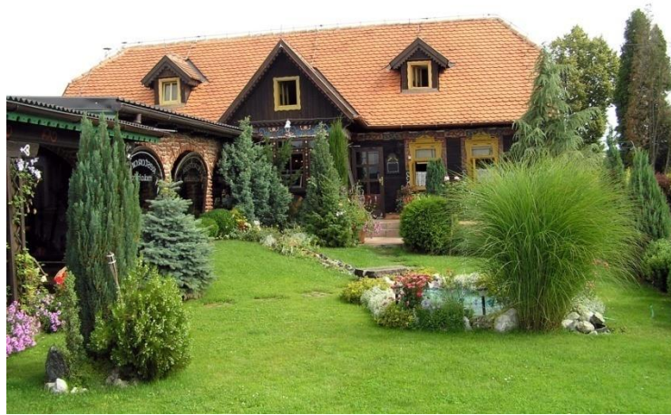
Slika 7: Restoran Mala hiža

Restoran Mala hiža nalazi se u Mačkovcu kraj Čakovca i slovi za jedan od najpoznatijih i najboljih restorana kontinentalne Hrvatske. Da to nije tek legenda, nego i istina govore brojne nagrade koje je ovaj restoran kroz godine rada prikupio. Restoran je usmjeren na ponudu domaće, tradicionalne hrane, ali se tu ne ograničavaju, već oplemenjuju tradicionalnu kuhinju modernom.