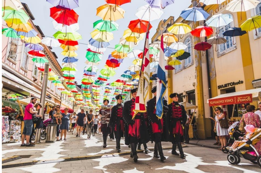
Slika 9: Porcijunkulovo; izvor: www.porcijunkulovo.com

pogledu pa je tako uz crkveno obilježavanje nastao Sajam tradicijskih zanata. Održavalo se godinama kao tradicionalno međimursko proštenje koje ovdje ima gotovo svako mjesto. Danas je Porcijunkulovo izraslo u fantastičan spoj tradicionalnog i modernog. Koncerti različitih vrsta glazbe, kušaonice i štandovi s vinima, prodaja