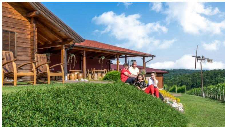
Slika 6: Vinska kuća obitelji Hažić

proizvode nude i u Life Class Termama Sveti Martin, a nedavno su otvorili i „Međimurski štacun“ gdje prodaju međimurske proizvode. 33