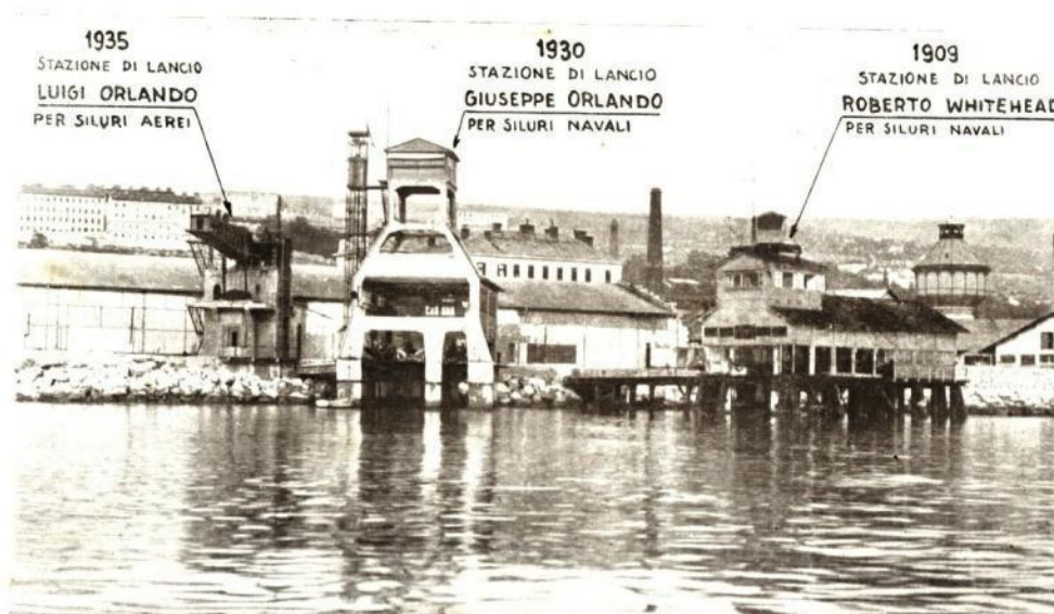
Slika 6 Pogled na građevinu lansirne rampe za ispitivanje torpeda u Rijeci