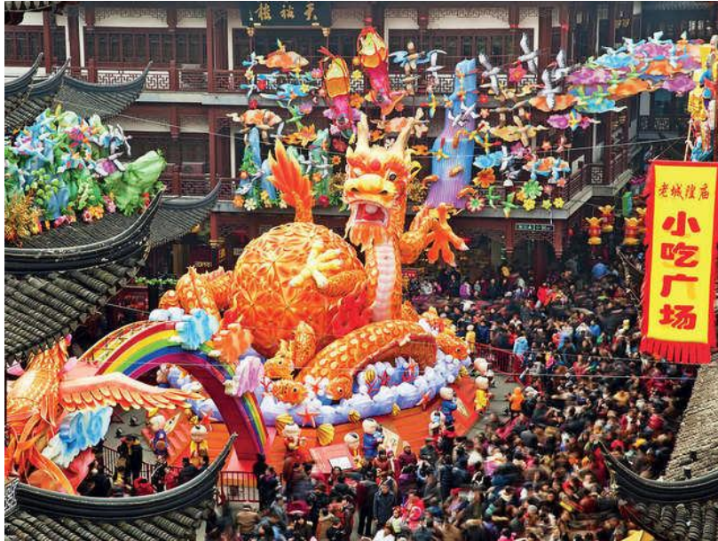
Slika 3. Festival proslave Kineske Nove godine u Kini