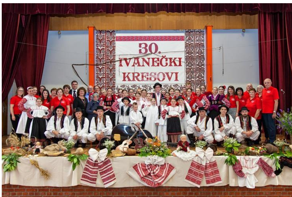
Slika 19. Članovi 30. Ivanečkih kresova iz 2018.g.

U programu koji se održava u društvenom domu u Koprivničkom Ivancu nakon pozdravnih govora prvi nastupaju domaćini izvedbom pjesama i plesova Koprivničkog Ivanca i Podravine u nastupima tamburaške te dječje i odrasle folklorne skupine. Zatim se predstavljaju gostujuća društva. Nakon folklornog programa, slijedi večera za folklorashe i uzvanike, a potom druženje svih prisutnih uz veselu glazbu (slika 19).