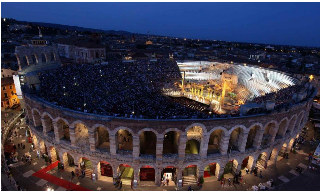
Slika 5. Arena u Veroni (izvedba opernog događaja)

Svjetski primjer aktualizacije rimske arheološke i kulturne baštine je ljetni festival u veronskoj areni Arena Verona Festival. Idealna kao pozornica za operna, baletna i koncertna događanja, arena u Veroni već desetljećima priređuje vrhunske umjetničke produkcije, prije svega opernih predstava (slika 5). Izvođači koji ondje nastupaju sinonim su izvrsnosti, režija i kostimografija iznimno su atraktivni i prilagođeni ambijentu, a cijeli grad tijekom dva ljetna mjeseca živi za i uz festival (Carić, Knešaurek, 2018., str. 67).