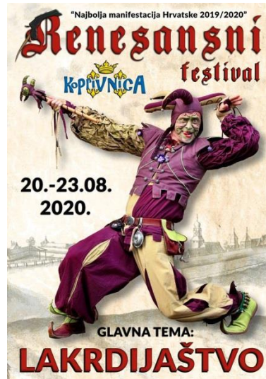
Slika 13. Plakat Renesansnog festivala za 2020.g.