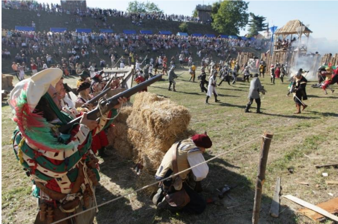
Slika 12. Scenski prikaz Renesansnog festivala