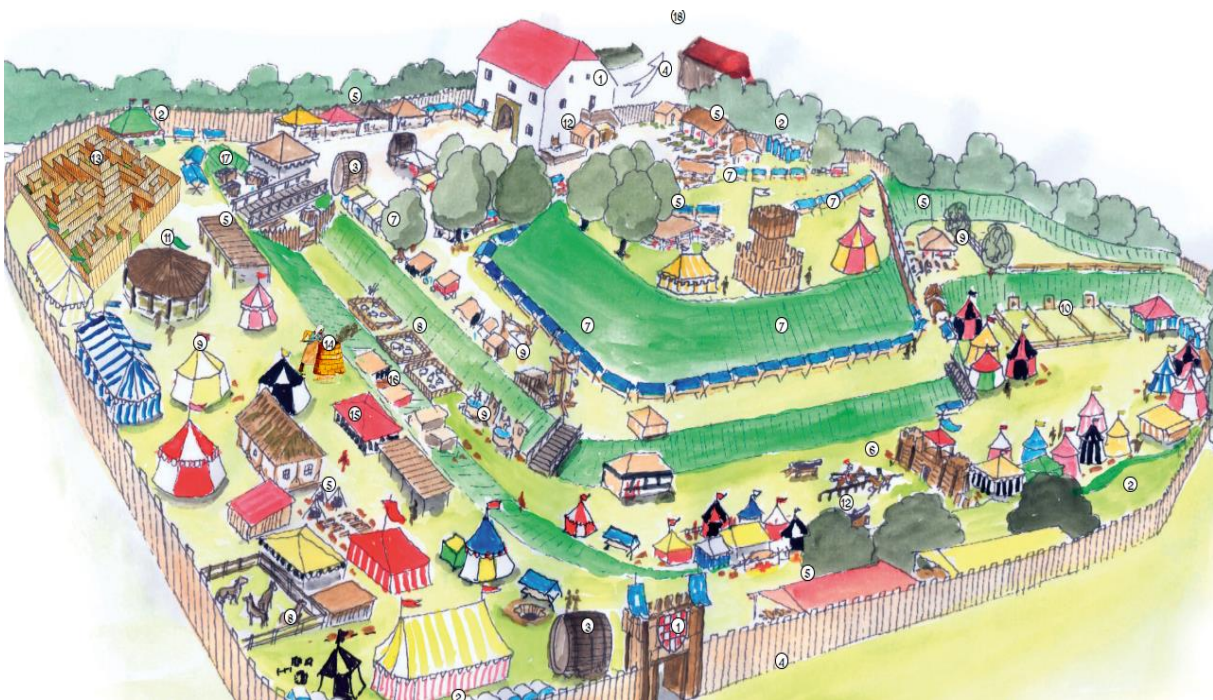
Slika 14. Aplikacija „Renesansni festival“