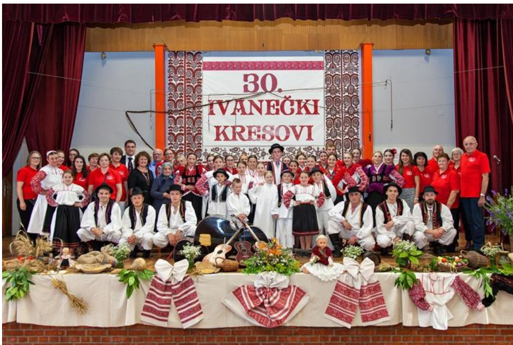
Slika 19. Članovi 30. Ivanečkih kresova iz 2018.g.

U programu koji se održava u društvenom domu u Koprivničkom Ivancu nakon pozdravnih govora prvi nastupaju domaćini izvedbom pjesama i plesova Koprivničkog Ivanca i Podravine u nastupima tamburaške te dječje i odrasle folklorne skupine. Zatim se predstavljaju gostujuća društva. Nakon folklornog programa, slijedi večera za folklorashe i uzvanike, a potom druženje svih prisutnih uz veselu glazbu (slika 19).