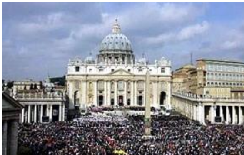
Slika 1. Mega događaj – posljednji ispraćaj Ivana Pavla II.

Mega događaji su manifestacije koje okupljaju više od pola milijuna posjetitelja, bez obzira na razlog okupljanja. U pravilu, takve manifestacije posjetitelji rijetko posjećuju zbog turističkih razloga, ali njihovi su učinci, barem u jednom njihovom dijelu, posve sigurno turistički. Primjer mega događaja o kojem se pričalo i godinama nakon njega je ukop pape Ivana Pavla II. 2005. godine. U Rim je stiglo oko 3 milijuna posjetitelja na dan posljednjeg ispraćaja Pape, a više od 5 milijuna ljudi prošlo je pokraj njegova odra u 4 dana nakon njegove smrti (slika 1.). Mnogi su taj golemi skup vjernika i znatiželjnika proglasili najvećim do sada viđenim skupom. Putem televizora diljem svijeta pratio se izravan prijenos ukopa. (Vukonić, 2010.,str. 185)