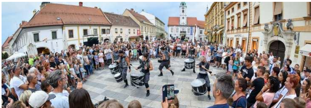
Slika 4. Špancirfest u Varaždinu

Događaji manjeg opsega promoviraju lokalne običaje na način razumljiv i zanimljiv svakom posjetitelju te na taj način žele postati važni nositelji turističkog potencijala svoga kraja. Primjer takvih festivala su Picokijada, Renesansni festival, Ivanečki kresovi i drugi koji su detaljnije opisani pod naslovom Primjer kulturnih događaja u Podravini . Osim lokalnih događaja u Podravini primjer takvog događaja je već poznati kulturni festival pod nazivom Špancirfest koji se održava u Varaždinu (slika 4).