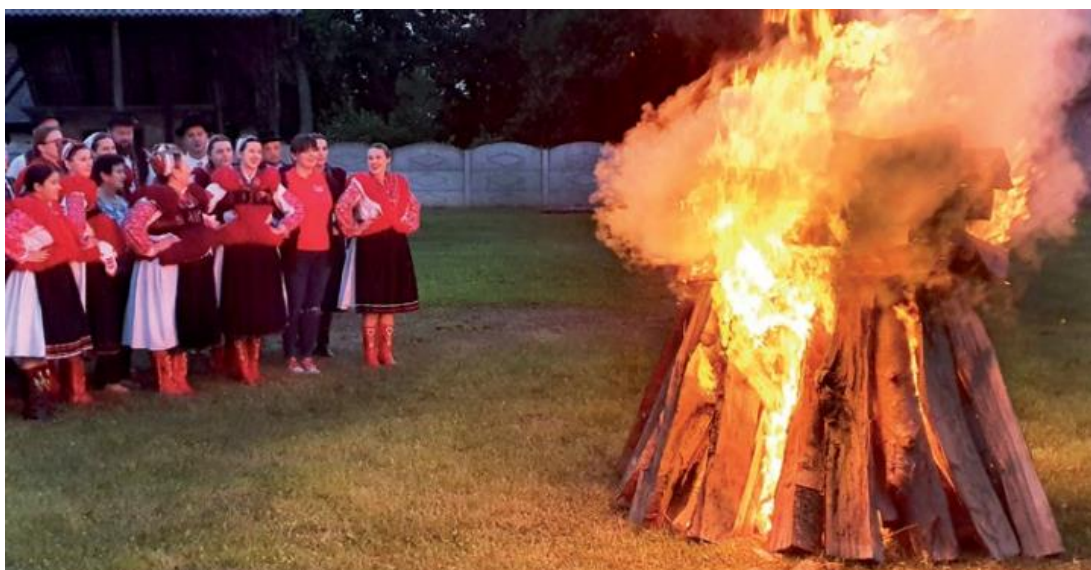
Slika 20. Tradicionalno paljenje krijesa u Koprivničkom Ivancu 2019.g.

Od prve do trinaeste priredbe, kada je obilježena 60. godišnjica Društva, Ivanečki kresovi bili su dvodnevna manifestacija. Posljednjih godina program Kresova započinje ispred društvenog doma mimohodom sudionika svih društava ulicama Koprivničkog Ivanca. Ovu manifestaciju redovno prati prikaz izrade izvornog veza s narodne nošnje Koprivničkog Ivanca, izložba radova s ivanečkim vezom, izložba starina, prikaz običaja paljenja krijesa i slično (slika 20). Do sada je održano 138 gostujućih nastupa s oko 4000 sudionika iz Hrvatske, Slovenije, Srbije, Makedonije, Bosne i Hercegovine te Austrije, Mađarske i Grčke, što Kresove svrstava među značajne manifestacije usmjerene njegovanju vlastite i upoznavanju tradicijske kulture drugih krajeva Hrvatske i inozemstva (Podravski zbornik, 2019., str. 189).