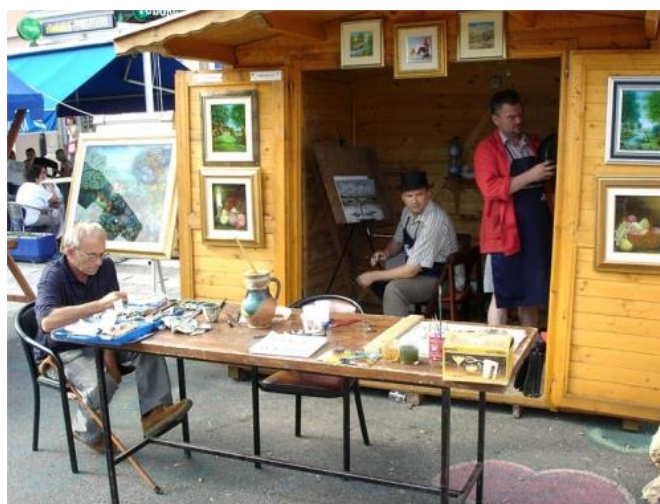
Slika 15. Prikaz slikara na Podravskim motivima

1995. godine rodila se ideja da se na otvorenom koprivničkom Zrinskom trgu pokaže naivno slikarstvo i kiparstvo, koje je bilo poznato i priznato daleko van naših granica i po čitavom svijetu, pod imenom „Podravski motivi” (slika 15). Danas je sajam proširen na gradski park s mnogo više sadržaja nego prije. Na otvaranju sajma već po običaju gradonačelnik Koprivnice predaje ključ grada najstarijem umjetniku da kao novi gradonačelnik upravlja i vodi brigu o Podravskim motivima tri dana koliko i traju. Uz slike i kipove naivnih slikara, predstavljena su zanimanja poput kovača, krojača, bravara, postolara, tkalaca, stolara, mlinara, tesara te mnogih drugih zanata koje je vrijeme pregazilo (Podravski zbornik, 2009., str. 167).