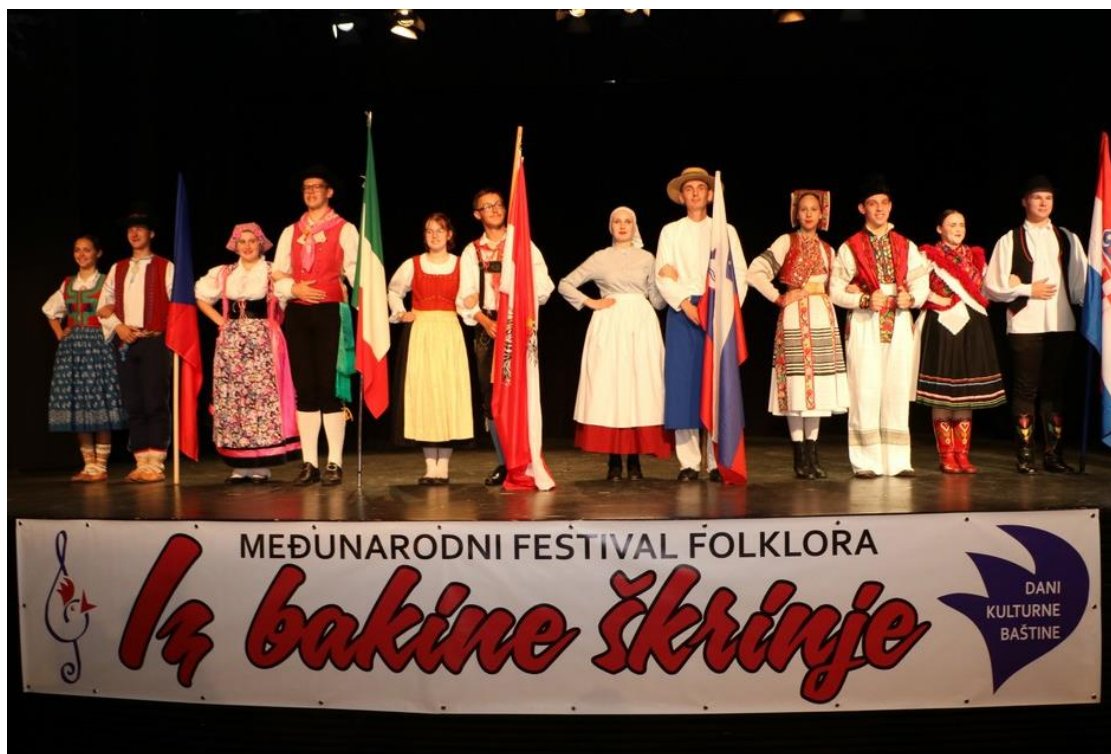
Slika 18. Međunarodni folklorni festival „Iz bakine škrinje“

Festival se održava svake godine u srpnju i traje tri dana. 2019. godine održao se 13. Međunarodni folklorni festival „Iz bakine škrinje“ u Koprivnici čime je grad postao turistički kulturni centar, s obzirom da je to jedini međunarodni folklorni festival u ovoj regiji (slika 18). Osim domaćih sudionika sudjelovali su i gosti iz drugih država; od sveukupno 240 sudionika, čak 170 došlo je iz inozemstva ( www.kckzz.hr ).