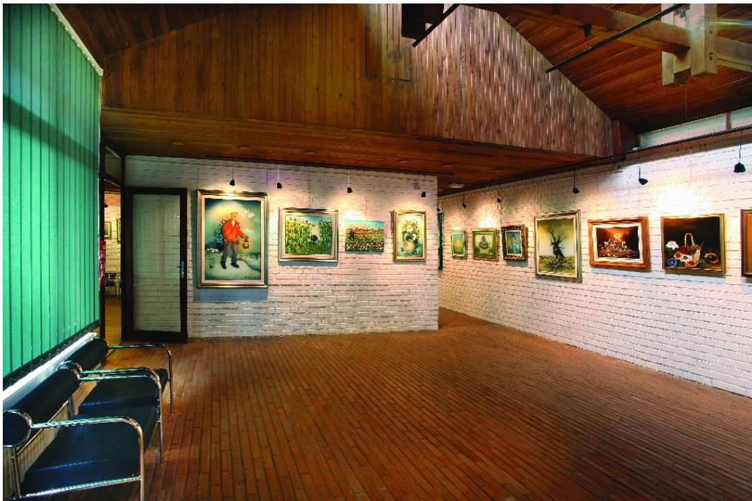
Slika 7. Galerija naivne umjetnosti u Hlebinama

Galerija Hlebina nalazi se u središtu sela preko puta općine i trgovine, a uz nju u Hlebinama aktivno djeluje Gospodarstvo Josipa Generalića koje se sastoji od stare kuće Ivana Generalića – muzejske memorijalne kuće za javnost otvorene 1992.g., Galerije i ateljea Josipa Generalića i etno kuće „Janičina hiža“ ( www.muzej-koprivnica.hr ).