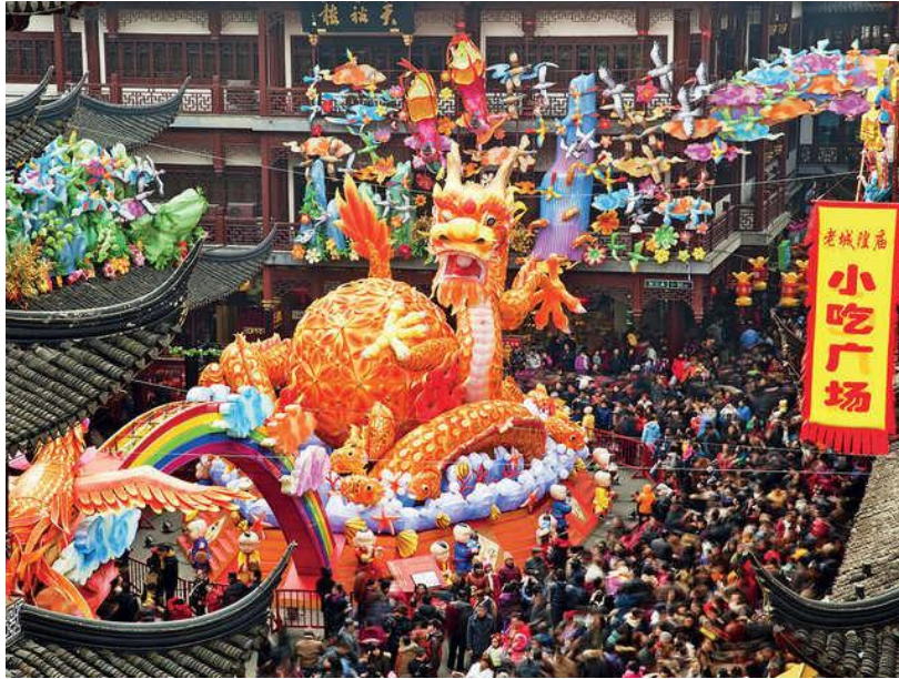
Slika 3. Festival proslave Kineske Nove godine u Kini