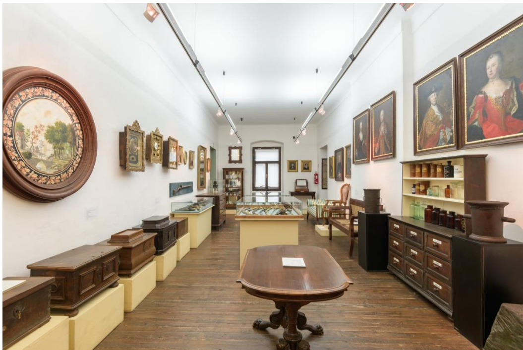
Slika 6. Unutrašnjost Muzeja grada Koprivnice

Navedeni su samo neki kulturno-povijesni spomenici, no zapravo je cijela stara gradska jezgra jedinstvena spomenička cjelina vrijedna turističkih posjeta (slika 6).