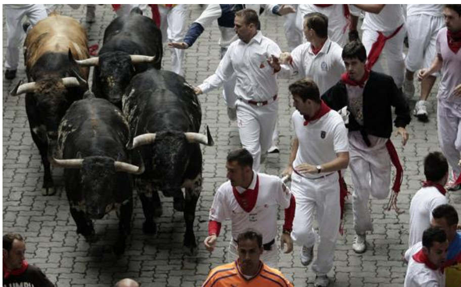
Slika 2. Prikaz utrke s bikovima u Španjolskoj