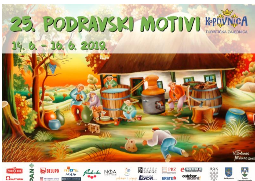
Slika 16. Plakat održavanja 25. Podravskih motiva

2019. godine obilježeni su 25. Podravski motivi koji su bili upotpunjeni mnogim novim atraktivnim sadržajima i zabavom za sve uzraste. Svake godine sajam nadopunjuje svoj program novim zanatima i izvođačima, a „Podravka“ svake godine priređuje poseban kulinarski show za poznate kuhare, ali i za kuhare amatere koji žele pokazati svoje vještine.