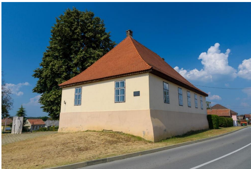
Slika 8. Zavičajni muzej u Kalinovcu

Zavičajni muzej nekad je bio i škola za djecu, dok je danas jedna od najznačajnijih vrijednosti za staro i mlado stanovništvo tog mjesta te se svake godine u njemu održavaju razne izložbe starih predmeta i slika (slika 8).