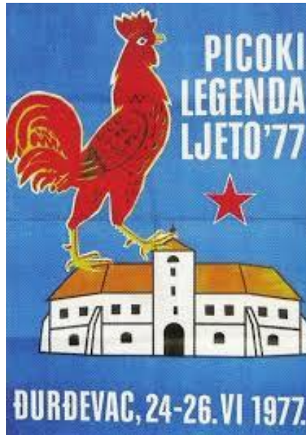
Slika 9. Plakat iz prve Picokijade iz 1977.g.

Što se programskog dijela tiče, okosnicu manifestacije do današnjih dana, osim scenskog prikaza, čine sljedeće priredbe: povorka aranžiranih kola (prikaz narodnih običaja i tradicijske kulture), izložba kolača, likovna izložba, sportska takmičenja, kazališna predstava, nastupi folkloriša i koncerti (pjevači, grupe, zborovi).