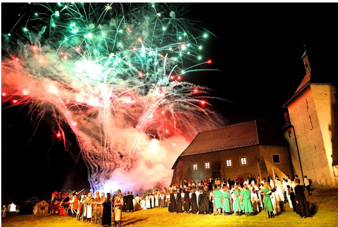
Slika 10. Scenski prikaz Picokijade

Legenda se od nastanka dopunjavala i scenski usavršavala, što je najvećim dijelom ovisilo o inovacijama redatelja i materijalnim mogućnostima organizatora. U izvođenju legende sudjeluje 300-400 glumaca i statista, uz tehničko osoblje, konjanike i zapregu, a svake godine oduševi više od 10 000 posjetitelja. S vremenom se Legenda obogaćivala tonskim, svjetlosnim i pirotehničkim efektima prema zamisli redatelja. Za izvođače se iznajmljuju posebni kostimi iz kazališnih kuća, a izrađuju se i vlastiti, kao i potrebni rekviziti i kulise. Legenda o Picokima bila je inspiracija mnogim piscima, glazbenicima i likovnim umjetnicima (slika 10).