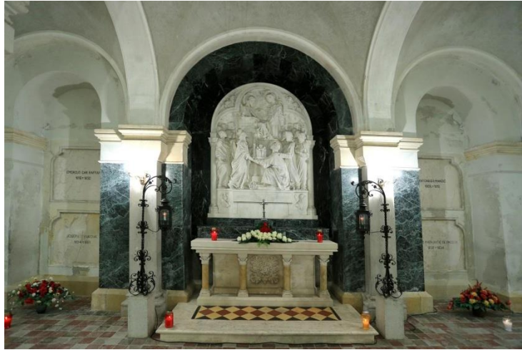
Slika 9 Oltar u kripti đakovačke katedrale