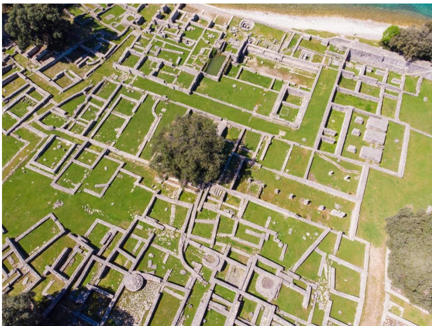
Slika 3. Nalazište na Brijunima