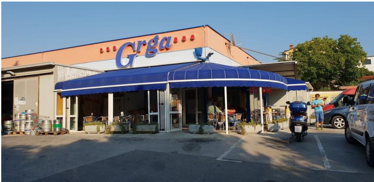
Slika 4. Market „Grga t.p.“