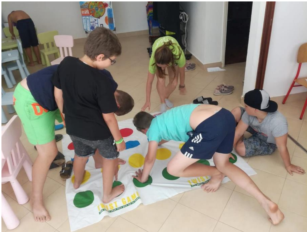
Fotografija 2: Djeca u Mini klubu igraju Twister

kolaž papira), crtanje(također u večernjem programu može se organizirati izložba,gdje se pozivaju roditelji, od svih radova), pjevanje(svaki dan u mini klubu se ponavljaju dječije pjesme, za koje postoji koreografija, za mini disko), twister, društvene igre.