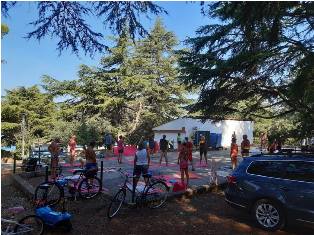
Fotografija 4: Jutarnja gimnastika

Prve sportske aktivnosti koje uobičajeno započinju od 9 sati ujutro jesu jutarnja gimnastika, joga, breath & care, body relax, pilates i slično. Zajednička karakteristika svih ovih aktivnosti je lagano i opušteno vježbanja. Cilj jutarnjih vježbi je buđenje tijela ujutro(s vremenom tijelo se navikne na jutarnje tjelovježbe te se ljudi osjećaju mnogo bolje, kada jutro započne zdravo i produktivno), postizanje dobro raspoloženja koje će trajati tokom cijelog dana, poboljšanju tjelesne aktivnosti. Za vrijeme aktivnosti puštaju se relaksirajuće pjesme koje pomažu kod opuštanja i postižu zadovoljstvo turista i nakon treninga.