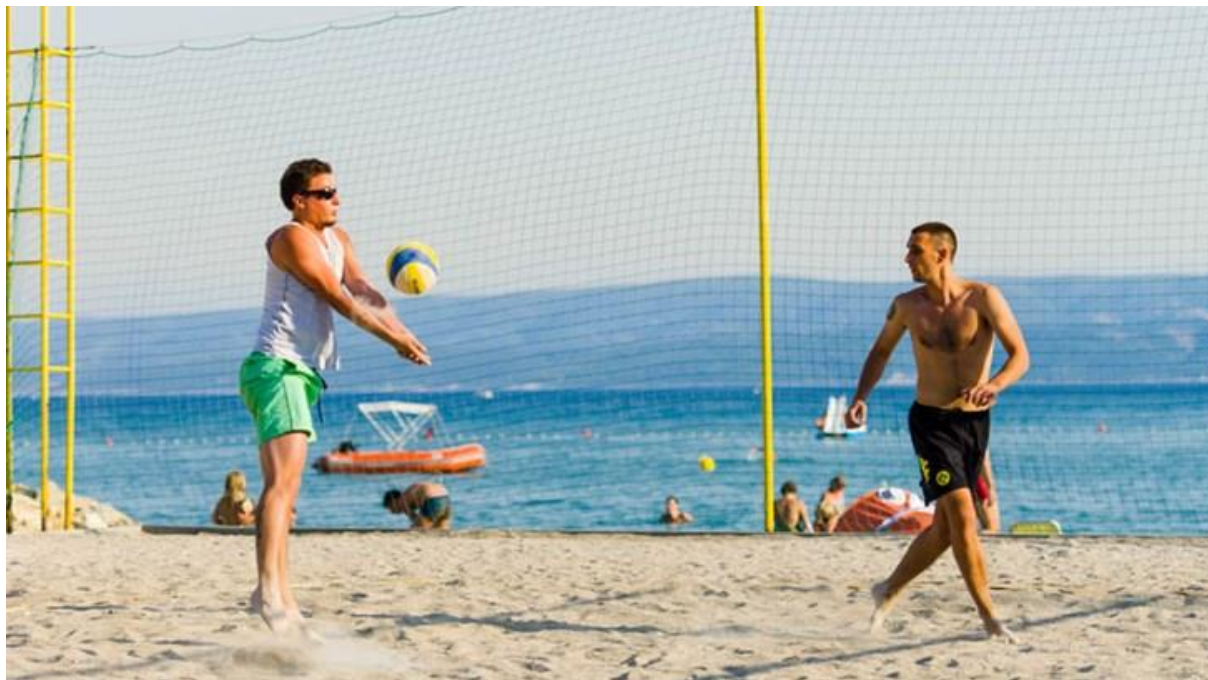
Fotografija 7: Odbojka na pijesku

Odbojka se igra u par grupa, svaka grupa ima po 5 članova. 17 Na kraju grupa koja pobijedi za nagradu im se uručuje simbolična nagrada(nagrade su najčešće kape, naočale i slično sa logom kampa).