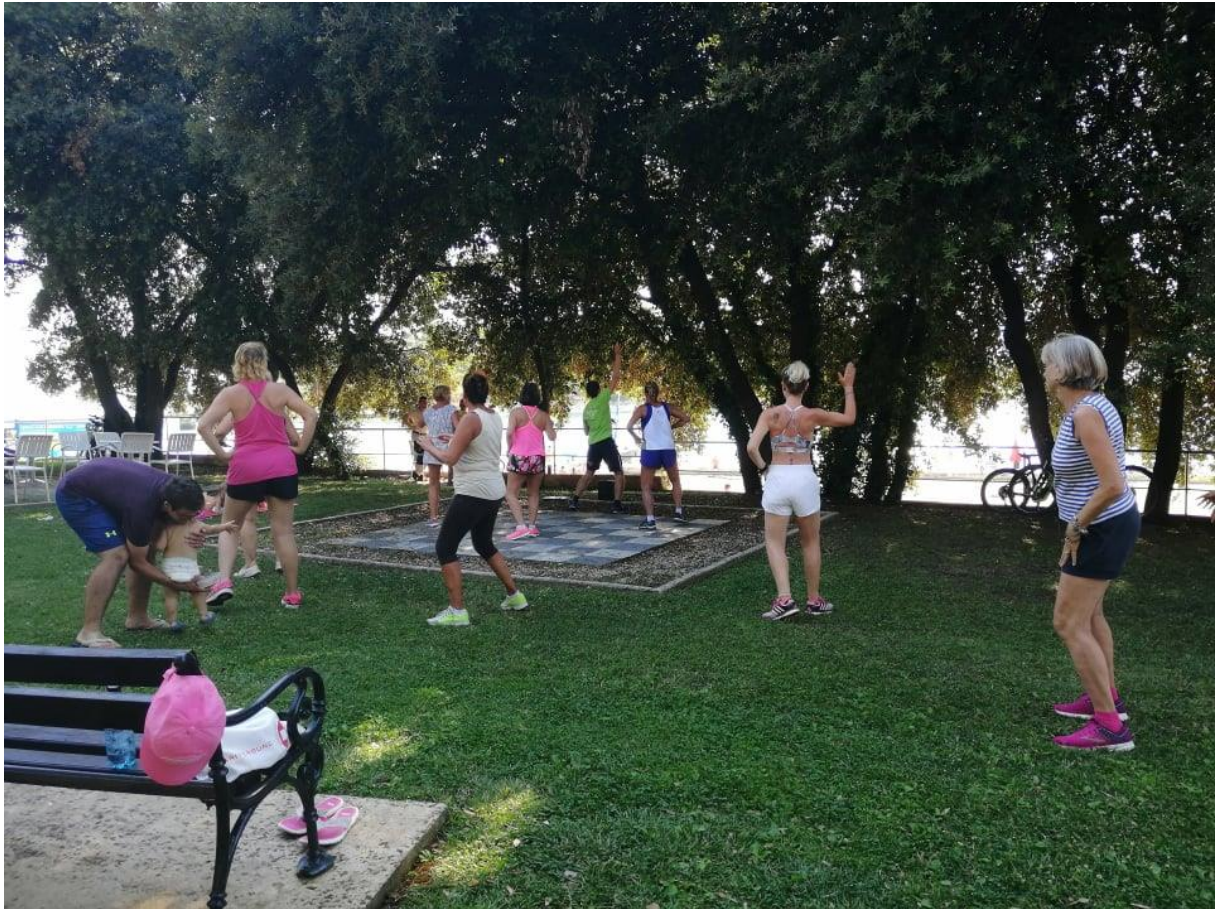
Fotografija 6: Zumba

stres i donosi samo pozitivnu energiju i misli. Zato je turistima jako zabavna i zanimljiva.