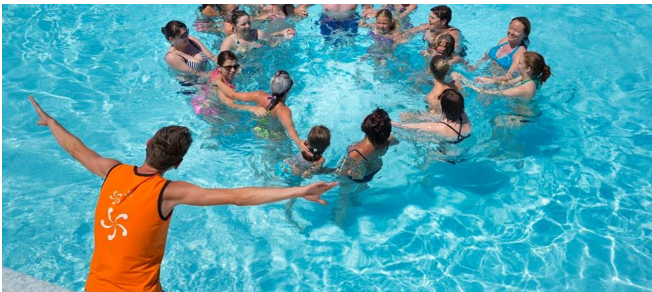
Fotografija 5: Aqua aerobic

Nadalje, sportske aktivnosti koje zahtijevaju još intenzivnije vježbe jesu keep fit, vježba s hula hopom, boks, vježbe za sagorijevanja masti, vježbe uz trampolin. Sve ovakve vježbe se izvode uz profesionalnog animatora koji će dodatno motivirati turiste, zbog toga i postoje animatori koji su samo za sportske aktivnosti. Cilj ovih aktivnosti jest motivirati turiste na vježbanje iako su na odmoru. Također, upotpuniti im dan i isto tako ponuditi nešto novo, nešto što još nisu probali.