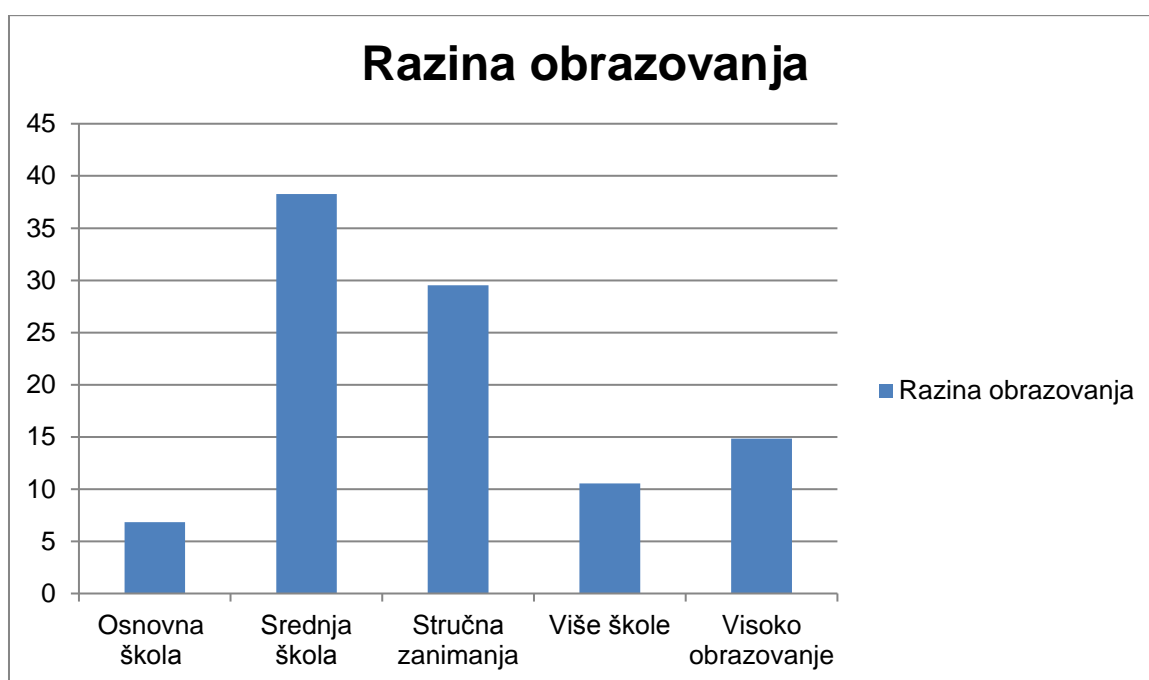
Grafikon 2. Struktura obrazovanja nositelja obiteljskog poduzetništva u Hrvatskoj 2017. godine (%)