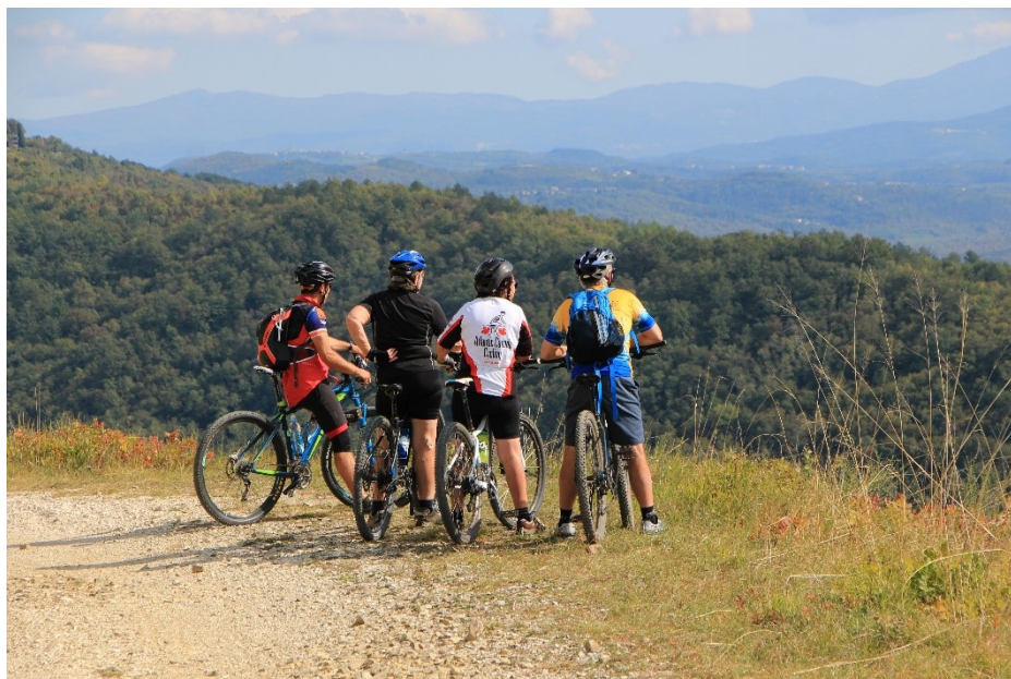
Slika 3.: Dio biciklističke dionice na Parenzani i pogled