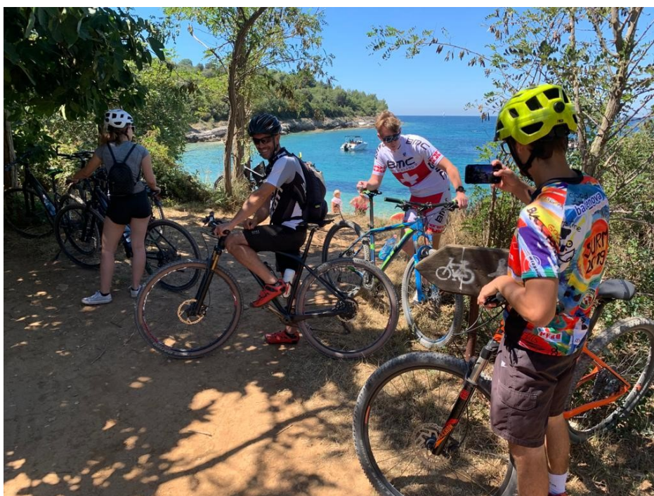
Slika 2: Uvala na biciklističkoj stazi na rt Kamenjaku