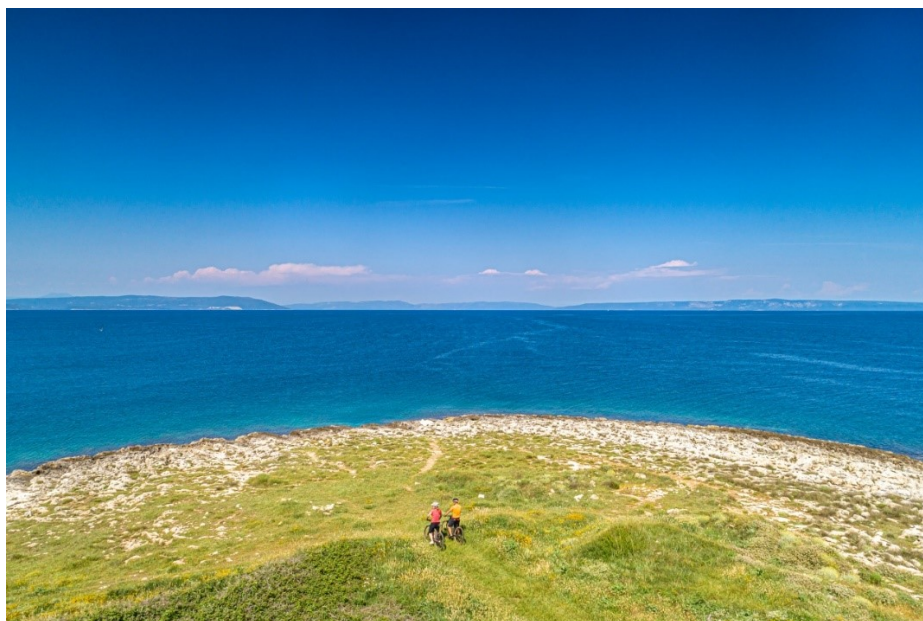
Slika 1: Rt Marlera, Općina Ližnjan