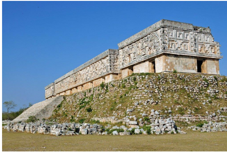
Slika 9. Guvernerova palača