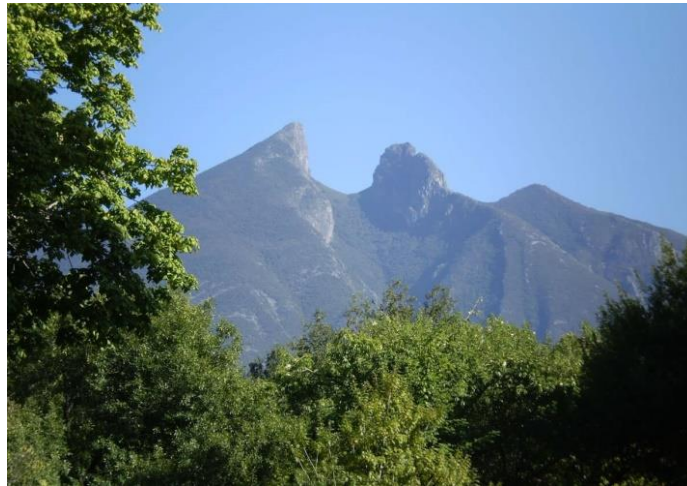
Slika 2: Nacionalni park Cumbres de Monterrey