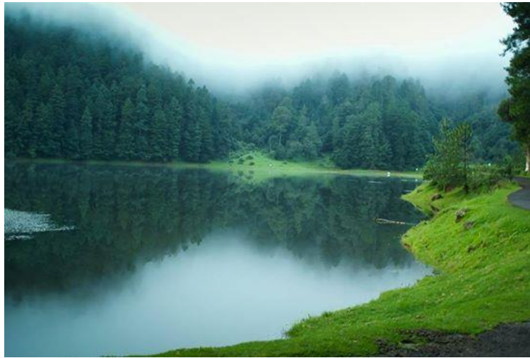
Slika 6. Nacionalni park Lagunas de Zempoala