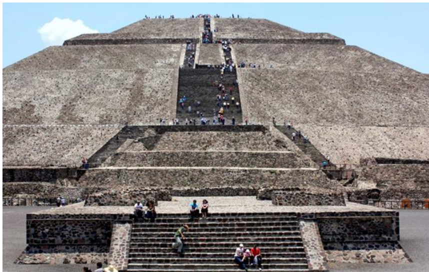
Slika 7. Sunčeva piramida

svoje impresivne veličine. Piramida je visoka 70 metara, a kvadratni tlocrt je dužine 222 x 256 metara. Avenija mrtvih sječe se s ulicom koja se proteže od istoka prema zapadu, a uz nju se nalazi arhitektonski kompleks poznat pod imenom Tvrđava unutar kojeg su se nalazile mnoge zgrade. Mreža ulica i avenija koje se međusobno sjeku pod pravim kutom dijele grad na četvrti, koje su se izvorno sastojale od višekatih zgrada. Manje piramide predstavljale su novo obilježje, koje se može pronaći i u drugim civilizacijama toga područja, s jednom nagnutom plohom koju slijedi druga nakošena na prvu, a to su talud i tablero. Unutar Tvrđave nalazi se nekoliko atraktivnih građevina, osobito Quetzalcóatlov hram u obliku piramide. Vanjski zidovi ukrašeni su kipovima koji predstavljaju čudovišna stvorenja, a to su kipovi Pernate zmije, zatim i druga mitološka bića mogu se pronaći na zidnim freskama. Ostale važne građevine su Palača jaguara, Hram poljoprivrede i Quetzalpapálotlova palača. Quetzalpapálotlova palača nalazi se u blizini Mjesečeva trga, ima brojne razine, a svaka od razina odgovara proširenjima koja su dodavana tijekom stoljeća. Najmlađa građevina ima prostranu terasu okruženu trijemom sa stupovima. Četvrtasti stupovi prekriveni su kamenim pločama ukrašeni plitkim reljefima, među kojima je i lik hibridna boga, poznata i kao Quetzalpapálotl, što doslovce znači „ptica-leptir“. 23