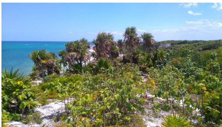
Slika 5. Nacionalni park Tulum