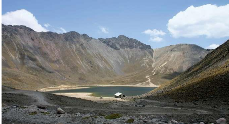
Slika 3: Nacionalni park Nevado de Toluca