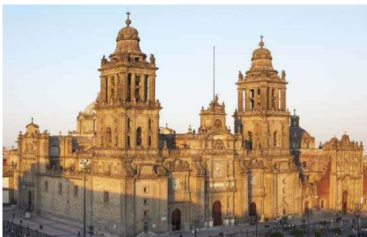
Slika 11: Metropolitanska katedrala

Metropolitanska katedrala najveća je i najstarija katedrala u Americi. Izgrađena je u razdoblju od gotovo 250 godina (1573.–1813.) na sjevernoj strani glavnog trga Zócala, predstavlja mješavinu triju arhitektonskih stilova koji su prevladavali tijekom kolonijalnog razdoblja, a to su renesansa, barok i neoklasicizam. Katedrala je dugačka 100 metara, ima dva tornja visine 60 metara, a za njenu izgradnju koristilo se kamenje iz srušenih astečkih hramova. Impresivna Nacionalna palača (Palacio Nacional) duga 200 metara nalazi se na istočnoj strani glavnog trga, a izgrađena je 1563. godine. Na sjevernom dijelu grada nalazi se brdo Tepeyac, mjesto koje je nekoć bilo posvećeno astečkoj božici Tonantzin. Od 17. stoljeća, kršćanima brdo predstavlja svetište Gospi od Guadalupe koja je istaknuti simbol meksičke kulture. Milijuni hodočasnika i turista posjećuju dvije tamošnje bazilike: Antigu (Staru) i veliku kružnu baziliku Nueva (Nova), unutar koje se nalazi Gospina slika visine od 6 metara. 31