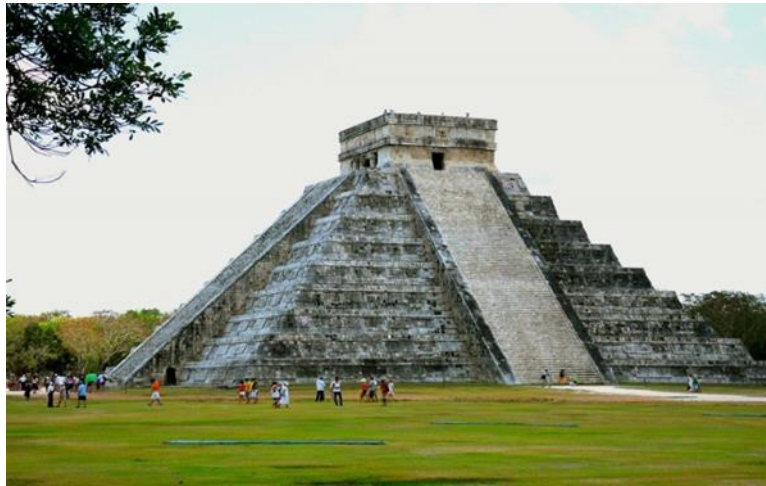
Slika 10. El Castillo

građevina i simbol Chichén Itzáe, a takvo ime su mu dali Španjolci zbog njegove veličine i položaja, jer stoji izdvojen usred prostrane ravnice između igrališta i Hrama ratnika. Riječ je o četverostranoj piramidi s pravokutnim hramom na vrhu, visine 24 metara. Svaka strana piramide ima 91 stepenicu uključujući i jednu na gornjoj platformi, te oni sveukupno broje 365 stepenica koje predstavljaju broj dana u sunčevom kalendaru. Tijekom proljetne i jesenske ravnodnevnice sjene od sunca prave izgled zmiје koja se spušta niz stepenice. 28