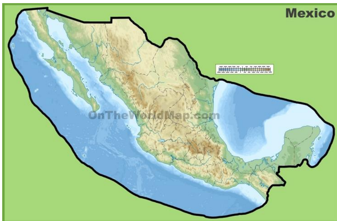
Slika 1. Karta Meksika

najviši vrh Meksika Citlaltépetl visine 5610 metara, zatim slijede Popocatepetl (5452 metra) i Iztaccíhuatl (5286 metara) koji je izrazito pogodan za planinarenje. Južno od Cordillera Neo Volcánica nastavlja se planinski lanac Sierra Madre del Sur (najviši vrh Cerro Tlacotepec, 3703 metara) koji se vrlo strmo izdiže iz uskoga pacifičkog primorja. Prema istoku Sierra Madre del Sur prelazi u visoravan Oaxaca koja se preko Tehuantepeške prevlage (fizičkogeografska granica Sjeverne i Srednje Amerike) nastavlja gorjem Sierra de Sostonusco, te visoravni Chiapas na krajnjem jugu Meksika. Sjeverno od visoravni Chiapas nalaze se prostrane vapnenačke zaravni koje se protežu i na ravnice poluotoka Yucatána. Poluotok Yucatán leži sjeveroistočno od ravnice Tabasco i proteže se prema sjeveru, čineći razdjelnik između Meksičkog zaljeva i Karipskog mora. Vapnenački (kraški) teren poluotoka rijetko prelazi 150 metara nadmorske visine. 4