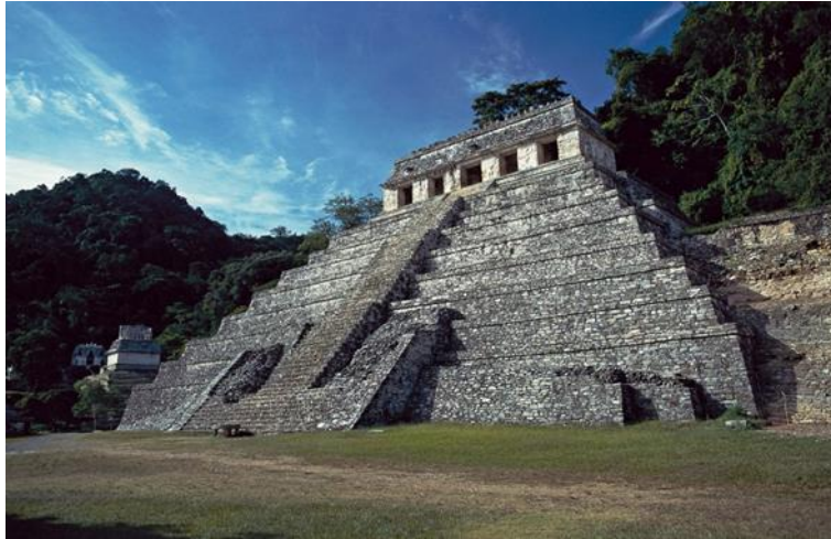
Slika 8. Piramida natpisa