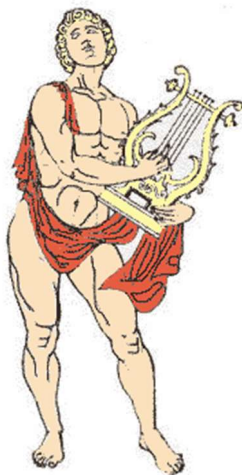
Prilog 1. Orfej