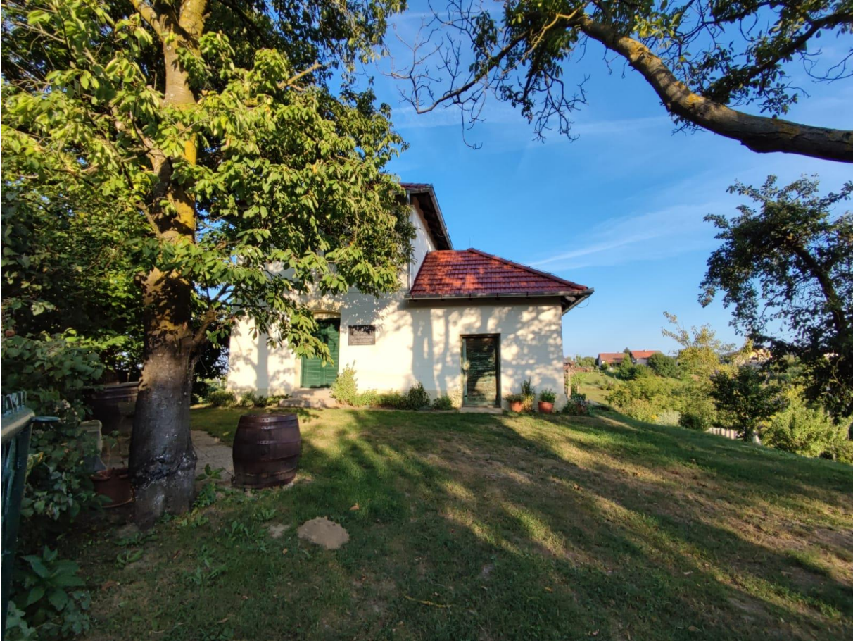
Slika 2.1. klet Frana Galovića i kostanj ispred kleti 5

Starigrada, svi s ponosom govore o tome kako su njihovi stariji bili u dobrim odnosima s Franom Galovićem, što ukazuje na to kako se spomen Frana Galovića kao osobe, a ne samo pisca neće tako brzo zaboraviti.