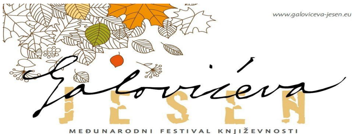
Slika 4.2. Naslovna strana festivala Galovićeva jesen 17

Prema podacima preuzetima sa internetske stranice o tom festivalu, Galovićeva jesen 16 književni je festival koji se svake godine održava u Koprivnici krajem mjeseca listopada u spomen Galovićeve smrti 26. listopada 1914. godine. Festival se održava već dvadeset devet godina. U sklopu festivala održavaju se razni književni susreti na kojima nastupaju mnogi poznati i manje poznati književnici, organiziraju se javna čitanja, predstavljanje knjiga, razne predstave. 2018. godine festival Galovićeva jesen imao je obilježje internacionalnog festivala književnosti zbog velikog odaziva pisaca i književnika iz Njemačke, Australije, Mađarske, Bosne i Hercegovine i drugih zemalja. Do 2011. godine Galovićeva jesen bila je književna manifestacija koja je od te godine prerasla u međunarodni festival književnosti zbog sve veće zainteresiranosti književnika i umjetnika iz stranih zemalja. Također se od 1997. godine dodjeljuje i Nagrada „Fran Galović“ za knjigu zavičajne tematike. Ove godine, Galovićeva jesen počinje u srijedu, 21. listopada 2021. godine i traje do subote, 24. listopada 2021. godine te su neki od važnijih događanja predstavljanje knjige Mapiranje dobitaka Matije Ivačića, Mali Galović , Galoviću u čast – recital poezije, Dok večer se zmračí – predstavljanje izabranih djela Frana Galovića i Završna svečanost i dodjela nagrada Fran Galović.