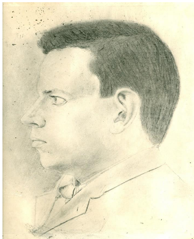
slika 2.2. autoportet Frana Galovića 8

Neke od slika prikazuju njegovo rano zanimanje za kazalište i svjetsku dramsku književnost, što se može zaključiti već iz naslova njegovih radova: Lady Machbeth (dvije slike), Hamlet , Tosca i još neke dramske scene. Zanimljivost vezana uz tu zbirku radova i Galovićeve dramu je da se na kraju zbirke nalaze neki radovi uz koje se ne veže datum, a koji su skice za njegove buduće knjige; među njima i tri varijante skica za njegovu dramu Tamara . (Ladika, 1963.: 50-51)