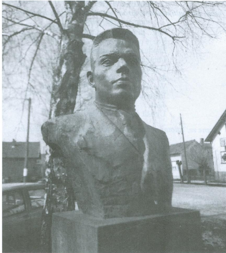
slika 2.2. Poprsje Frana Galovića u Peterancu 7

U poglavlju o Galovićevom likovnom opusu, Ivo Ladika dijeli njegove pejzaže na nekoliko tema. Najčešći su idealizirani i romantičarski pejzaži kao: Mir , Večer u zimi , Seoska idila , Crkva na selu , Idila i drugi koji opisuju kakav je pogled Fran Galović imao na svijet u mladenačkim godinama.