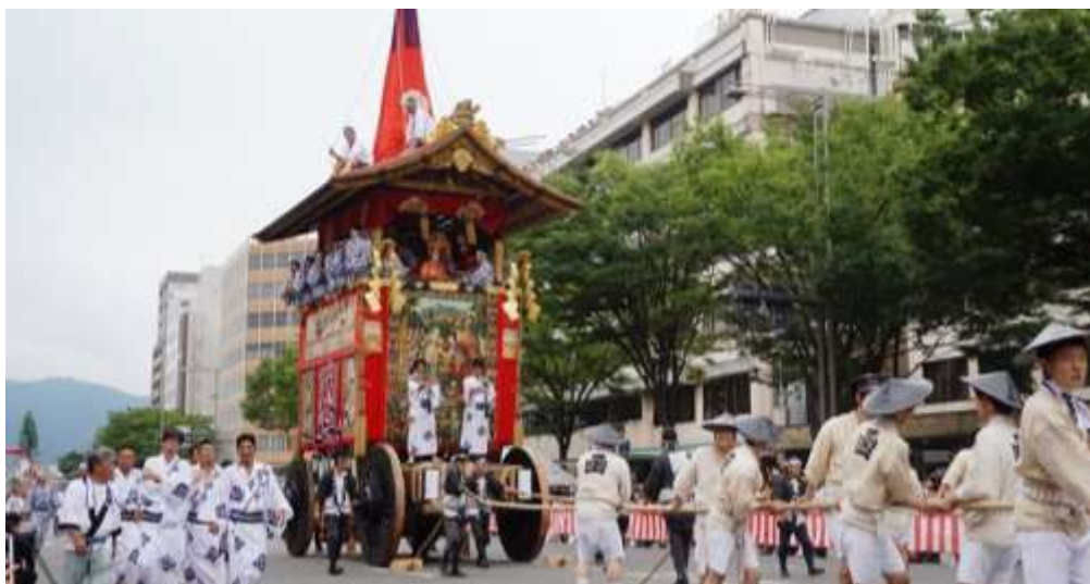
Slika 1: Splav korištena tijekom Gion Matsuria