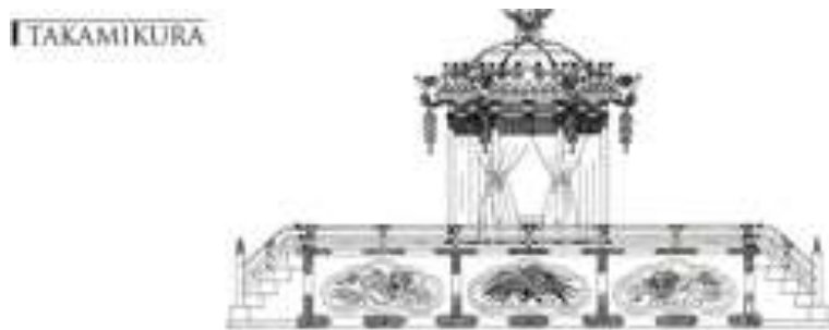
Slika 3: Takamikura

Ozawa u svojoj knjizi također pobliže opisuje same vrste i stilove mikoshija. Sam mikoshi se može opisati kao „kočija“ božanstva do svetišta u kojem pripada, a postoje dvije vrste: miya mikoshi ili službeni mikoshi svetišta te machi mikoshi ili mikoshi udruge lokalnog susjedstva (Ozawa, 1999: 113). Što se tiče stila mikoshija, postoje također dvije vrste, a to su Kansai stil i Kanto stil. Kansai stil je stariji te se smatra kako je potekao iz imitacije takamikura 9 , dok kod Kanto stila, područje odmah iznad daiwa , odnosno baze na kojoj gornja struktura leži, namijenjeno je kako bi se sugerirala oblast šintoističkih svetišta (Ozawa, 1999: 113).