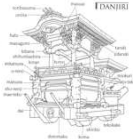
Slika 5: Danjiri

Osim yame i hoko, još jedna splav koja se koristi u matorijima je danjiri . Kishidawa festival je poznat upravo po brojnim danjirijima, odnosno u ovom festivalu, koji čuva svoju tradiciju preko 280 godina, koristi se 32 danjirija te svaki mjeri četiri metra u visinu, dva i pol metra u širinu i teži oko četiri tone, a krasi ih reljefni ukrasi koji opisuju slave epizode iz dobro poznatih borbenih priča prošlosti (Ozawa, 1999: 115).