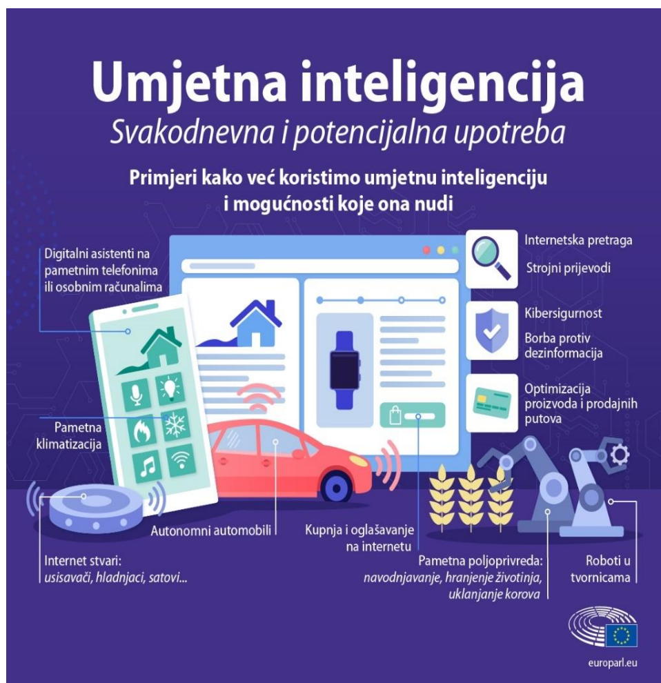
Slika 2. Primjeri umjetne inteligencije koji koriste svakodnevnim aktivnostima. (Izvor: Europski parlament, 2020).