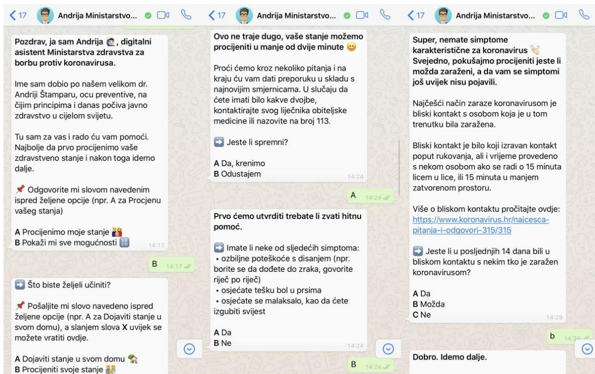
Slika 4. Razgovor s digitalnim asistentom putem WhatsApp mobilne aplikacije.

Također, još jedan način razgovora s digitalnim asistentom Andrijom bio je putem pozivnog centra koji je bio aktivan od 1. rujna 2020. godine, a putem kojeg su građani 24 sata dnevno mogli dobiti tražene informacije. Pozivni broj bio je 091/614-9052. Nakon osnovne komunikacije, digitalni asistent Andrija je postavljao pitanja o broju osoba u kućanstvu, jesu li članovi stariji od 65 godine te jesu li kronični bolesnici. Isto tako, postavljao je pitanja postoje li kod članova obitelji simptomi bolesti te je li netko od istih bio u kontaktu s većim brojem ljudi. Nakon što razgovor završi, odnosno ustanovi se da osoba ima ili nema simptome zarazne bolesti, digitalni asistent Andrija od sugovornika je tražio približnu lokaciju koja će ostati anonimna, ali koja služi da se dobiju podaci o novim mogućim žarištima. Lokacija se slala putem SMS-a, odnosno kao privitak u poruci. Nakon što je digitalni asistent Andrija primio lokaciju, zahvalio se korisniku usluge te mu dodijelio titulu „Bebe Štampar“, što se smatralo da je bilo ohrabrujuće i poticajno za daljnje izvještavanje o razvoju bolesti u kućanstvu (Brezak Brkan, 2020).