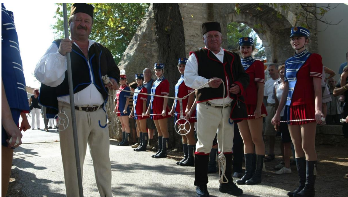
Slika 6. Nosači prstenca

Program Trke na prstenac započinje povorkom, koju, iza folklorša, mažoretkinja i puhača, prati svečana kočija koju vuku dva bijela lipicanca upregnuta ukrašenim hamovima, u kojoj sjede članovi časnog suda, koji imaju posebnu privilegiju dovesti se na taj način nasuprot svečane lože na trkalištu. Iza kočije korača vođa kopljonoša, čvrsto držeći pušku kremenjaču naslonjenu na ramenu. Iza njega stoje tri stasita momka koji visoko uzdižu prijeteće kelebarde. Iza njih kreću se nosači prstenca, koji ga nose na razapetom konopu. 73