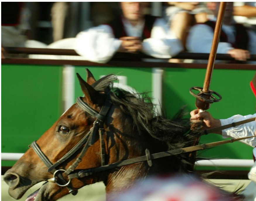
Slika 7. Pogodak u sridu

Prstenac su u prapočecima vjerojatno iskovali nepoznati barbanski kovači, a za obnovljenu trku bio je izgrađen od okruglog metalnog profila. Danas se on lijeva od posebne legure, koja je dovoljno čvrsta da pretrpi nalete koplja. Sastoji se od dva koncentrična kruga, od kojeg je promjer vanjskog 110 milimetara, a promjer unutarnjeg „srida“ 32 milimetra. Prostor između ta dva kruga podijeljen je na četiri jednaka polja. Pogodak u polje iznad sride donosi dva punta, polje ispod sride jedan punat, a pogodak u lijevo ili desno od sride donosi pola punta. Pogodak u sridu, najvažniji pogodak, donosi tri punta. 75