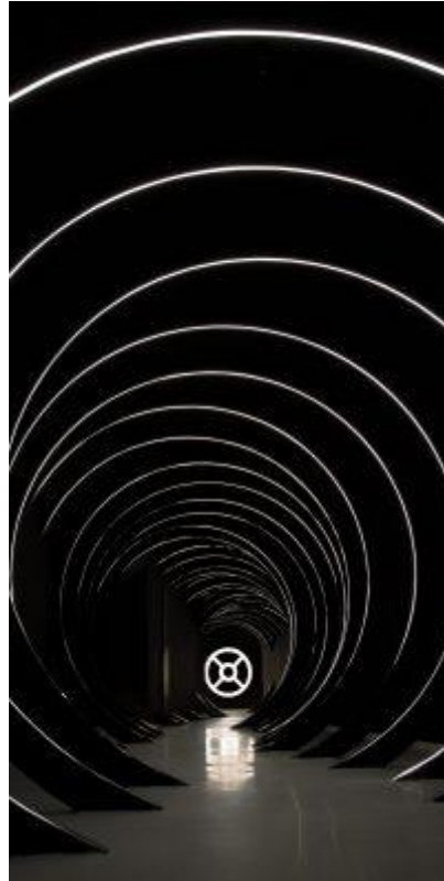
Slika 10. Hodnik u Centru za posjetitelje

je kao multimedijalni prostor gdje će se ispričati povijest mjesta, njezinih spomenika, kulture, običaja, narodne nošnje, uz naglasak na opis Trke na prstenac te niza pojedinosti vezanih uz njezino odvijanje i povijest. 127