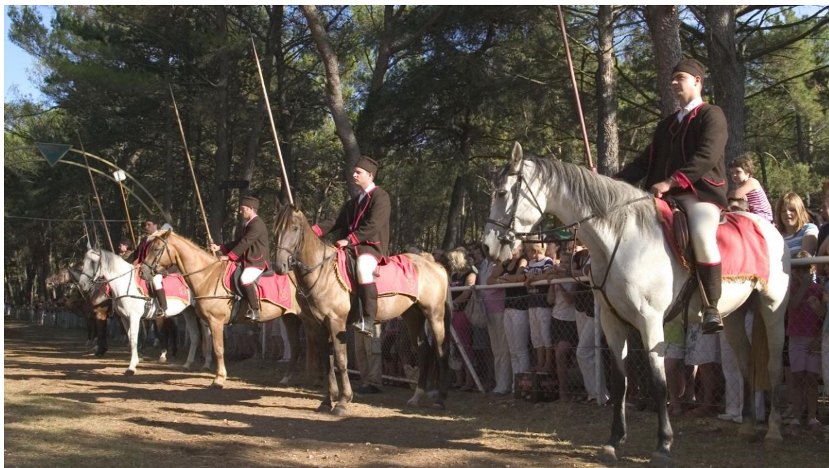
Slika 9. Razne pasmine konja na Trci na prstenac

bivšu državu, a zatim i Hrvatsku od 1986. do 1992. na svjetskoj izložbi trakenera u Njemačkoj. 82