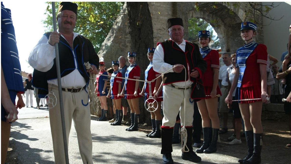
Slika 6. Nosači prstenca

Program Trke na prstenac započinje povorkom, koju, iza folklorša, mažoretkinja i puhača, prati svečana kočija koju vuku dva bijela lipicanca upregnuta ukrašenim hamovima, u kojoj sjede članovi časnog suda, koji imaju posebnu privilegiju dovesti se na taj način nasuprot svečane lože na trkalištu. Iza kočije korača vođa kopljonoša, čvrsto držeći pušku kremenjaču naslonjenu na ramenu. Iza njega stoje tri stasita momka koji visoko uzdižu prijeteće kelebarde. Iza njih kreću se nosači prstenca, koji ga nose na razapetom konopu. 73