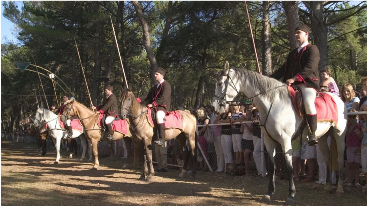
Slika 9. Razne pasmine konja na Trci na prstenac

bivšu državu, a zatim i Hrvatsku od 1986. do 1992. na svjetskoj izložbi trakenera u Njemačkoj. 82