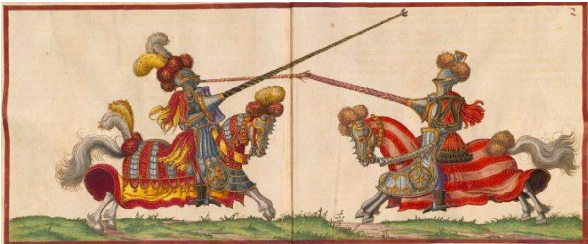
Slika 1. Prikaz smrti Henrika II. nastale u dvoboju

viteški dvoboji na konjima s dugim kopljima, koja su bila duga preko 3 metra i imala karakterističan štitnik za šaku. U tom dvoboju dva bi viteza nasrnula jedan na drugog najvećom brzinom, nastojeći se međusobno izbaciti sa sedla jedim udarcem koplja. Viteško koplje u ratu je bilo oštrog čeličnog i ubojitog vrha, no za turnire je korištena varijanta sa zaobljenim ili tupim drvenim vrhom te su se, iako je ovo koplje bilo bezazleno, događale teške, a ponekad i smrtonosne povrede. Tako je 1559. francuski kralj Henrik II. odlučio, usprkos opomeni svojeg liječnika, poznatog Nostradamusa koji mu je prerekao tragičnu smrt, zajahati konja i pokazati svoje ratničko umijeće. Spomenuto bezopasno drveno koplje njegova protivnika zabilo se Henriku u oko te je on ostao na mjestu mrtav. Nakon toga, viteški su dvoboji zabranjeni i počinju se organizirati sigurniji oblici natjecanja, borbene vještine pretvaraju se u dvorske zabave u kojima je trka na prstenac dobila puno veću ulogu. 38