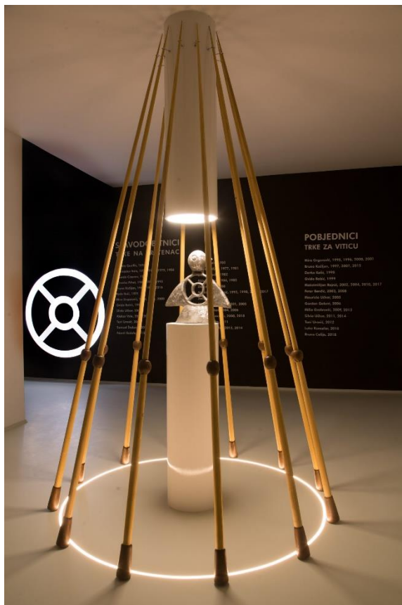
Slika 8. Koplja izložena u Centru za posjetitelje

Glavno oružje natjecatelja je koplje, odnosno motka od sušenog smrekinog drveta sa željeznim šiljkom, svijetlosmeđe boje, promjera 30 milimetara, duga tri metra, s konusnim tuljkom na donjem dijelu u kojem je smješten olovni uteg za ravnotežu koplja težak oko 1,2 kilogram te jabuka za zaustavljanje pogođenog prstenca, to jest kugla na 80 centimetara od tuljka. Koplje, simbol viteštva pa i uspravnosti, mora biti elegantno i uravnoteženo, pogodno za nišanjenje i gađanje prstenca. Takva koplja izrađivao je danas pokojni majstor i stolar Ive Kožljan iz Puntere. Vrlo vjerojatno su nepoznati barbanski majstori na sličan način izrađivali koplja i za prve zabilježene Trke. Za prvih nekoliko obnovljenih Trka koristila su se teška i nezgrapna koplja koja su bila izrađena od metalnih cijevi. Njih je, kao i prve prstence, izradio majstor Josip Pavlič iz Pavličići. 76