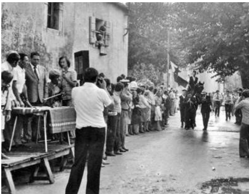
Slika 4. Trka na prstenac 1976.

Promjene u načinu ratovanja tijekom 16. stoljeća i razvoj vatrenog oružja tijekom 17. stoljeća zbog kojeg s bojnog polja odlazi konjica, prouzročilo je da njezino mjesto preuzmu pješaci naoružani mušketama. Koplje je napustilo europsko ratovanje, polako je propao viteški stalež te su tako i natjecanja izgubila na popularnosti. Zbog toga se već 1703. izgubio trag barbanskoj Trci, a uspomenu na nju sačuvao je barbanski načelnik Josip A. Batel. Osim njega, Danilo Klen se vrlo detaljno bavio ovom tematikom. 69 Podaci povijesne činjenice do kojih je došao Danilo Klen bile su polazište za rekonstrukciju Trke na prstenac i organiziranja predstave na Istrijadi 76. Trka na prstenac je tako 14. kolovoza 1976. obnovljena. 70