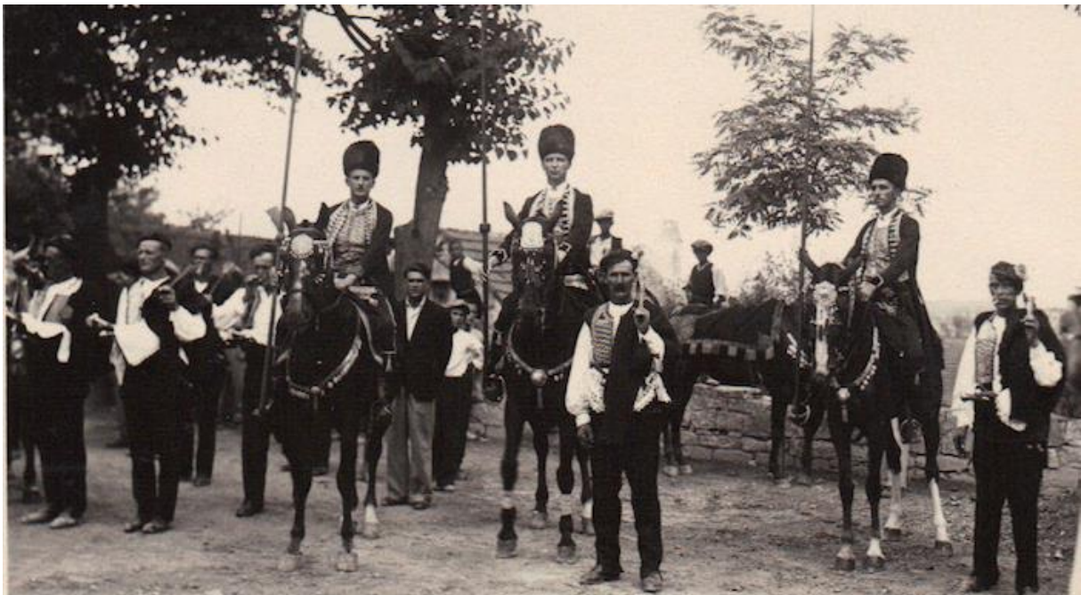
Slika 2. Konjanici Sinjske alke u prošlosti

Trka na prstenac ili „alka“, prema turskom nazivu željeznog koluta u koji se gađa prilikom te igre, izvodila se ne samo u Istri već i u susjednoj Italiji, pa nije isključeno da je upravo odande prenesena. Trke na prstenac bile su vrlo raširene i u gradovima Dalmacije, gdje su se održale dulje nego u Istri. Konjičke su alke prestale u Zadru 1820., u Makarskoj 1832., a u Imotskom oko 1840. Alka se do danas održala jedino u Sinju. Pješačke alke koje su mnogo pristupačnije širem broju natjecatelja zbog jeftinije opreme održavale su se u Splitu, Šibeniku i Skradinu, no, nestale su prije konjičkih. 54