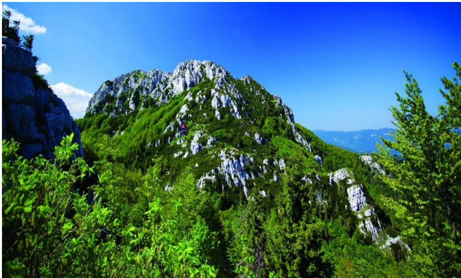
Slika 4. Nacionalni park Risnjak

Uz bogatstvo vegetacijskog pokrova, usko je povezana i raznolikost životinjskog svijeta. Obitavaju tri velike zvijeri Europe: ris ( Lynx lynx ) po kojem je i Risnjak dobio ime, vuk ( Canis lupus ) i smeđi medvjed ( Urus arctos ). Također, tu je čitav niz sisavaca, vodozemaca i ostalih predstavnika faune. Potrebno je spomenuti više od 130 vrsta leptira od kojih je nekoliko endemskih vrsta. 21