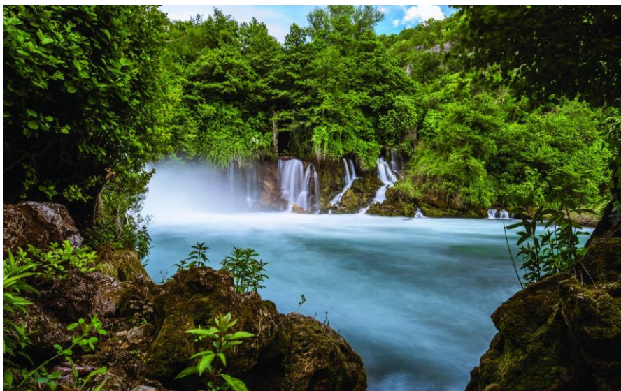
Slika 8. Nacionalni park Krka

s oskudnom vegetacijom i šume gmazovima i manjim sisavcima. Zbog proljetne i jesenske seobe ptica Krka je uvrštena u ornitološki važna područja Europe. 29