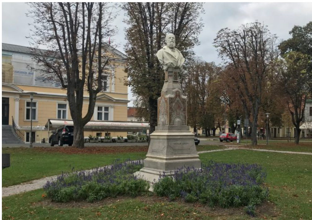
Slika 8- spomenik Radoslavu Lopašiću