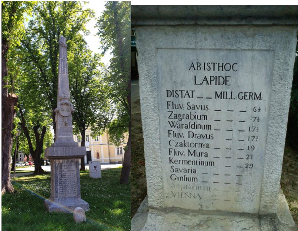
Slike 4 i 5- Miljokaz u pravoj veličini i uvećani detalj