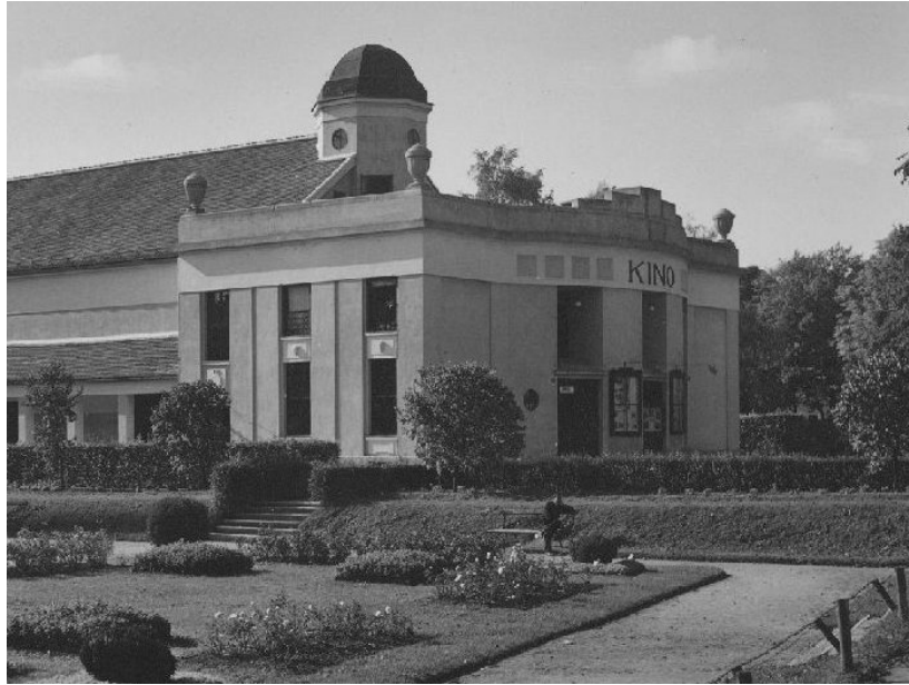
Slika 3- Kino Edison prije 20 godina