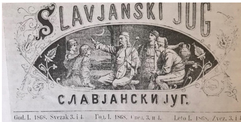
Slika 13- naslovna stranica Slavjanskog juga