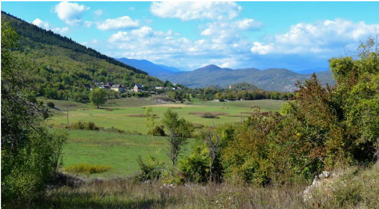
Slika 10. Lika

Novinari portala Plava Kamenica opisuju Liku kao prirodni djevičanski teritorij potencijalno novog hrvatskog turizma, koji bi se bazirao na održivom iskorištavanju neodoljive atraktivnosti čiste prirode. Napominju da bi se Lika pretvorila u turističku zonu, potrebna je opsežna i precizna državna operacija strateške naravi, koja bi se dosljedno provela. Na slici 10 nalazi se prikaz ličkog kraja.