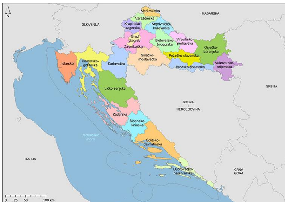
Slika 2. Županije u Republici Hrvatskoj