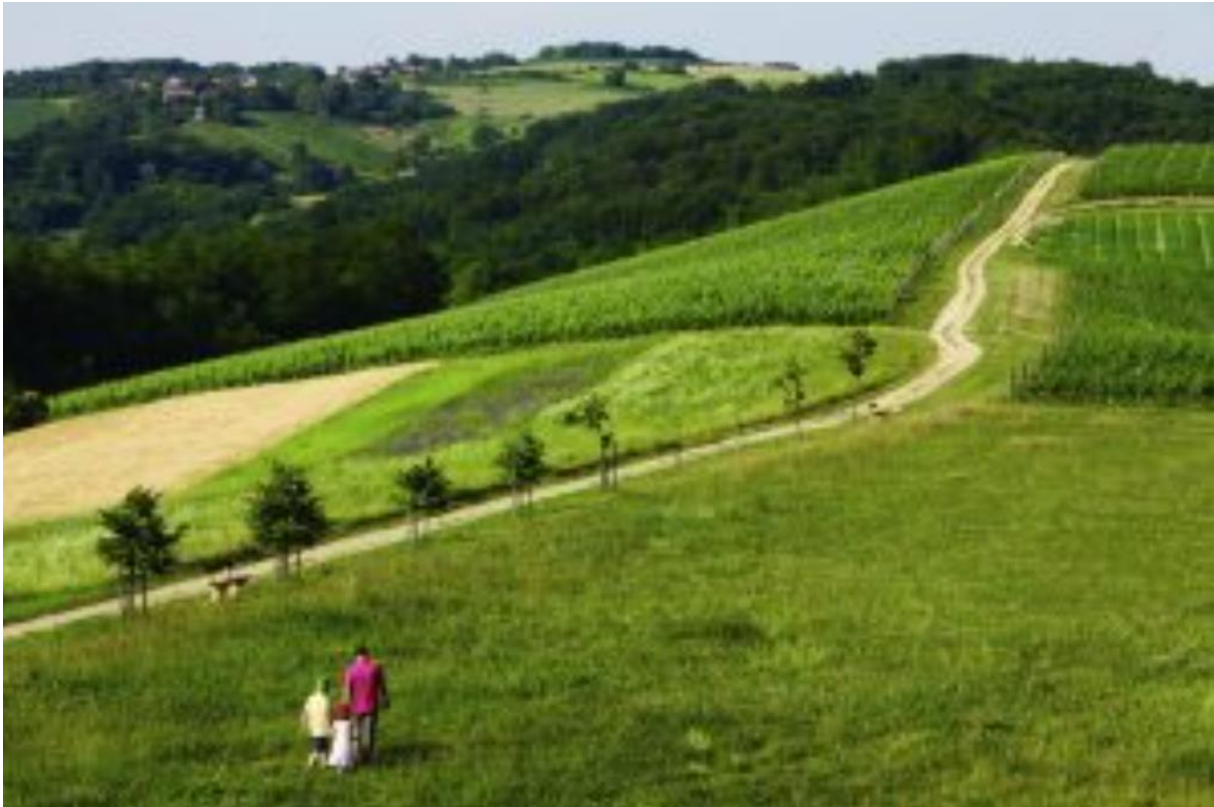
Slika 12. Hrvatsko Zagorje

atraktivno. Muzej krapinskih neandertalaca jedan je od modernijih hrvatskih izložbenih prostora, a zagorski bi dvorci, uz ozbiljna ulaganja, uistinu mogli postati masovna turistička atrakcija. Osim toga, Zagorje posjeduje i pretpostavke za politički turizam, jer se na tako malom prostoru može ispričati veći dio novije hrvatske političke povijesti. No, Zagorje se zasad uglavnom bavi selektivnim zdravstvenim i masovnim vjerskim turizmom, namijenjenim domaćim potrošačima. 17 Na slici 12 prikazan je dio Hrvatskog Zagorja.