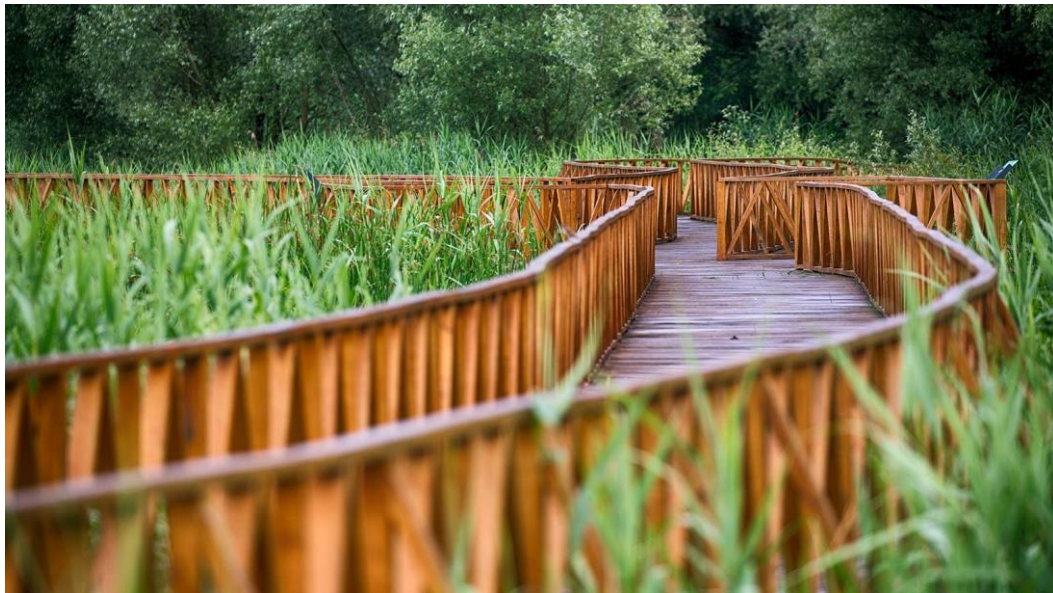
Slika 8. Park prirode Kopački rit

Portal Kult Plave Kamenice opisuje Baranjukao jedan od najfascinantnijih hrvatskih krajeva. Navode kako jeonaautentično divlja, a opet pristupačna i bezopasna. Baranja je puna vinograda kojadaju vrhunska vina s podrumima koji spadaju među starije u ovom dijelu Europe. Ona ima ponešto malih obiteljskih pansiona koji zaista stvaraju ugođaj života na idiličnom selu. Kopački rit, sa svojim orlovima, kormoranima, jelenima i vodenim zmijama mogao bi postati popularan kao Plitvice. Ističu kako je jedina loša strana Baranje nepostojanje malo većeg hotelaza smještanje potencijalnih gostiju. Na slici 8 prikazan je djelić Parka prirode Kopački rit.