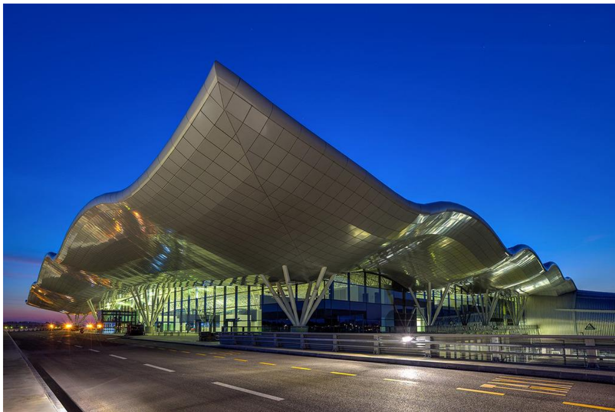
Slika 4. Zračna luka „Franjo Tuman“ (izvor:

najprometnijih zračnih luka na prostoru između Jadrana i Baltika. 9 Na slici 4 prikazana je zračna luka „Franjo Tuđman“.