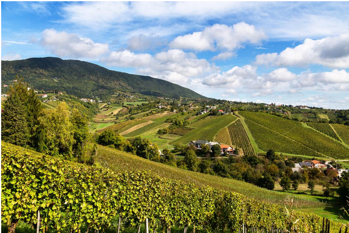
Slika 9. Plešivica