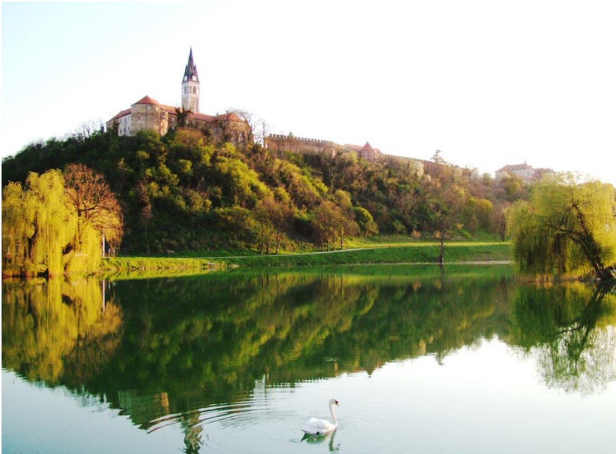
Slika 11. Ilok

umjesto turističke ekspanzije, i Iloku se dogodio val iseljavanja. Ilok , gdje povremeno pristaju dunavski kruzeri, karakterističan je primjer da kontinentalni turizam u Hrvatskoj zapravo ne može uspjeti bez snažne i sustavne državne potpore, s naglaskom na promoviranje kontinentalnih destinacija u inozemstvu.“ Na slici 11 prikazan je popularan dvorac i izletišta u Iloku koji ima potencijal razvoja i unapređivanja turizma kontinentalne Hrvatske.