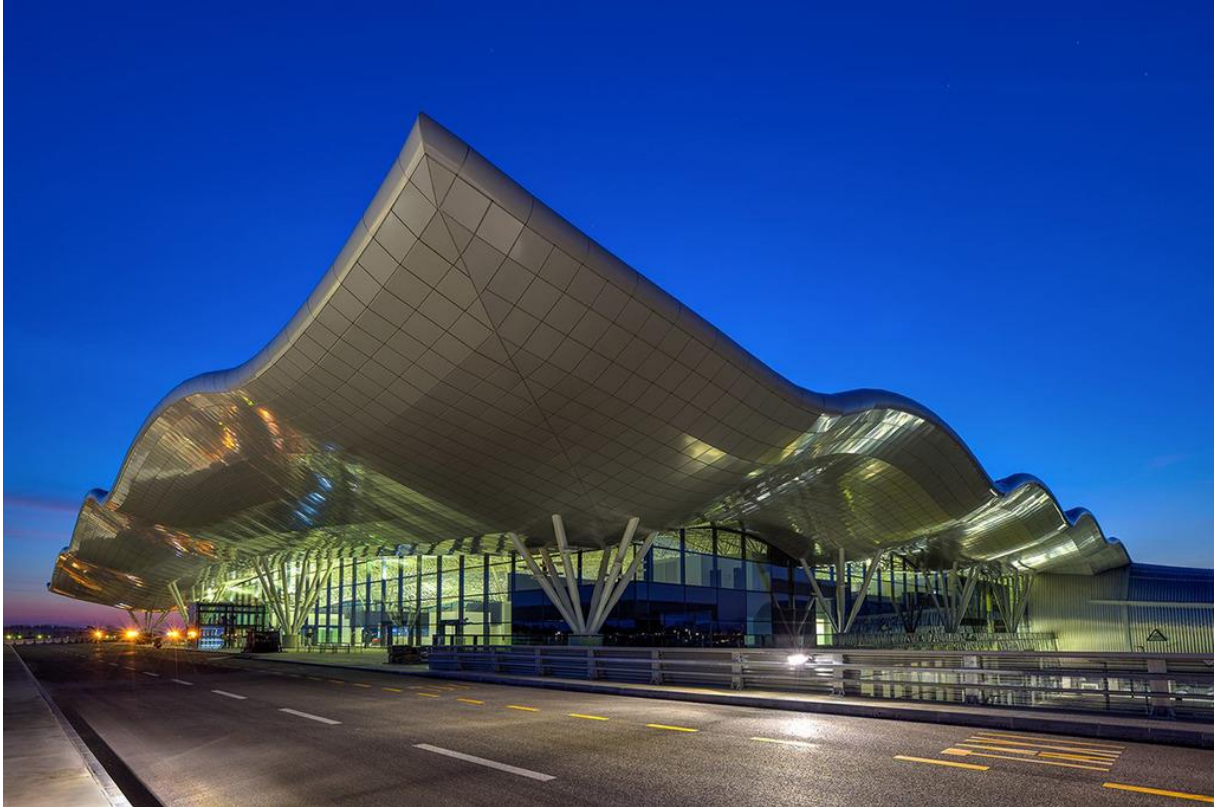
Slika 4. Zračna luka „Franjo Tuman“

najprometnijih zračnih luka na prostoru između Jadrana i Baltika. 9 Na slici 4 prikazana je zračna luka „Franjo Tuđman“.