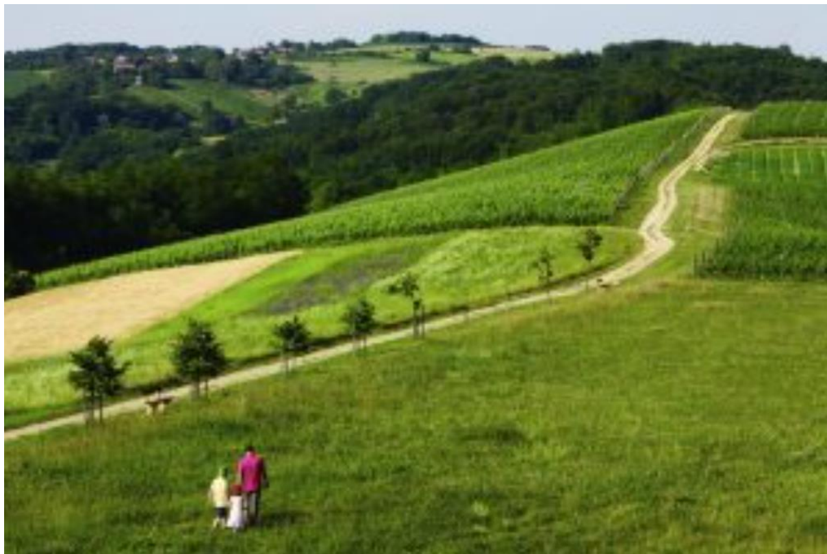
Slika 12. Hrvatsko Zagorje

atraktivno. Muzej krapinskih neandertalaca jedan je od modernijih hrvatskih izložbenih prostora, a zagorski bi dvorci, uz ozbiljna ulaganja, uistinu mogli postati masovna turistička atrakcija. Osim toga, Zagorje posjeduje i pretpostavke za politički turizam, jer se na tako malom prostoru može ispričati veći dio novije hrvatske političke povijesti. No, Zagorje se zasad uglavnom bavi selektivnim zdravstvenim i masovnim vjerskim turizmom, namijenjenim domaćim potrošačima. 17 Na slici 12 prikazan je dio Hrvatskog Zagorja.