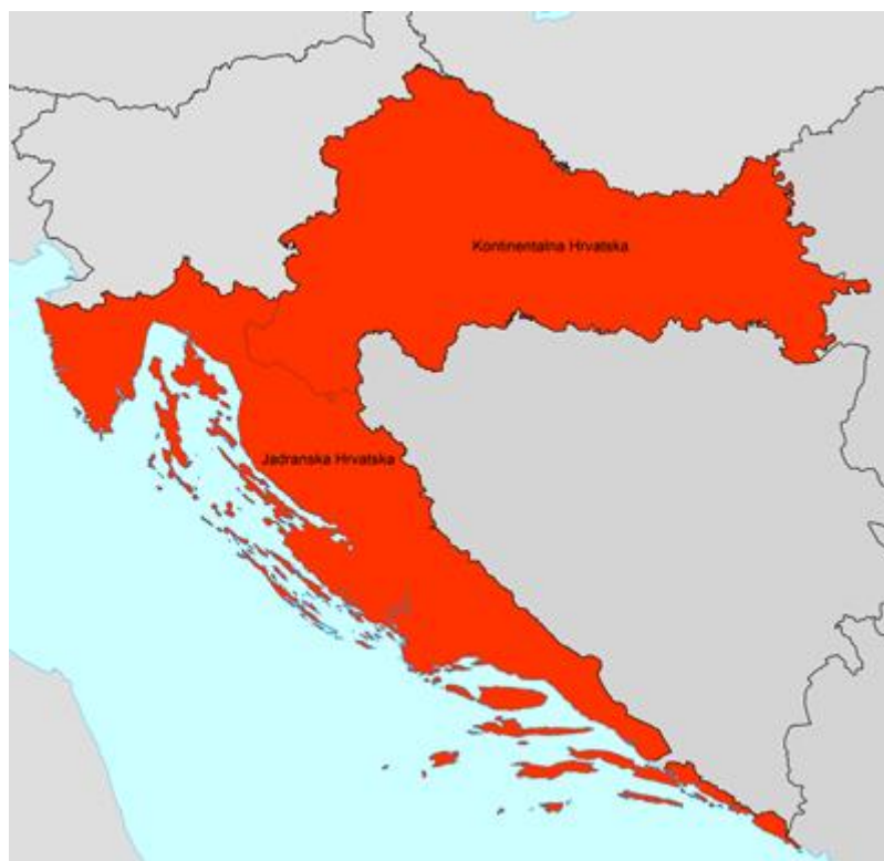
Slika 1. Podjela Hrvatske: kontinentalna i jadranska Hrvatska