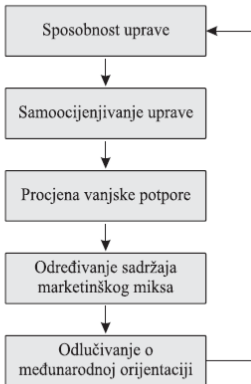
Slika 3. Proces orijentacije na međunarodno tržište