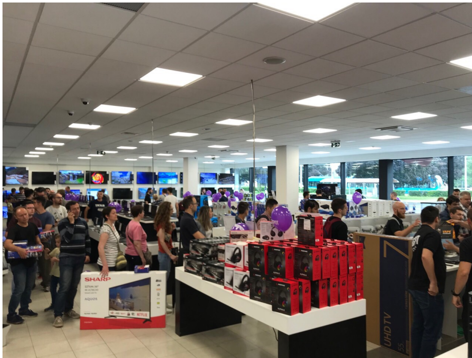
Slika 4. Poslovnica poduzeća HG SPOT d.o.o. u Zagrebu – kvart Utrine