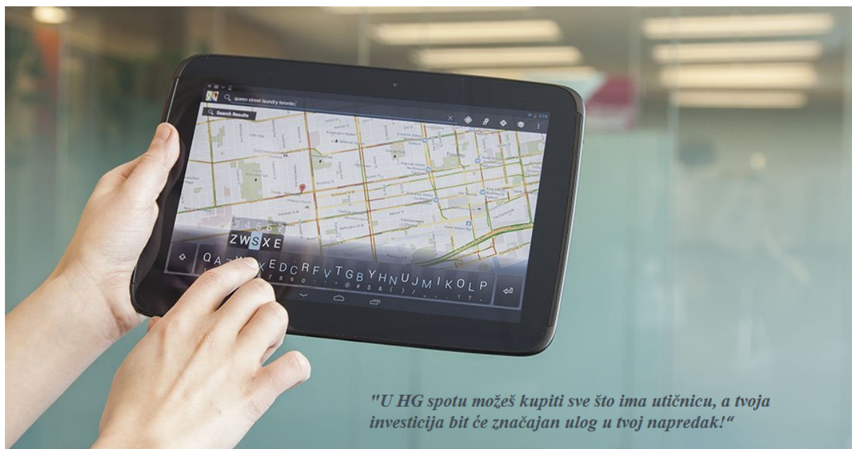
Slika 5. Početak promotivnog storytellinga poduzeća HG SPOT d.o.o.