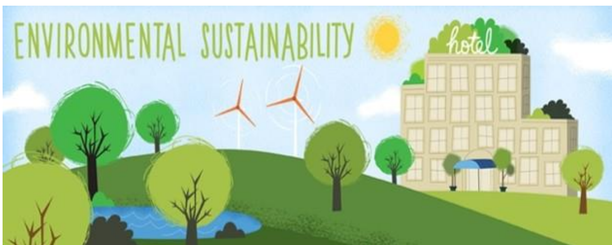
Slika 1: Ilustrativni prikaz održivog hotela

Uvođenje ekološke politike u hotelima obično je motivirano, s jedne strane korišću od zelenog poslovanja, a s druge strane štetama nastalim zbog nespremnosti hotela da u svoju poslovnu politiku uvrsti i ekološke kriterije. Biti zelen je postala top tema kojom se bavi posljednjih nekoliko godina i nastavlja dalje privlačiti pozornost. Nekoliko studija u hotelima je potvrdilo kako se mogu ostvarit ekonomske koristi kroz provedbu okolišnih i društvenih inicijativa. Osim troškova ulaganja, postoje koristi hotela pri odabiru ekološki prihvatljivog poslovanja.