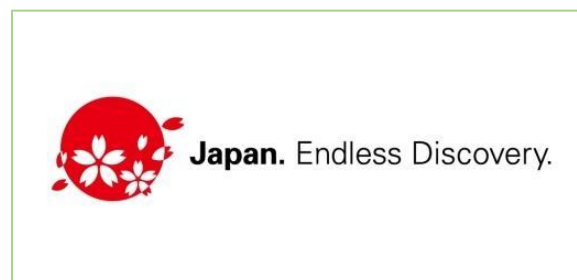
Slika 5. Logo JNTO-a

Bez obzira na veličinu, izgled ili složenost web stranice, svaki posjetitelj mora jasno razumjeti poziciju na tržištu. Jedinstvena izjava o marketinškom pozicioniranju tvrtke, proizvoda ili usluge mora biti jasno vidljiva. Upotreba slogana s nazivom tvrtke ili proizvoda kako bi pomoglo posjetiteljima da odmah utvrde ciljno tržište. Vrlo malo tvrtki ima tako snažan tržišni brend da je samo ime dovoljno za razumijevanje njegovog statusa (Cox i Koelzer, 2005, str. 65). JNTO kao web stranica namijenjena zainteresiranim putnicima prema Japanu ima brend i slogan koji je isključivo namijenjen traženoj publici. Kao jedna od vodećih agencija promidžbe Japana na pretežito međunarodnoj razini, sa svojim sloganom „ Japan. Endless Discovery. “ i popratnim logom crvenog kruga na bijeloj pozadini reprezentirajući zastavu Japana i njegovog statusa zemlje izlazećeg sunca kroz koju lete raspršene latice rascvjetalog trešnjinog cvijeta (slika 5.), također čestog simbola Japana i razlog zbog kojeg mnogi stranci najčešće i putuju u Japan za vrijeme proljeća, JNTO popunjava uvijete za jasno tržišno pozicioniranje brendinga.