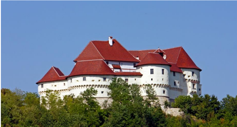
Slika br. 8 Dvorac Veliki Tabor