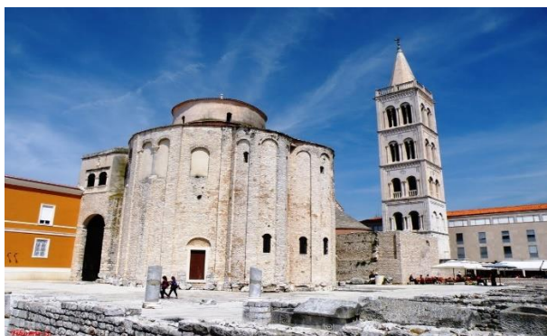
Slika br. 6 Crkva sv. Donata u Zadru

Prošlost je ostavila tragove na svakom koraku, uključujući crkvenu arhitekturu. U Zadru, između ostalih, postoje crkve kao što su: crkva sv. Donata, crkva i samostan sv. Marije, katedrala sv. Anastazije, crkva sv. Krizogona, crkva sv. Franje, crkva Gospe od Zdravlja, crkva sv. Andrije i sv. Petra starijeg, crkva sv. Ilije proroka, crkva i samostan sv. Mihovila, crkva sv. Dominika, kao i ostaci crkve sv. Crkve Svete Nediljice i Stomorice iz ranog srednjeg vijeka. Naime, to su najreprezentativnije i najmonumentalnije crkvene građevine, koje svjedoče o uistinu dinamičnom i stalnom duhovnom životu grada.