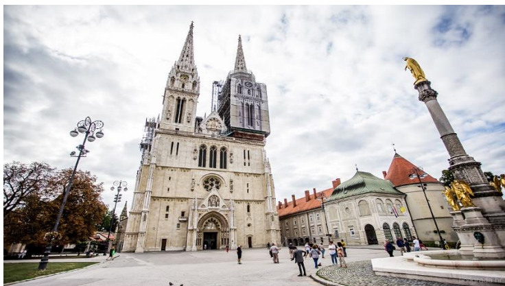
Slika br. 3 Katedrala Uznesenja Blažene Djevice Marije u Zagrebu

Katedrala Uznesenja Blažene Djevice Marije izgrađena u 11. stoljeću, ova veličanstvena katedrala, djelomično srušena nakon potresa 1880. godine, ima novo lice otkako je austrijski arhitekt Hermann Bolle dodao dvije velike kule / strijele koje ovu katedralu čine simbolom Zagreba. Herman Bolle radio je i na dva druga simbola grada Zagreba: groblju Mirogoj i crkvi sv. Unutar katedrale nalazi se grob kardinala Stepinca, zagrebačkog nadbiskupa od 1946. do 1960., godine njegove smrti. Grobnica je napravljena 1991. godine kada je Hrvatska postala neovisna. To je bio način prepoznavanja važnosti tog čovjeka koji je vrijedno radio za neovisnost svoje zemlje i proveo 15 godina u zatvoru jer ga je jugoslavenski komunistički režim osudio za promicanje hrvatskog jezika. Katedrala ima i jedno od najvećih orgulja u Europi.