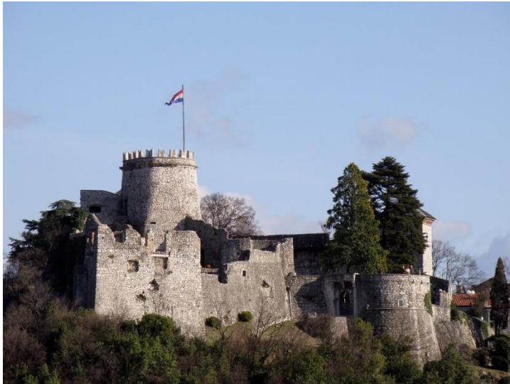
Slika br. 7 Trsatski dvorac

od onih mjesta na kojima se pogled oka podudara sa širinom koja se otvara u nečijem duhu. Plavo more ispred Rijeke, koje puca pred očima posjetitelja kad se penju stepenicama do starog grada, priprema marijanske hodočasnike za njihovo unutarnje putovanje. Trsatski dvorac se nalazi na 110 metara nadmorske visine. No, Trsat otvara i druge vidike, mjesto je bogate kulturne baštine i kao takav idealno šetalište za tijelo i dušu.