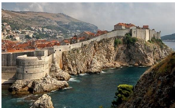
Slika br. 5 Dubrovačke gradske zidine

Utvrde grada s moćnim bedemima dužine 2 km, visine 25 m i 16 stražarskih kula okružuju riznicu arhitektonskih i kulturnih remek-djela savjesno sačuvanih tijekom stoljeća - poput franjevačkog samostana Dubrovnik - pogled na grad i luku obzidanu 14. stoljeća s jednom od najstarijih ljekarni u Europi ili katedralom sv. Vlaha, Gotičkom Kneževom palačom i dominikanskim samostanom koji su sagrađeni u 15. stoljeću. Užitek je prošetati uskim starim ulicama ili se zaustaviti u jednom od brojnih restorana i kafića koji pozivaju na odmor i uživanje u štihi grada i obilnoj, ukusnoj hrvatskoj kuhinji. Ako hodate po bedemu oko grada i penjete se na kule tvrđava, uživat ćete u panoramskom pogledu na stari grad sa zidinama i drevnim krovovima, luku i slikovito okruženje. Drevni grad Dubrovnik s brojnim povijesnim spomenicima 14. i 15. stoljeća nalazi se na UNESCO-vom popisu svjetske kulturne baštine.