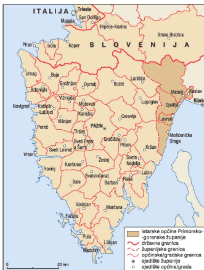
Slika 3. Istarska županija