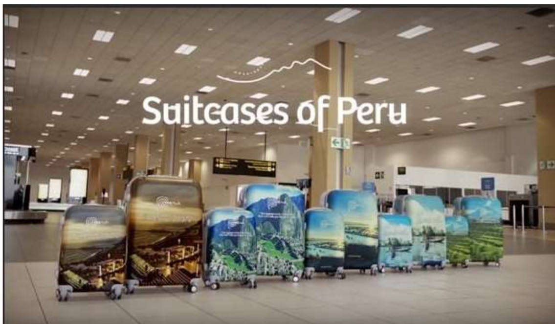
Slika 8. Kampanja “The suitcases of the Peru”