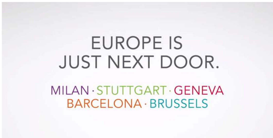
Slika 1. Inovativna kampanja “Europe is just next door”