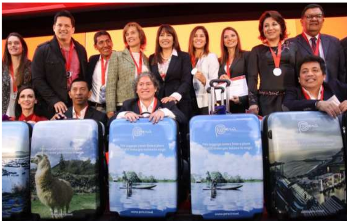
Slika 9. Podijeljeni kovčezi iz kampanje “The suitcases of the Peru”