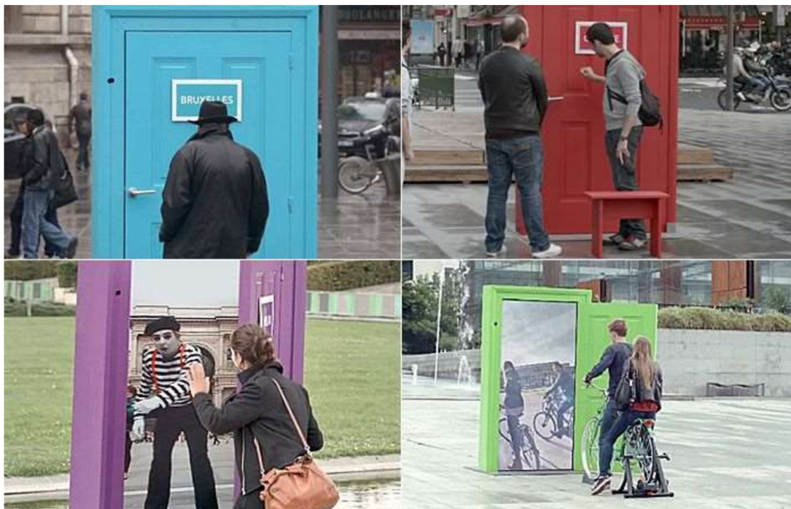
Slika 2. SNCF i kampanja “Europe is just next door”